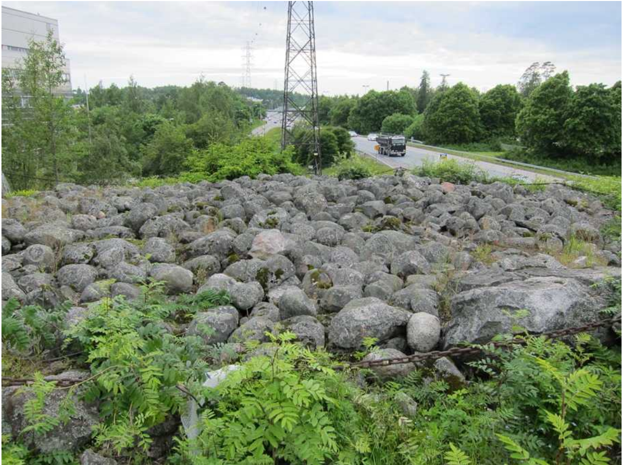
Hautaröykkiö sijaitsee Herttoniemessä Hitsaajankadun ja Itäväylän välissä. Yllä kuvattuna idästä, taustalla Itäväylä ja voimalinjan pylväistö.