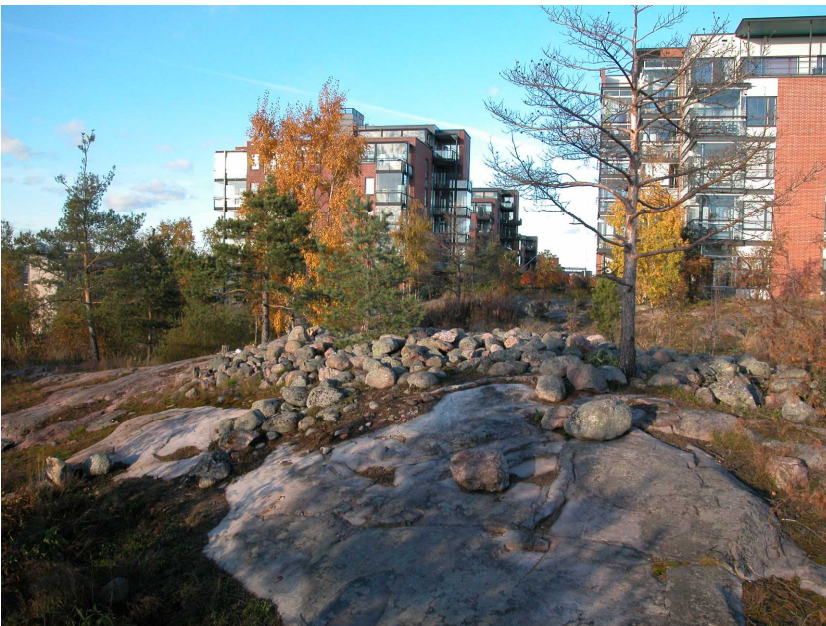
Kuva röykkiön, kun röykkiöstä on vieritetty kiviä ympäristöön. 12.10.2004.