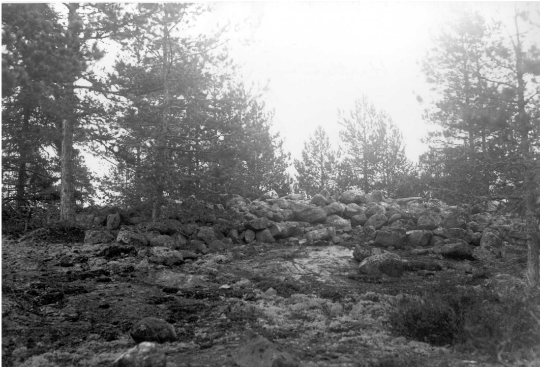
Kuva rökkiöstä vuodelta 1929.