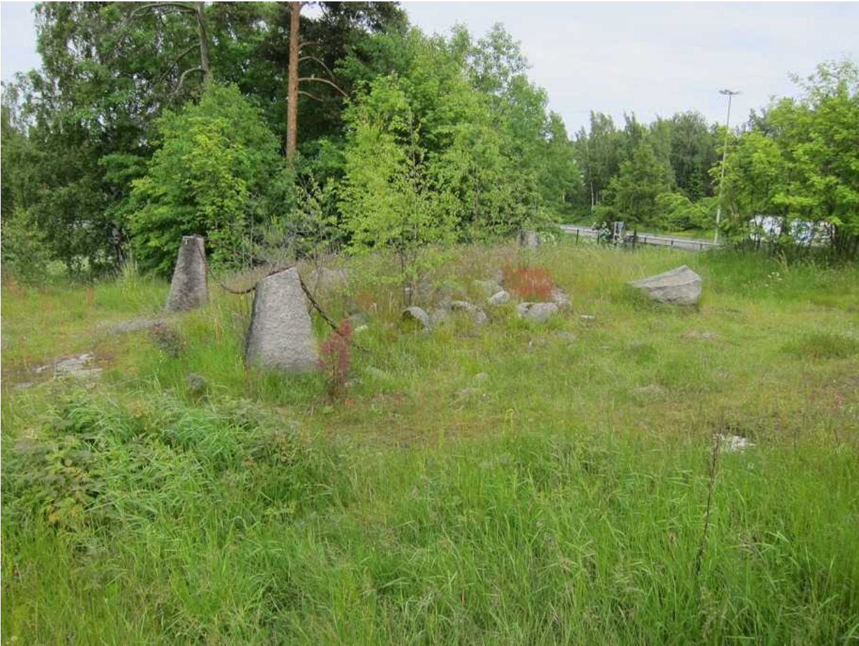
Yleiskuva kohteesta lännestä kuvattuna. Taustalla Itäväylän liikennettä.

Pronssikautinen hautaröykkiö, Hitsaajankadun ja Itäväylän väli, mjrek. 91010021