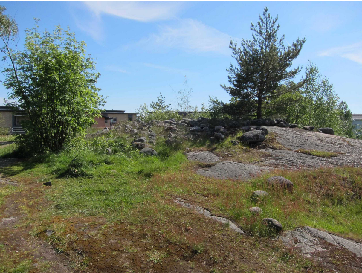
Kohde pohjoisesta kuvattuna. Röykkiön päällä ja reunoilla kasvaa lehtipuiden vesoja, vadelmaa sekä reunalla kookkaampia pihlajia. Pihlajien ja vesojen poistamisella röykkiön muoto tulee paremmin esille. 13.6.2015.