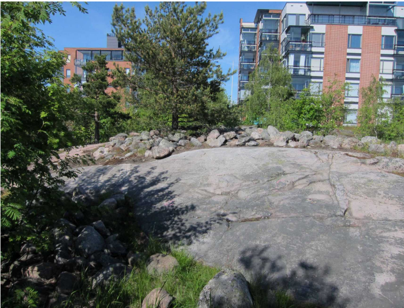
Edellisen kuvaparin kanssa lähes samasta kuvakulmasta otetut kuvat. Kuva etelästä. Sama mänty kasvaa röykkiön keskellä.