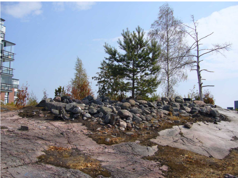
Kuva röykkiöstä peruskunnostuksen jälkeen. 9.8.2005.