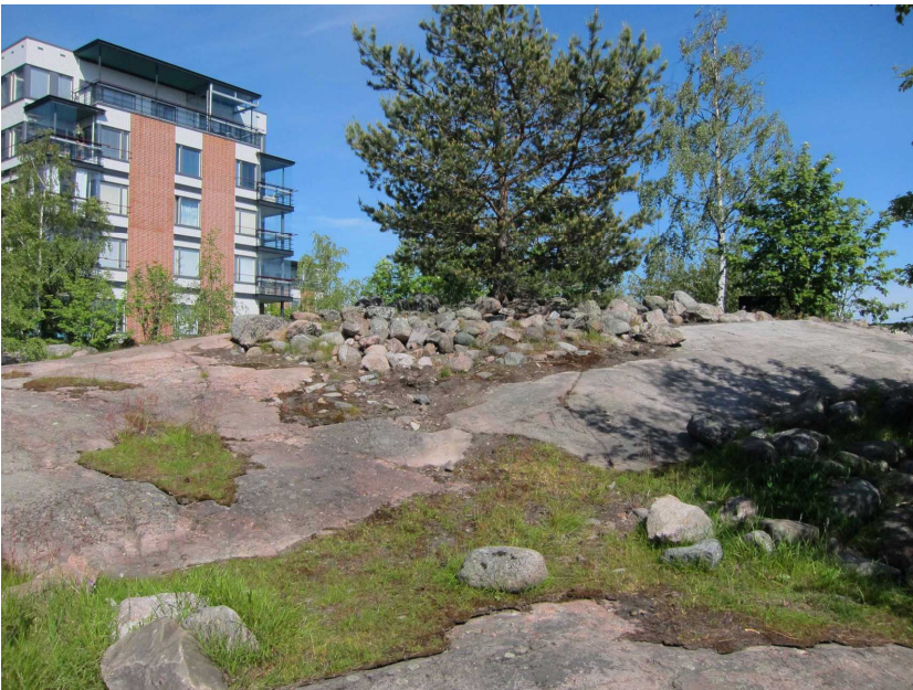
Kohde lounaasta kuvattuna. Kallion rinteillä on joitakin röykkiöstä vieritettyjä kiviä.