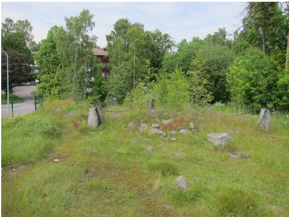
Kulosaaren puistotien röykkiö etelästä kuvattuna. Taustalla Kulosaaren puistotie. Yksi röykkiötä reunustavista kivipaasista on kaadettu. Röykkiön päällä kasvaa mm. koivun taimia ja korkeaa heinää ym. kasveja. 22.6.2015.