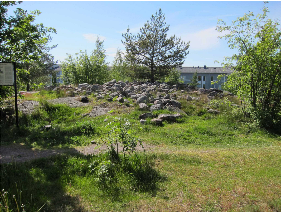
Kuva pohjoisesta vuodelta 2015. Vesakkoa raivataan muutaman metrin säteellä rökkiöstä.