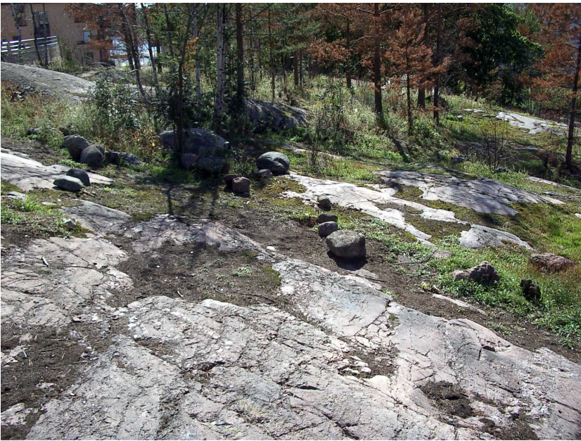
Kuva röykkiön alarinteestä, kun röykkiöstä on vieritetty kiviä.