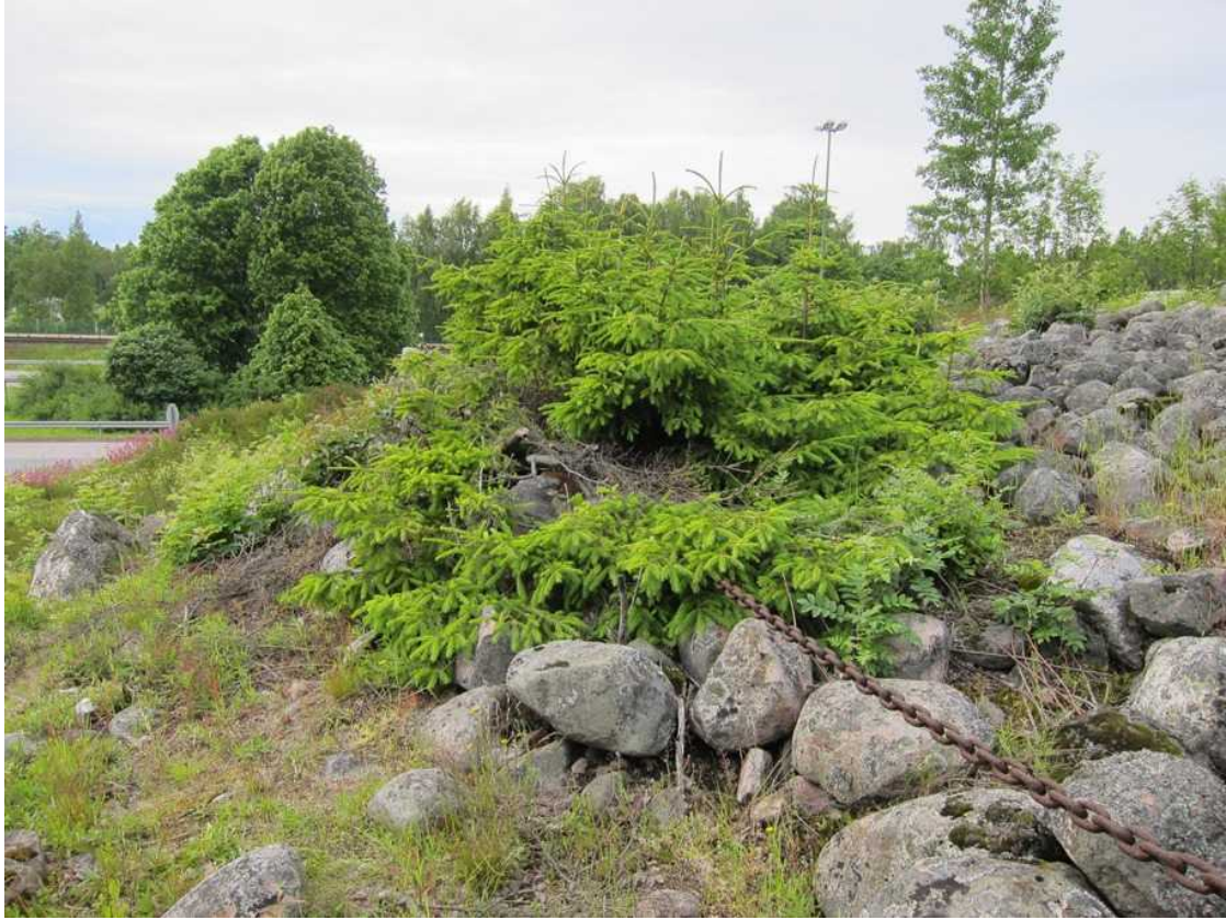
Röykkiön länsilaidalla kasvaa matalia kuusentaimia, jotka poistetaan hoitotoimenpiteissä. Seuraavissa kahdessa kuvassa näkyy myös röykkiön päällä kasvavia lehtipuiden taimia, jotka poistetaan.

Kohteella ei ole havaittu voimakasta ilkkivaltaa. Mainitut hoitotoimenpiteet edesauttavat röykkiön säilymistä ja sen näkyvyyttä ja toiminta sopii mainiosti arkeologian harrastajien tehtäväksi.