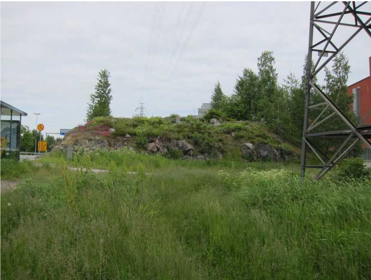
Kohde kuvattuna lännestä. Röykkiö erottuu hieman huonosti kallion päältä, lähinnä erottuvat sitä ympäröivät kivipaadet. Röykkiön ympäristö on raivattu korkeasta puustosta voimalinjan johdosta. Röykkiön länsipuolella maasto laskee jyrkästi.