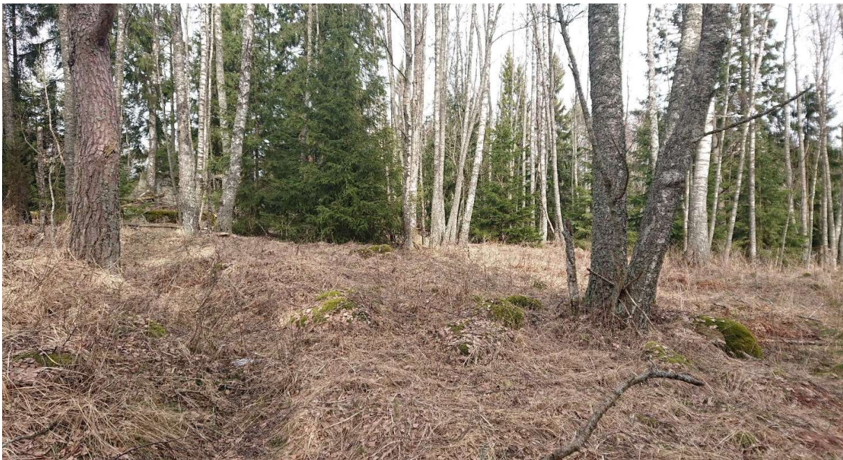
Kuva 2 Yleisnäkymä hiljalleen kuusten valtaamasta metsälaitumesta