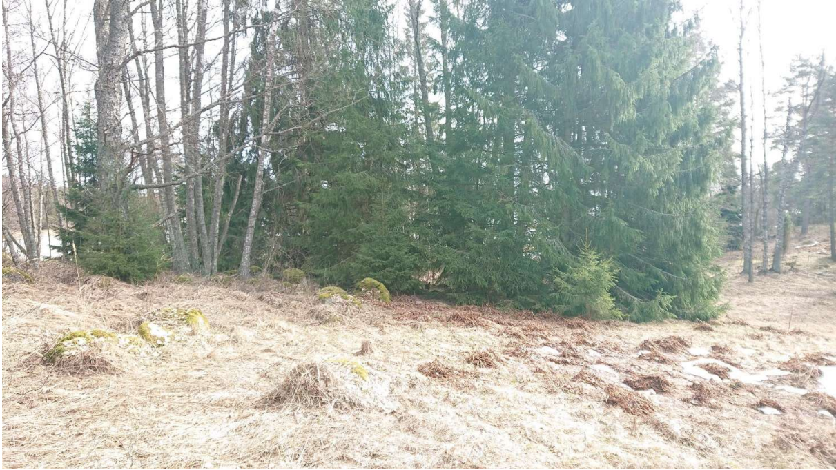
Kuva 3 Näkymä kohti kuusten valtaamaa vanhaa kellarin pohjaa