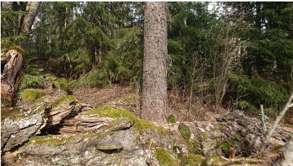
Kuva 4 Kellarin pohjan itäosan näkyvyyttä peittävät alikasvoskuuset