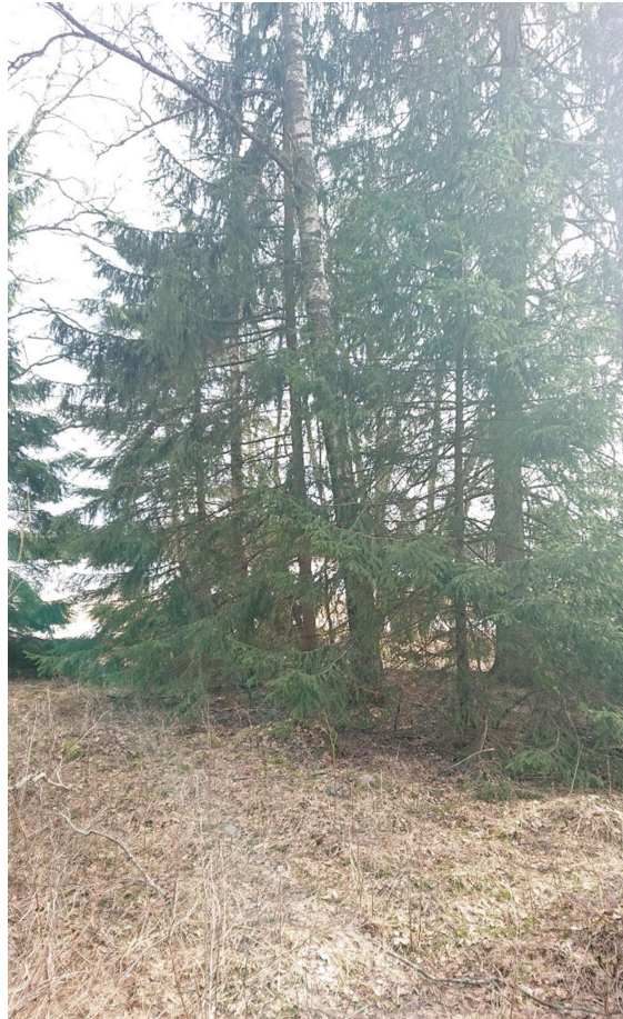
Kuva 1 Yleisnäkymä hiljalleen kuusten valtaamasta metsälaitumesta