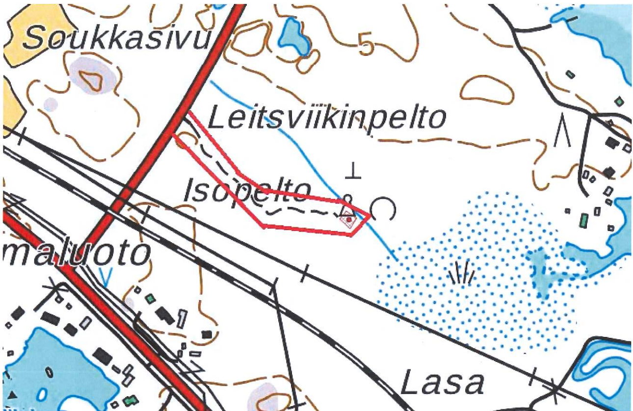
Koskelon muinaisjäännösalueen ja hoitoalueen rajaus