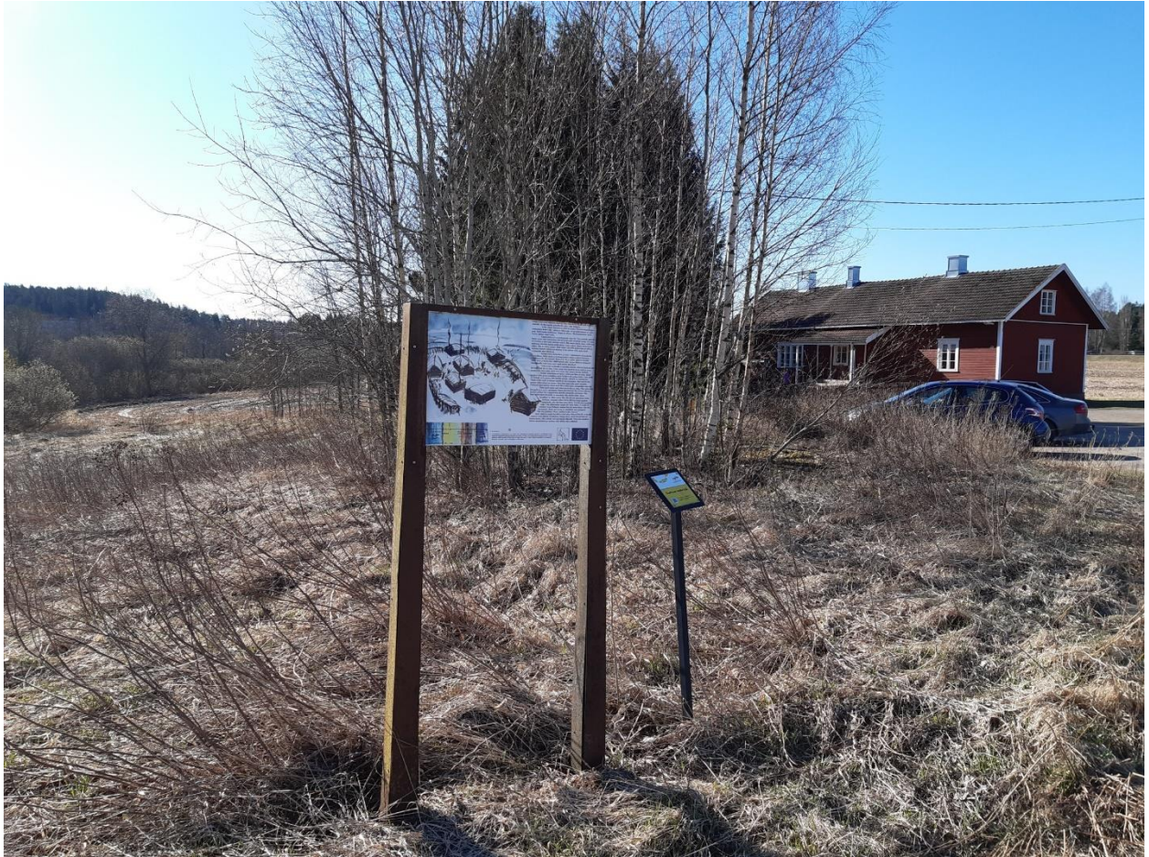
Euran kunnan pystyttämät opastaulut. Taustalla vanha Luistarin talo, jossa toimii päiväkoti Kulkunen