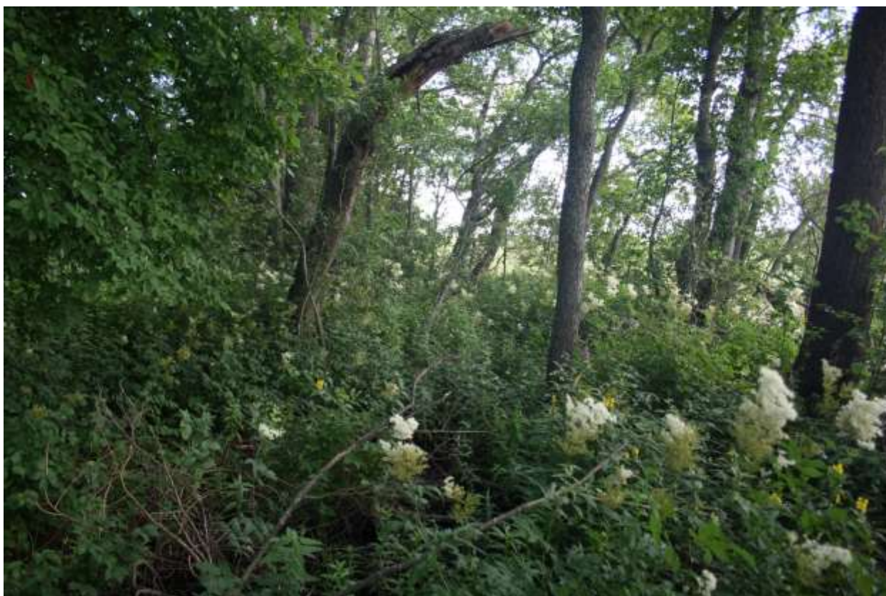
Saaren rannoilla ja eteläpäässä on runsas lehtokasvillisuus.