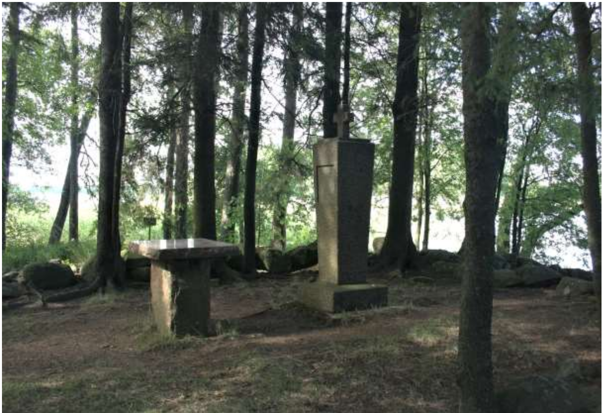
Alttari ja muistomerkki.

Kirkkokari kuuluu myös Köyliönjärven Natura 2000 –alueeseen ja se on merkitty maakuntakaavaan luonnonsuojelulain nojalla suojelluksi tai suojeltavaksi luonnonsuojelualueeksi (sl). Merkintää koskevan suunnittelumääräyksen mukaan alueen maankäyttöön mahdollisesti vaikuttavista merkittävistä suunnitelmista ja hankkeista tai ennen vallitsevia olosuhteita merkittävästi muuttaviin toimenpiteisiin ryhtymistä tulee luonnonsuojelusta vastaavalle alueelliselle ympäristöviranomaiselle varata mahdollisuus lausunnon antamiseen. Kaavan merkintää koskee myös suojelumääräys, jonka mukaan alueilla ei saa toteuttaa sellaisia toimenpiteitä tai hankkeita, jotka voivat oleellisesti vaarantaa tai heikentää alueen suojeluarvoja. Alueella voidaan kuitenkin valtion luonnonsuojeluviranomaisen niin salliessa toteuttaa alueen suojeluarvojen säilyttämiseksi ja palauttamiseksi tarkoitettuja toimenpiteitä.