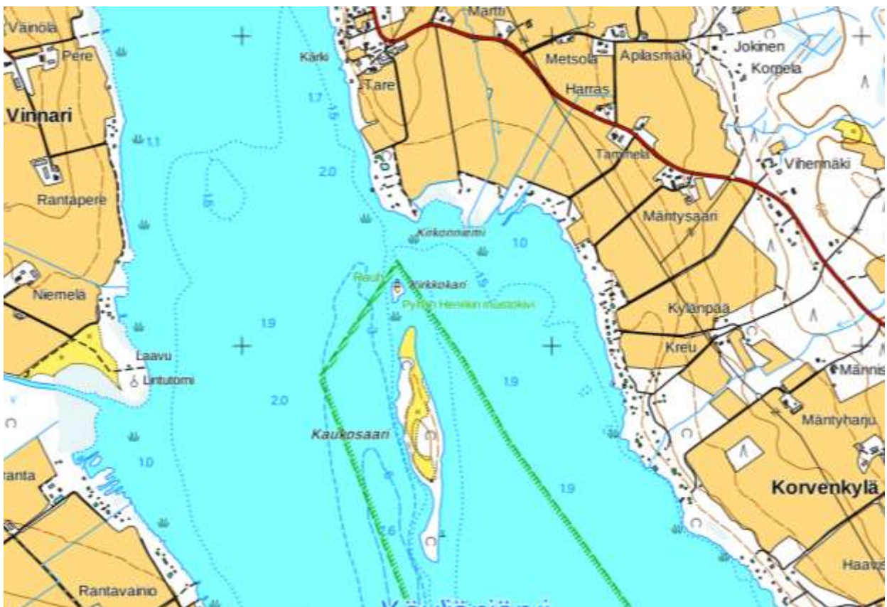
Kartta: Maanmittauslaitos, Paikkatietoikkuna

Kunta Säskylä Koordinaatit (ETRS-TM35FIN) 6788201, 248501 Peruskartta 113411 Köyliönjärvi