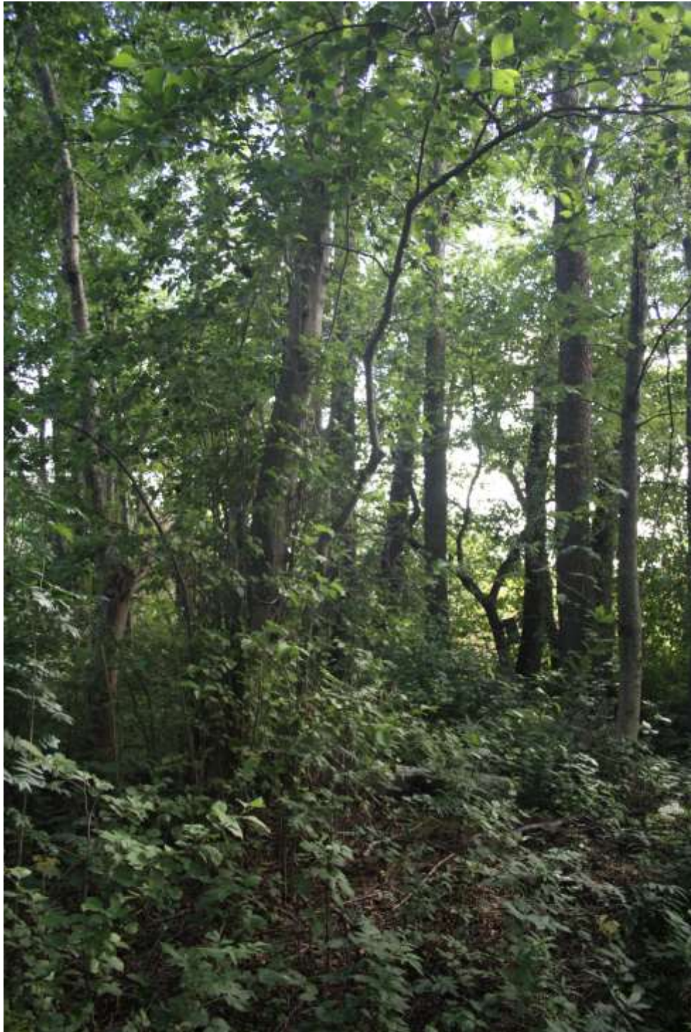
Kirkkokarin eteläpää on rehevää lehtoa ja luonnonsuojeluetta.

Maankäyttö Kirkkokari sijaitsee kahden yhteisen vesialueen rajalla: Köyliönjärven länsipuoli I ja Mustanojansuu sekä Köyliönjärven itäinen osa. Molempien omistajaksi on nimetty järjestäytymätön osakaskunta. Köyliön vanhakartano on molemmissa merkittävä osakas. Alueella ei ole hyödyntämispaineita, mutta matkailu tulee lisääntymään. Kirkkokari kuuluu Köyliönjärven Natura 2000 -alueeseen ja se on merkitty maakuntakaavaan luonnonsuojelulain nojalla suojelluksi tai suojeltavaksi luonnonsuojelualueeksi (sl).