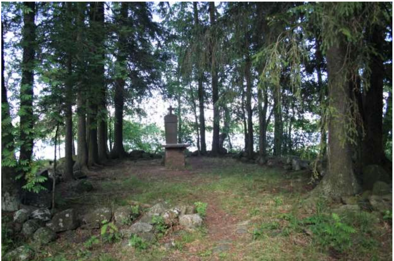
Saarella sijainneen kappelin paikka on merkitty kivillä. Alueen keskellä on muistomerkki ja alttari.

Kirkkokari kuuluu Köyliönjärven valtakunnallisesti arvokkaaseen maisema-alueeseen, joka on nimetty myös Kansallismaisemaksi. Saari sisältyy myös Köyliönsaaren vanhakartanon ja kirkon historiallinen maisema -nimiseen valtakunnallisesti merkittävään rakennettuun kulttuuriympäristöön. Saarelle kuljetaan keskiajalta periytyvän, valtakunnallisesti merkittävän Huovintien kautta, joka on juuri tältä osuudeltaan nimetty myös valtakunnalliseksi museotieksi.