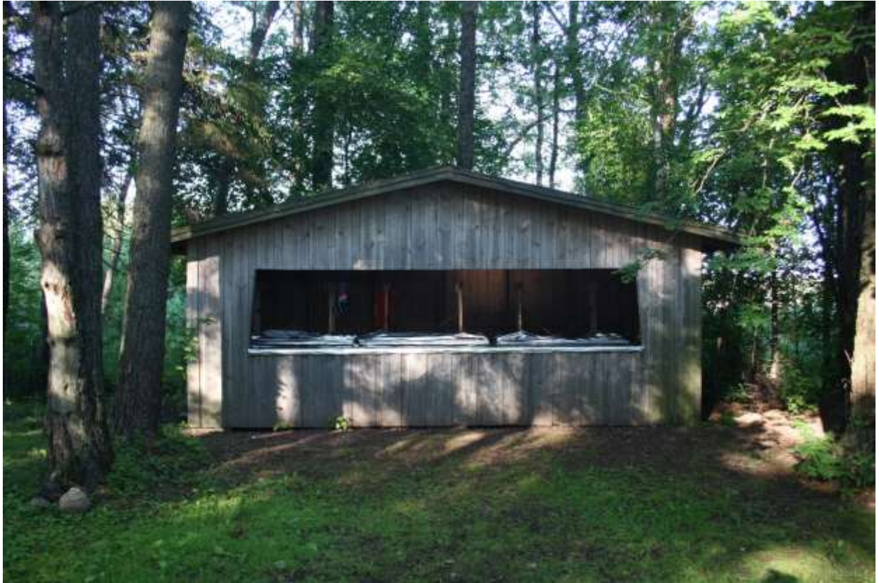
Rannassa on kesäkuun pyhiinvallusta varten kahvikoju ja pöytiä, jotka on päällystetty alumiinipaperilla. Toinen opastaulu on vinossa.