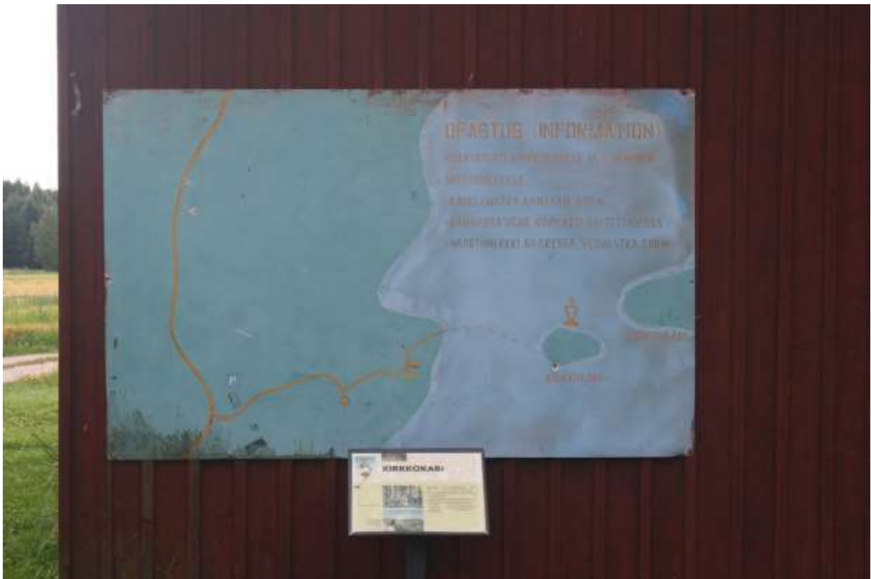
Opasteet kaipaavat uusimista.

Kirkkoniemessä (Taren rannassa) on Museoviraston infotaulu suomeksi, ruotsiksi ja englanniksi. Rannassa on laituri ja soutuvene, joka on vapaasti lainattavissa. Soutumatka saareen on noin 200 metriä (noin 10 min). Ryhmät voivat varata lauttakuljetuksen Ristolän kyläyhdistykseltä.