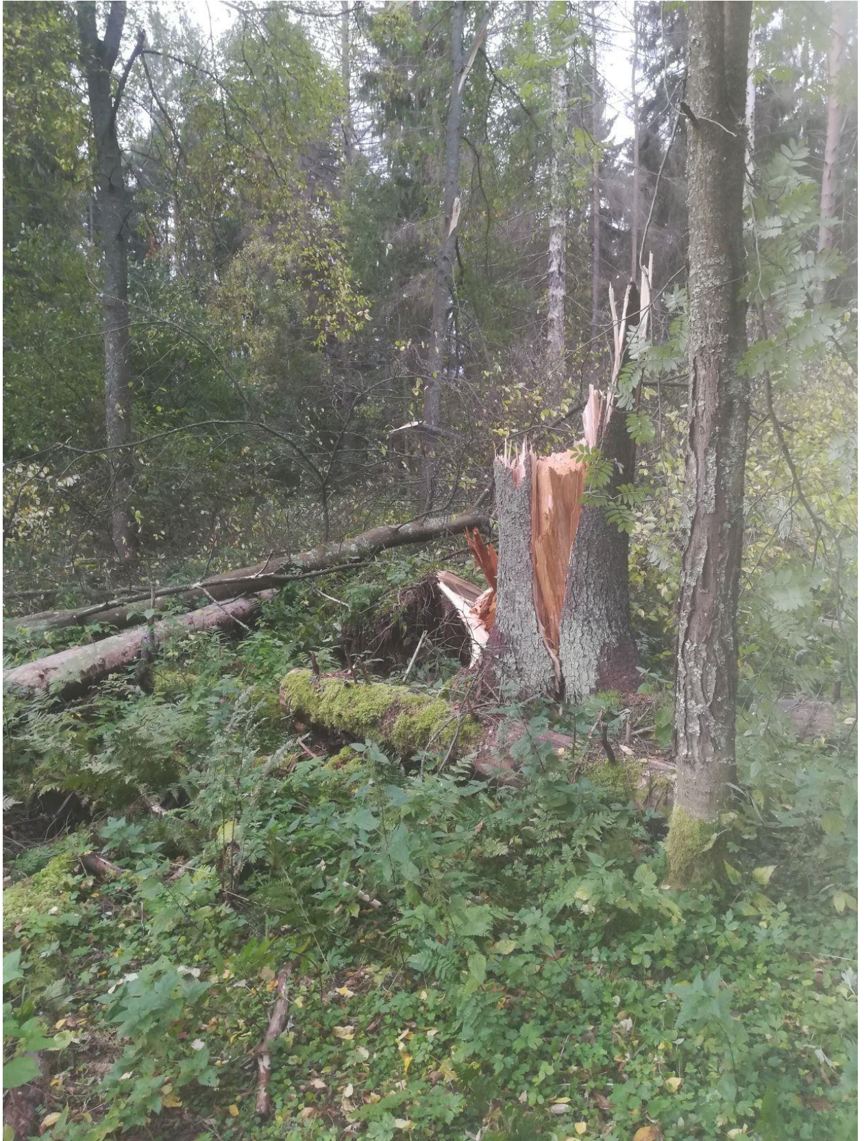
Liikistö syksyllä 2020