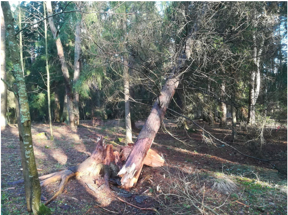
Liikistö syksyllä 2020