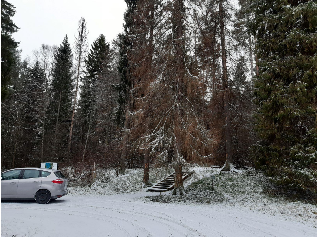
Liikistö marraskuussa 2019