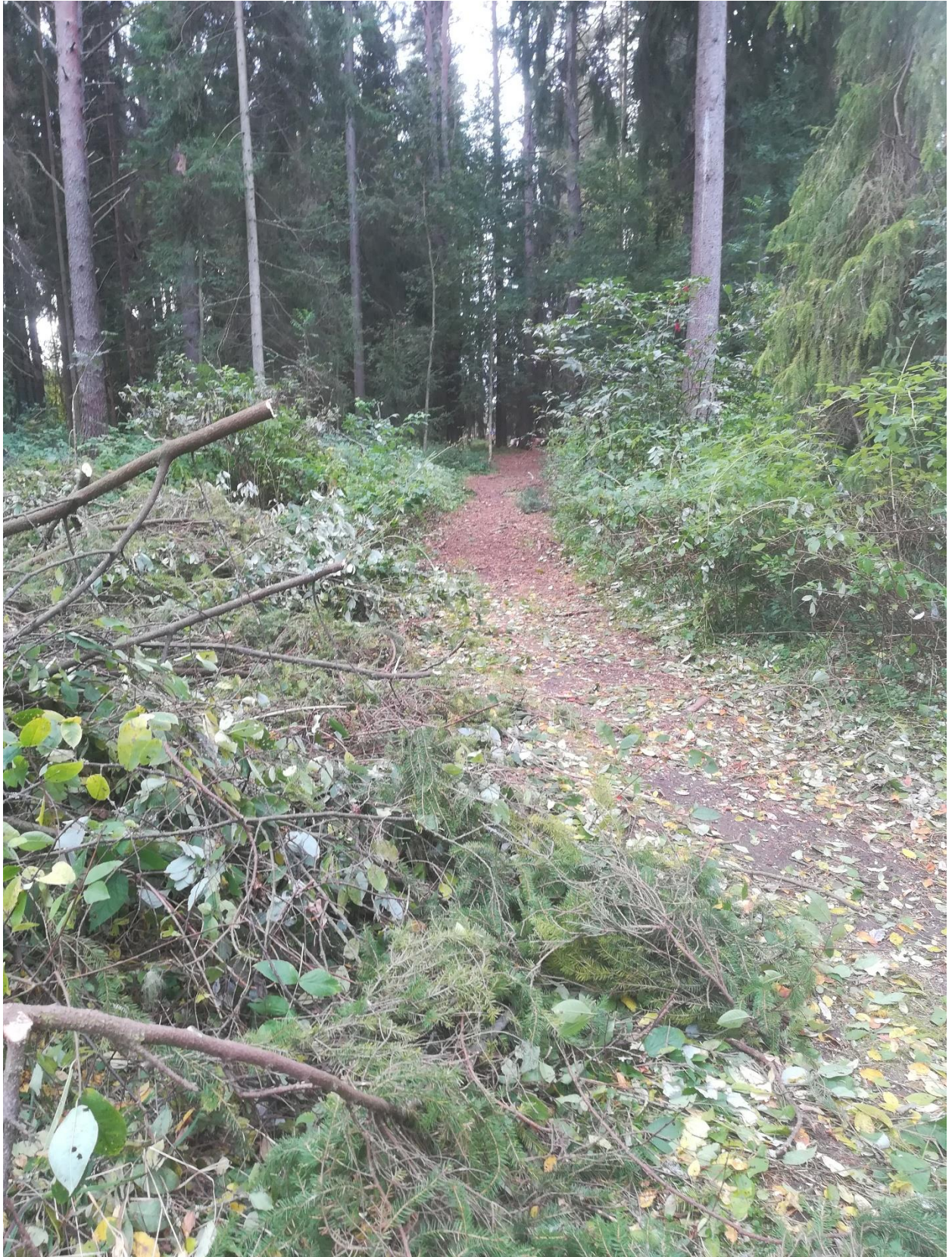
Liikistö syksyllä 2020