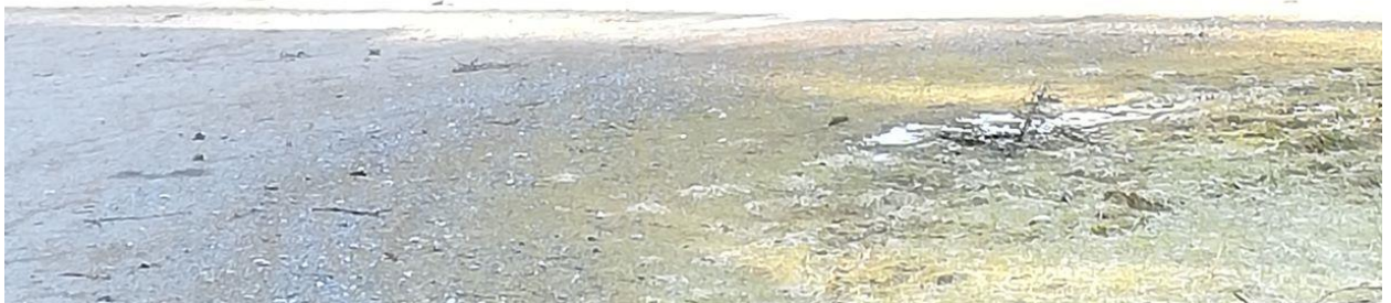
Liikistö syksyllä 2020