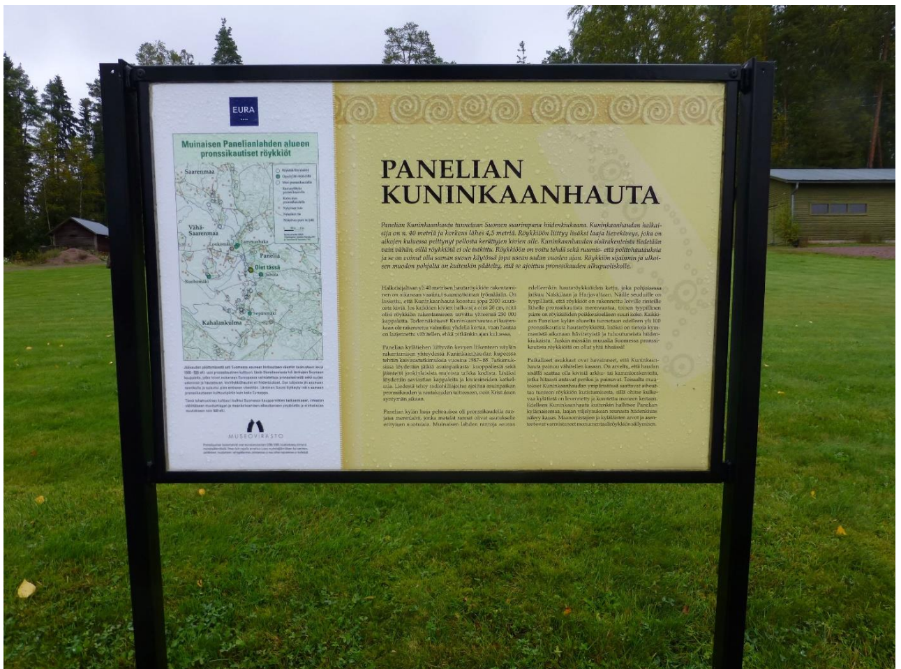
Euran kunnan ja Museoviraston v. 2011 pystyttämä opastaulu Kuninkaanhaudalla.

Käyttömahdollisuudet pienimuotoisena nähtävyyks- ja opetuskohteena ovat hyvät. Paikalla on opastaulu.