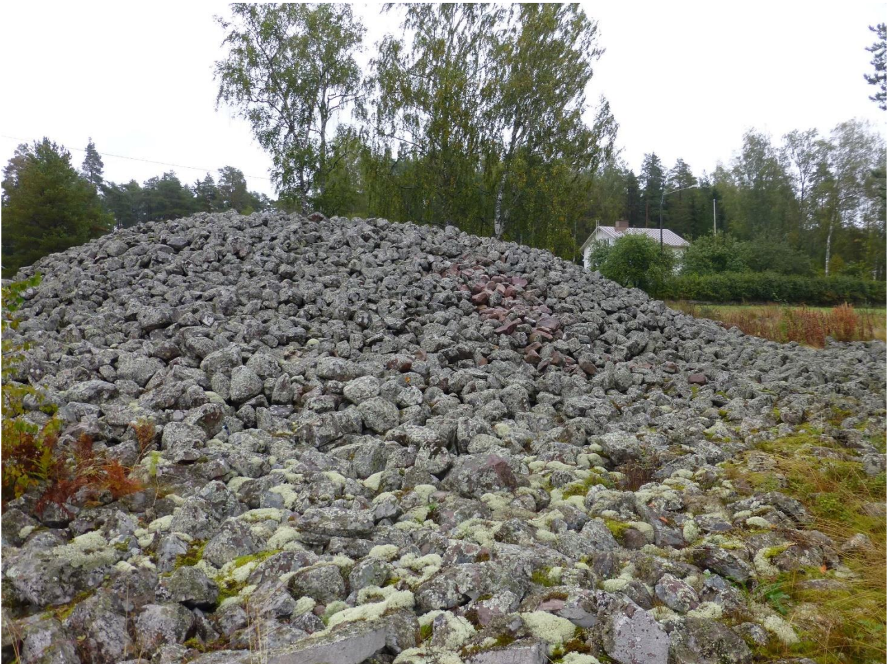
Kuninkaanhauta kuvattuna v. 2015 lännestä. Keskellä näkyvässä v. 2015 pengottu kohta.