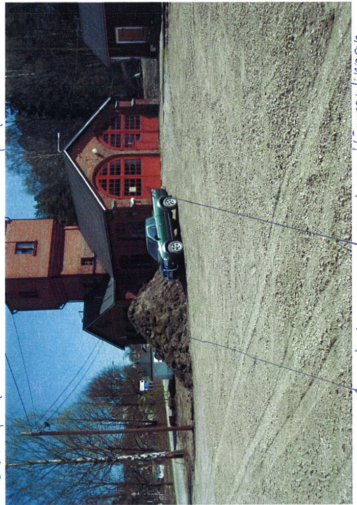
Kasa 1, tallin takaa