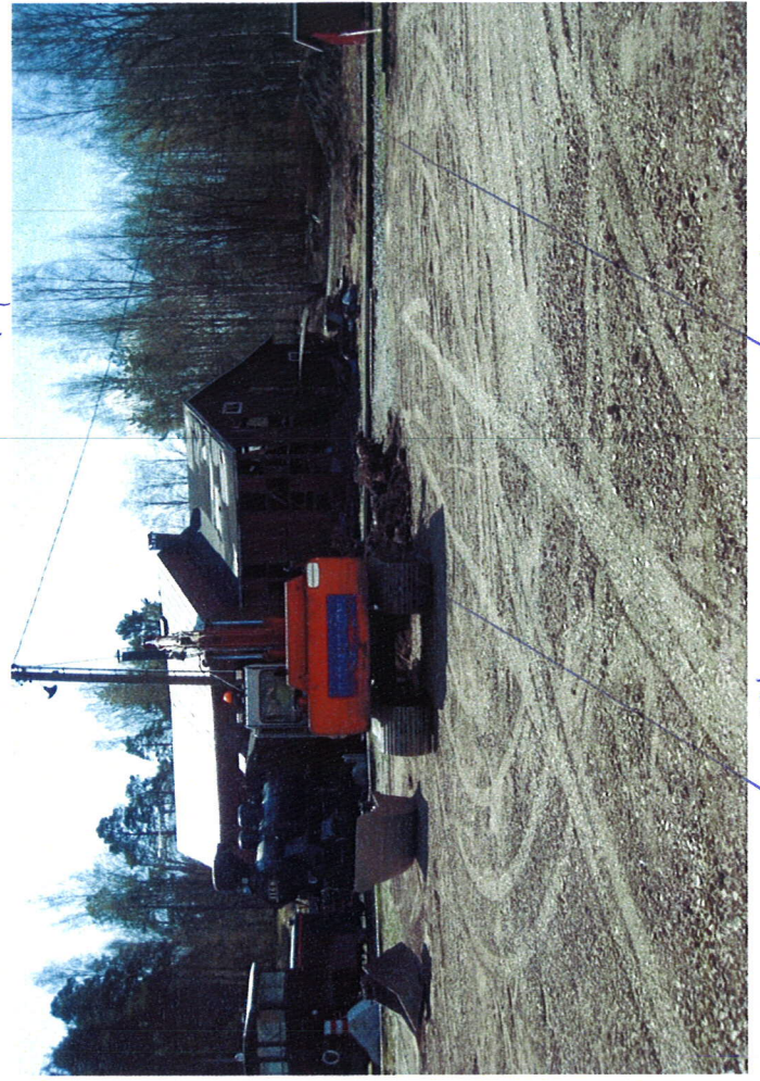
2. Veturi: talli