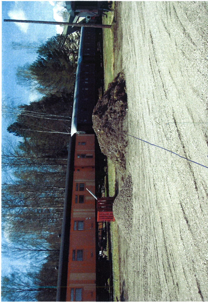
Kasa 3 radoin varressa, poislehty ko lonsalitz