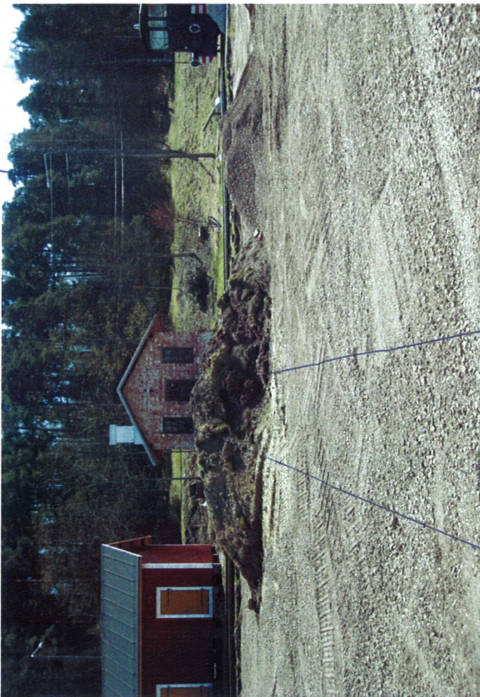
Kasa 2 poyan edessa Uusi paja