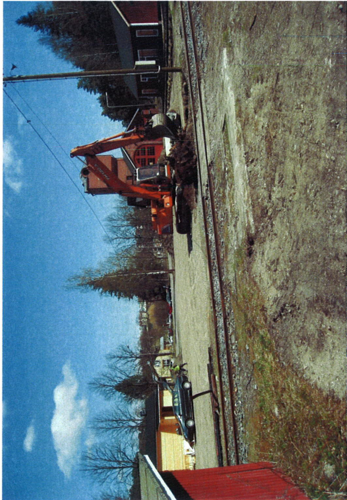
Näkymä rotakadun suunnasta