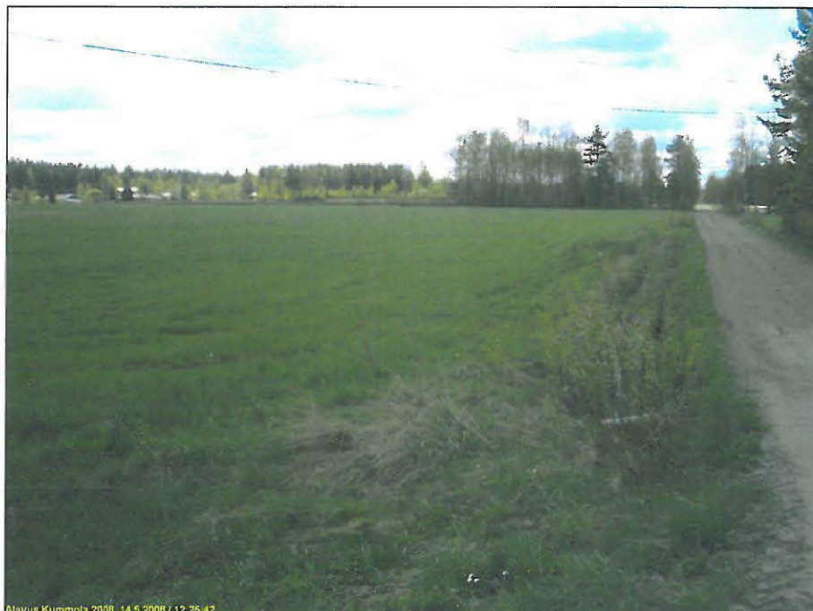
Tutkimusalueen pohjoisosaa kuvattuna etelään. Oikealla Kumolantie.