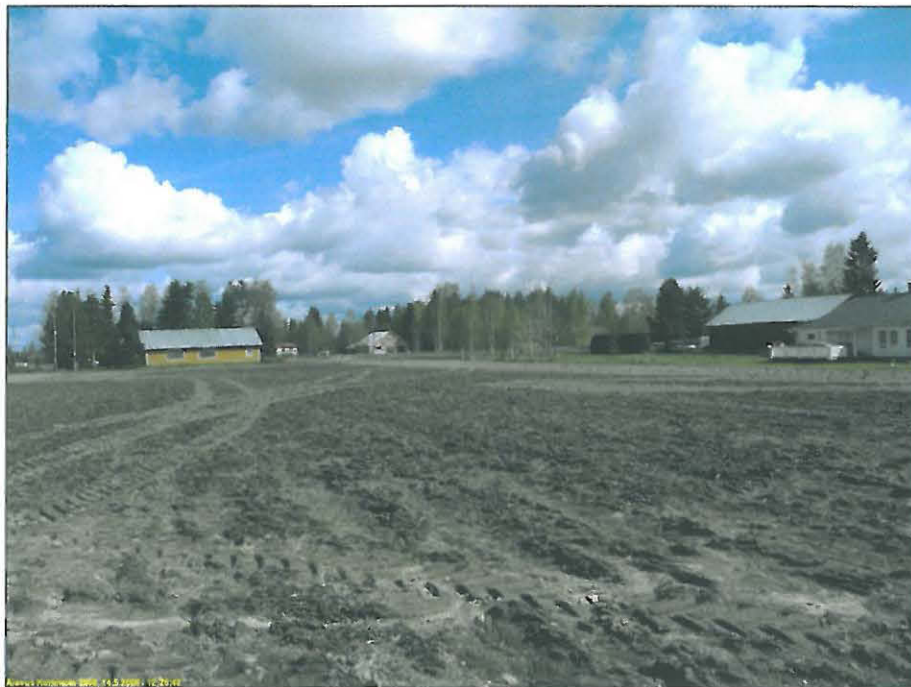
Kumolan kaava-alueen itäosa, kuvattu itään.