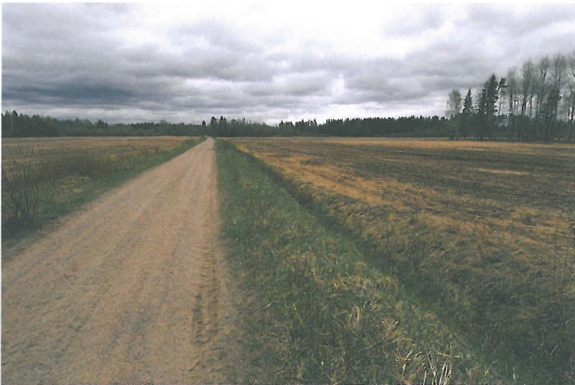
Loppi Vojakkala. Sähkölinja kulkee kuvassa näkyvän peltoaukean takana, alue kasvaa vesakkoa. Vojakkalan kylä sijaitsee linjan takaisen metsäharjanteen eteläpuolella. Huom. kuvassa oleva tie johtaa Vojakkalan kylään, mutta se ei ole tekstissä mainittu tie. Kuvattu luoteesta. (DG147)

Vojakkala on Lopen vanhimpia kyliä, asutusta siellä on ollut jo keskiajalla. Vanhimpien verotietojen mukaan kylässä oli kuusi asuttua taloa vuonna 1539. Kylän vanha asutus on sijainnut ainakin kuninkaan kartaston mukaan nykyisen, järven pohjoisrantaa seurailevan, tien tuntumassa. Voimajohto leikkaa Vojakkalan suojelualan nykyisestä kylästä noin 400 metriä pohjoiseen, metsäharjanteen takana. Voimajohdon alue oli vesakoitunut ja havaintojen teko oli vaikeaa. On kuitenkin epätodennäköistä, että vanha asutus olisi ulottunut sinne saakka.