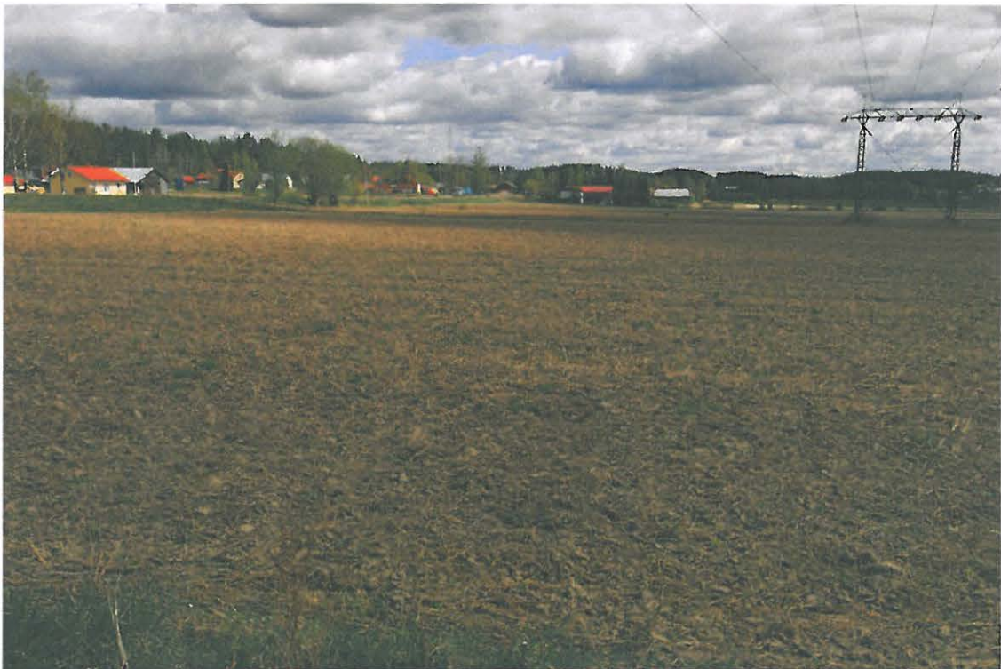
Tammela, Portaan kylä. Voimalinja kulkee kylän eteläpuoleisella peltoaukealla. Kuvattu lännestä. (DG146)

Voimajohto kulkee Portaan suojelualueen läpi, mutta kuitenkin siinä määrin etelämpänä pellolla, että siellä tuskin on keskiaikaan tai historialliseen aikaan liittyviä jäännöksiä, ainakaan niistä ei ole merkintään kartta-aineistossa eikä mitään siihen viittaavaa myöskään löydetty inventoinnin yhteydessä.