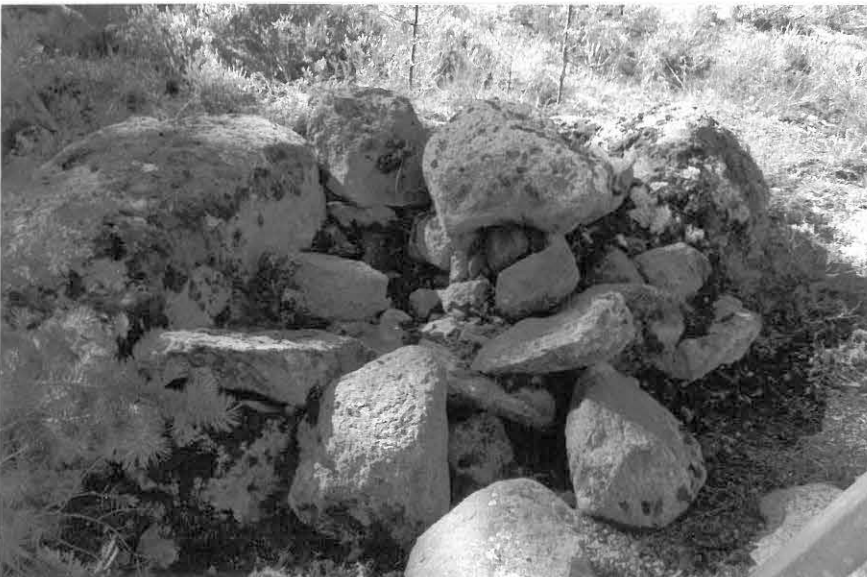
(Neg. 53474) Lähikuva. Takametsän röykkiö. Länneestä