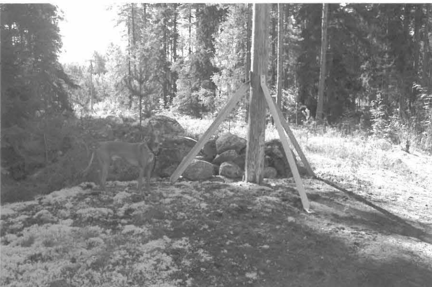
(Neg. 53473) Yleiskuva. Takametsän osittain tuhoutunut röykkiö. Etelästä