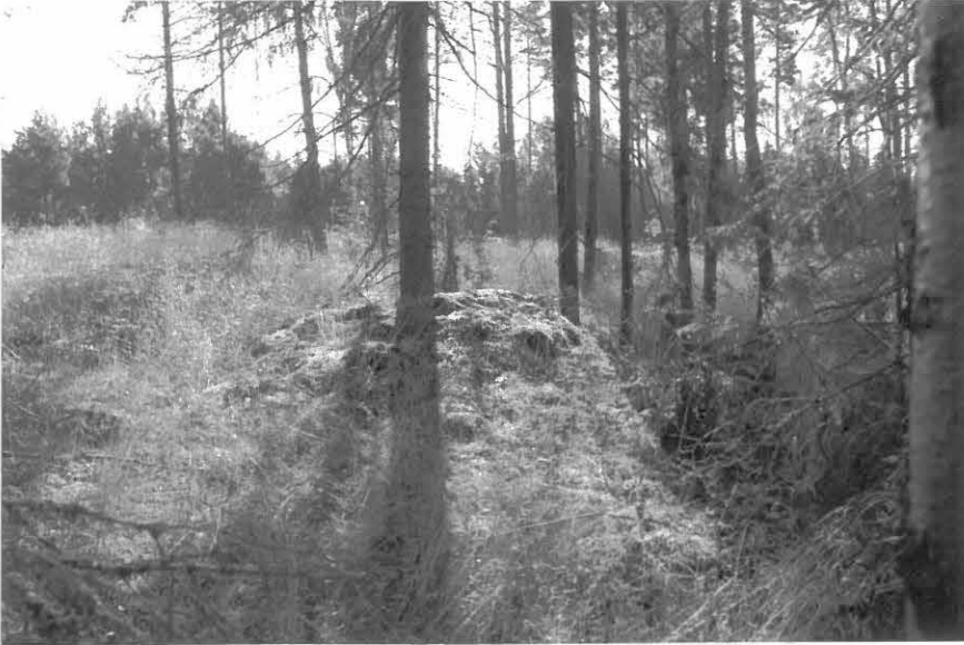
(Neg. 53472) Korttilanpohjan röykkiö. Taustalla Syväsatamantien valopylväitä. Länneestä