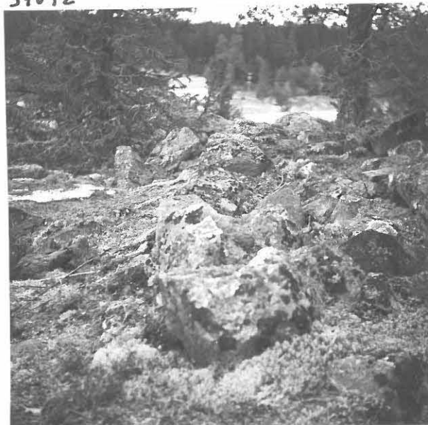
2. VAREEN REUNAKIVIA.