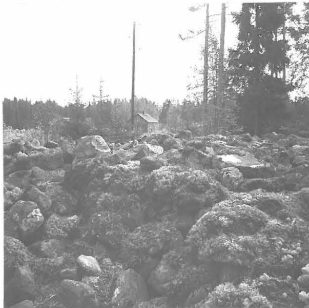
2. KUVA VAREEN LÄNSILAILDALTA ITÄÄN. TAUSTALLA AROMAAN TALO