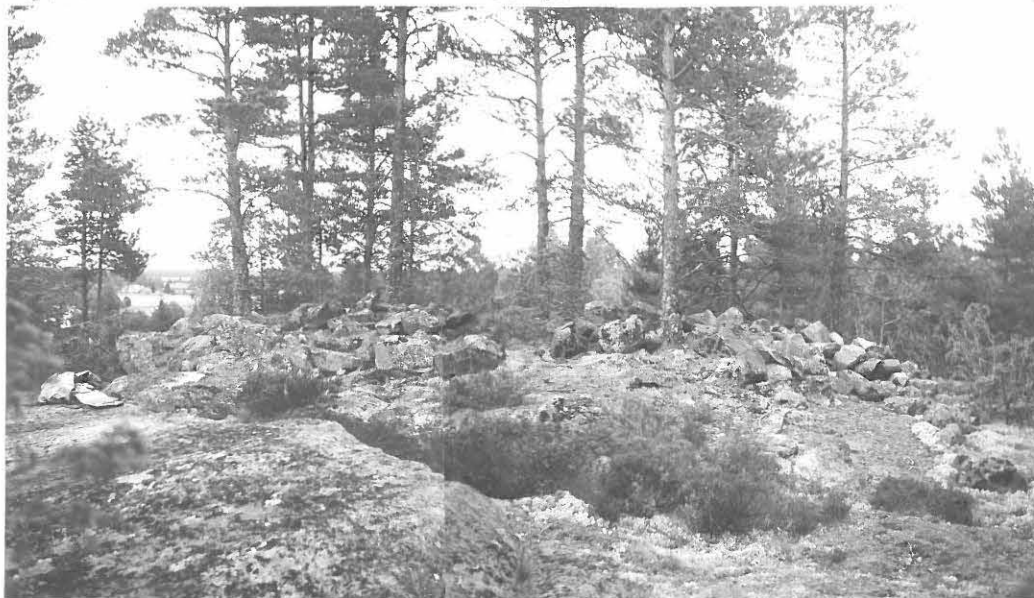
1. PULLANVUOREN VARE LOUNAASTA, VASEMMALLA EROTTUV REUNAKEHÄÄ. OIKEALLA IRTOKIVIA.