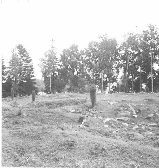
1. KUVATTU KUUSESTA LINNAN ETELÄPUOLELTA