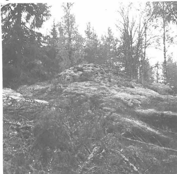
1. VARE a) POHJOISESTA