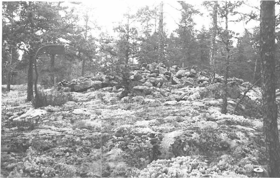
1. HITTENVAREN KALLION VARE a) LOUNAASTA. VASEMMALLA RAUHBITUSKILPI