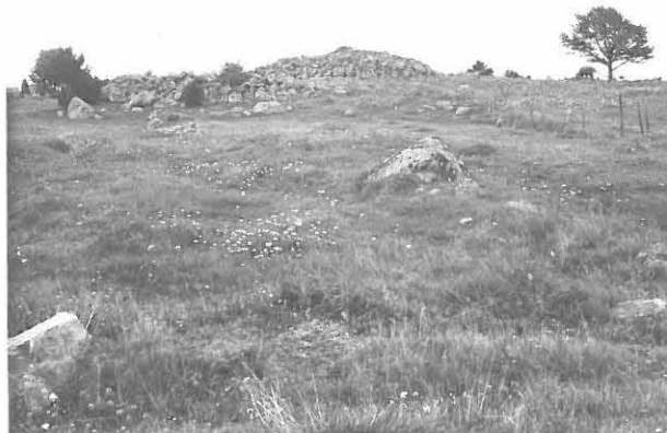
RAUNIO KUVATTUNA JOEN RANNASTA