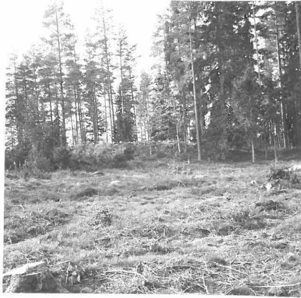
1. VARE KOILLISESTA, HAKKUU- AUKIOLTA.