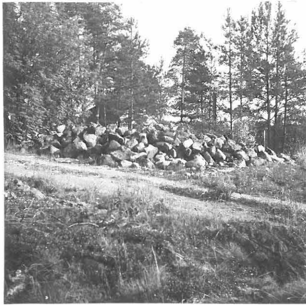
VARE LÄNNESTÄ. ETUALALLA HAA= PASEN TALOON (VASEMMALLA) VIEVÄ TIE. M. HUURRE 1965