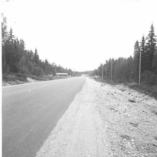
RAUMAN-PORIN MAANTIETÄ KUVATUNNA ETELÄSTÄ, ETUKÄMPIN TIENAISTEYKSEN S-PUOLELTA. KÄMPPI TIEN LÄNSIPUOLELLA, SEN EDESTÄ MENEÄ KUIVALANDEN TIE VASEMMALLE, ETELÄPUOLELLA TAMISTO. IRJANTEEN TIE LÄHTEE OIKEALLE