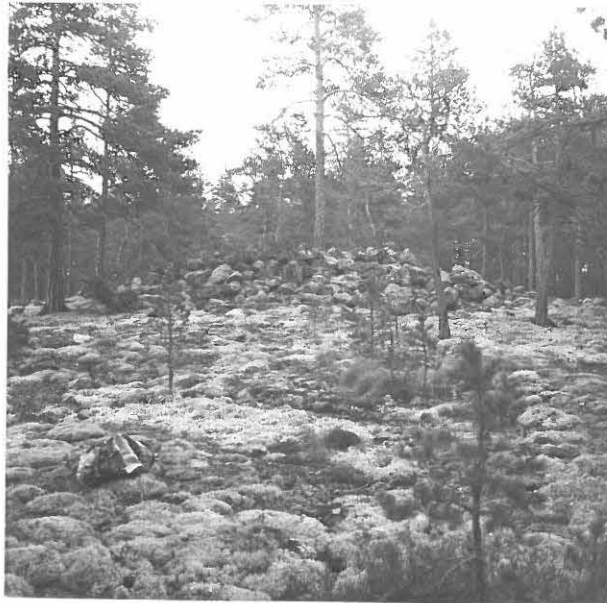
2. VARE a) LUOTEESTA