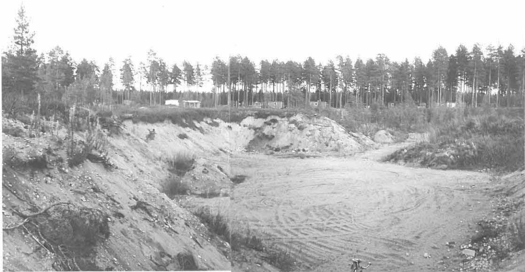
1. KUVA HIEKKAKUOPAN LÄNSIPÄÄSTÄ ITÄÄN. Löytöjä reunoilta, vaasinkin vasemmalta etualalta. Taustalla TVL:n asuntosalve.