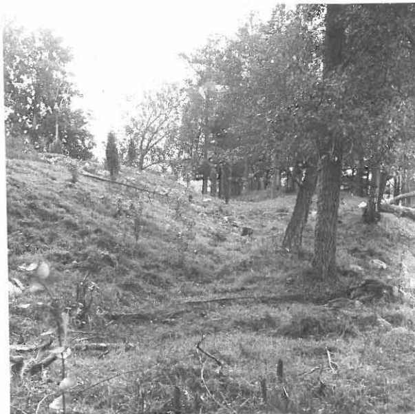
2. VALLIA LINNAN KAAKKOISSIVULLA