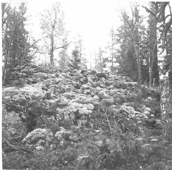
2. VARE a) LÄNNESTÄ