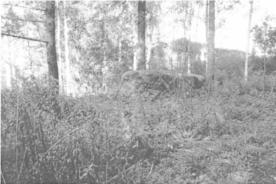
Lahden kaupunginmuseon kuva-arkisto n:o 33019. Kuppikivi kuvan keskellä. Taustalla asuinrakennus, jota rakennettaessa räjäytetty toinen kuppikivi. Kuvattu kaakosta. Kuva: Timo Sepänmaa.

Sepänmaa 2002: Kivi ilmeisesti samassa kunnossa kuin vuoden -67 inventoinnissa. Lähialuetta rakennettu. Kivi merkitty kaavaehdotukseen - ei tuhoutumisuhkaa.