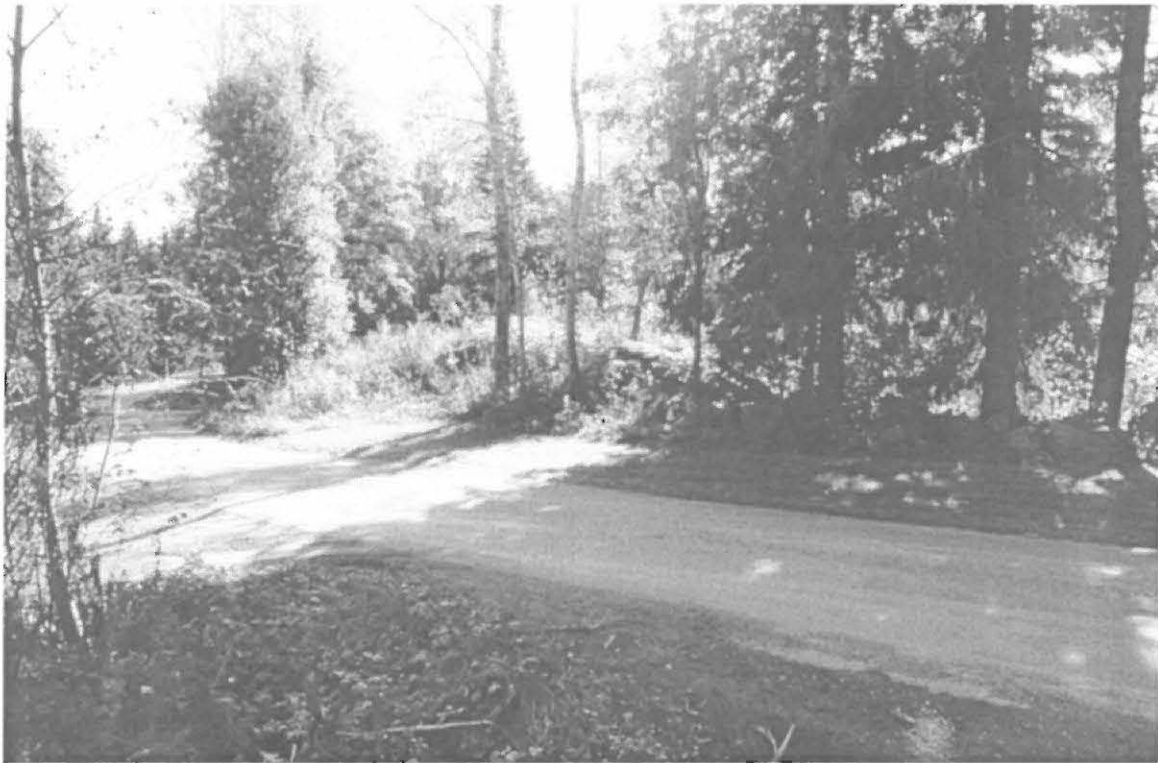
Kuppikivi tai -kallio kuvan keskiosassa tien toisella puolella. Kuvattu luoteesta.

Sepänmaa 2002: Kivi on säilynyt ilmeisesti samassa kunnossa vuoden -86 tarkastuksen jälkeen. Kivi merkitty kaavaehdotukseen - ei tuhoutumisuhkaa