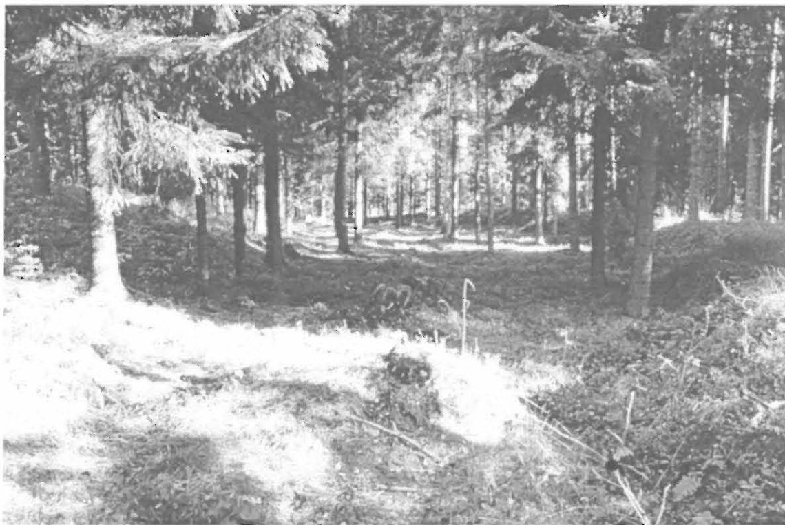
Lahden kaupunginmuseon kuva-arkisto n:o 33017. Luontaisia muinaisia rantavalleja. Kuvattu eteläisimpien vallien eteläpäästä. Jääsjärvi oikealla kuvan ulkopuolella. Kuvattu etelästä. Kuva: Timo Sepänmaa.

Sepänmaa 2002: Kyseiset muodostumat ovat allekirjoittaneen mielestä selviä luonnonmuodostumia, tosin harvinaisen selviä rantavalleja. Geologista arvoa kohteilla lienee. Alueelle tullaan rakentamaan huviloita, mutta vallit on huomioitu kaavassa ja rakennustapaohjeissa siten, että ne tulevat jäämään rakentamattomiksi.