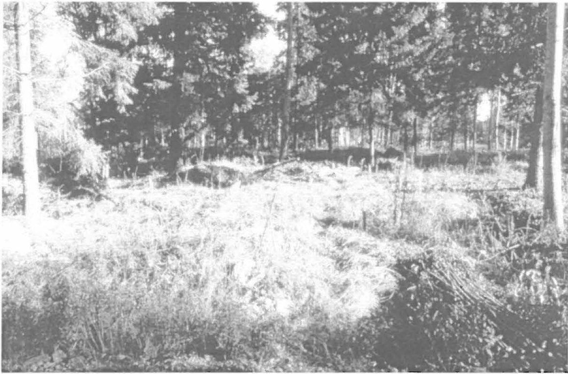
Lahden kaupunginmuseon kuva-arkisto n:o 33018. Lohentie 6 - kivikautinen asuinpaikka. Asuinpaikka-alue kuvan keskiosassa puiden varjostamalla alueella. Kuvattu etelästä. Kuva: Timo Sepänmaa.