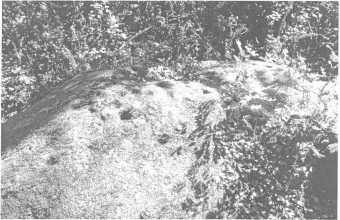
Lahden kaupunginmuseon kuva-arkisto n:o 33021. Kuppeja kiven / kallion laella. Kuvattu luoteesta. Kuva: Timo Sepänmaa.