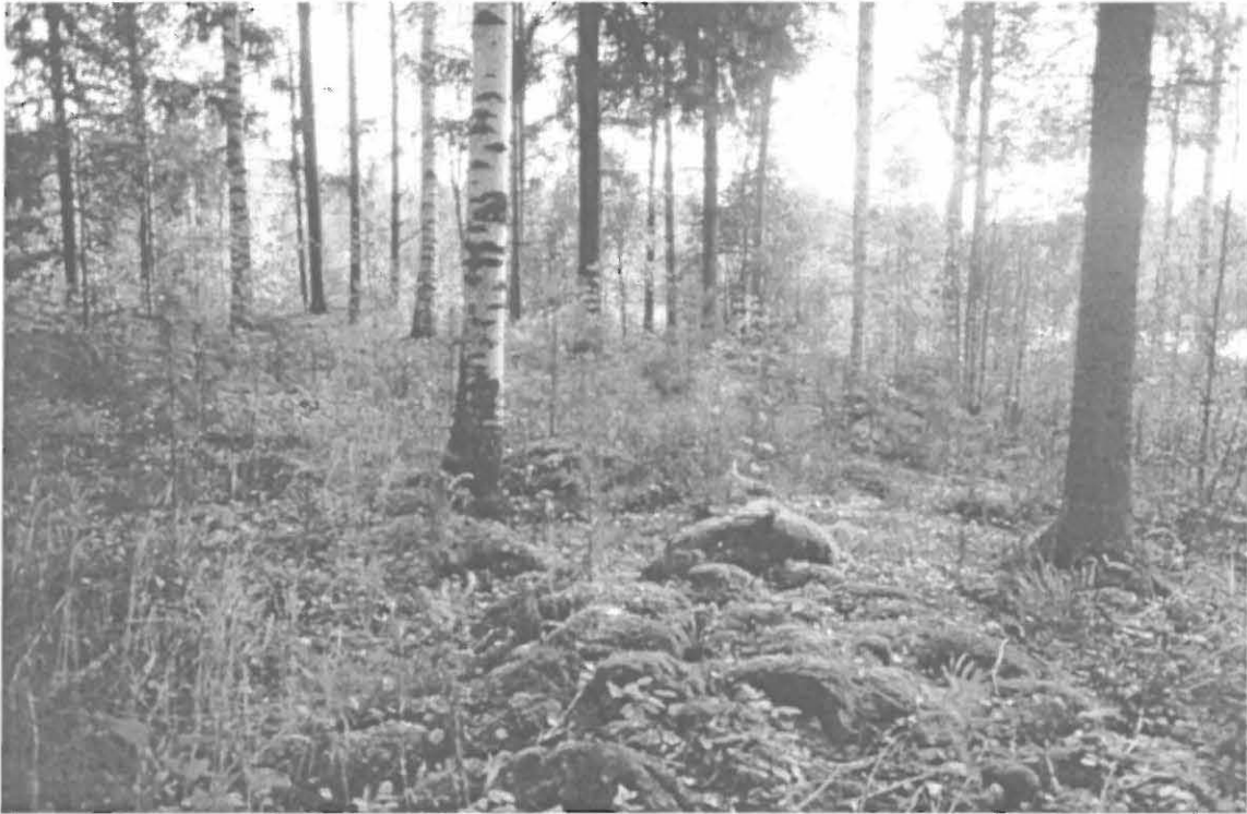
Lahden kaupunginmuseon kuva-arkisto n:o 33014. Ekonkoski A - ajoittamattoman kivivallin länsilaitaa. Kuvattu pohjoisesta. Kuva: Timo Sepänmaa.