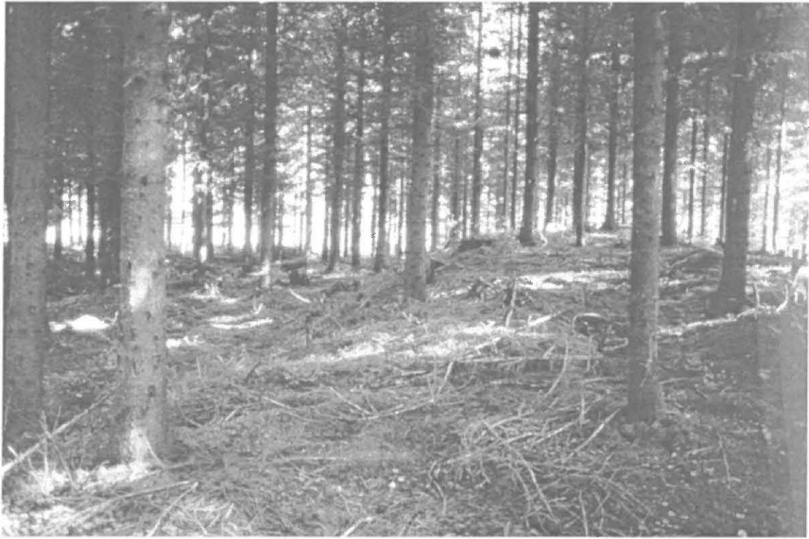
Lahden kaupunginmuseon kuva-arkisto n:o 33016. Koukunniemi B - kivistinen asuinpaikka. Asuinpaikka sijaitsee kuvassa näkyvän muinaisen rantavallin vasemmalla (länsi-) puolella olevalla pienellä tasanteella kuvan keskikohdan tienoilla. Vallin päällä on soikea painanne, joka saattaa olla asuinpaikkaan liittyviä rakenteita (esim. asumuspainanne). Kuvattu etelästä. Kuva: Timo Sepänmaa.