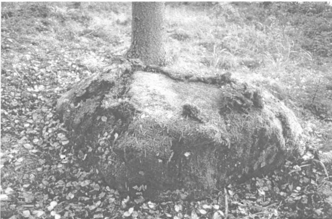
Kuppikivi. Yksi kuppi kiven korkeimmalla kohdalla. Kuvattu pohjoisesta.