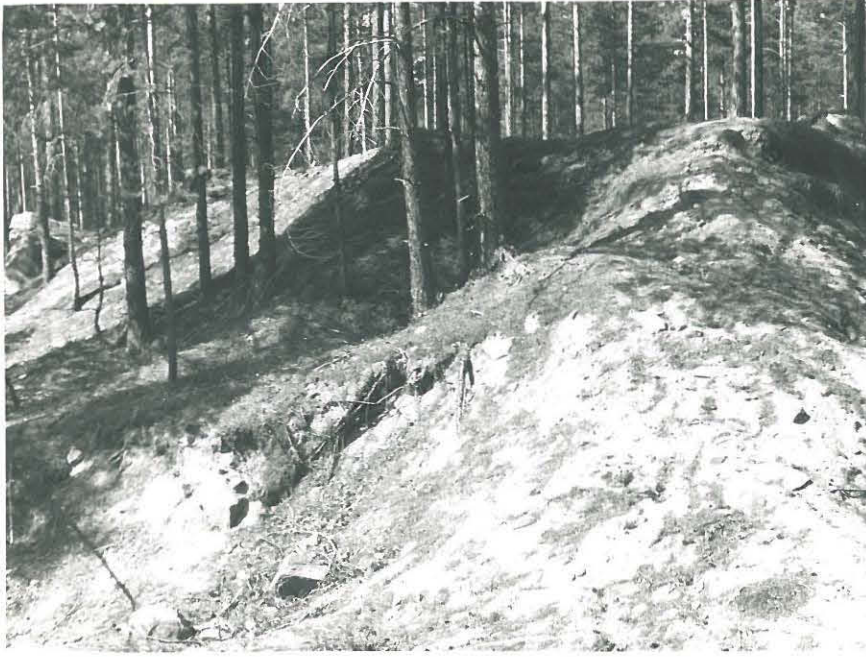
Hiekkakuopan tutkimaton neuna