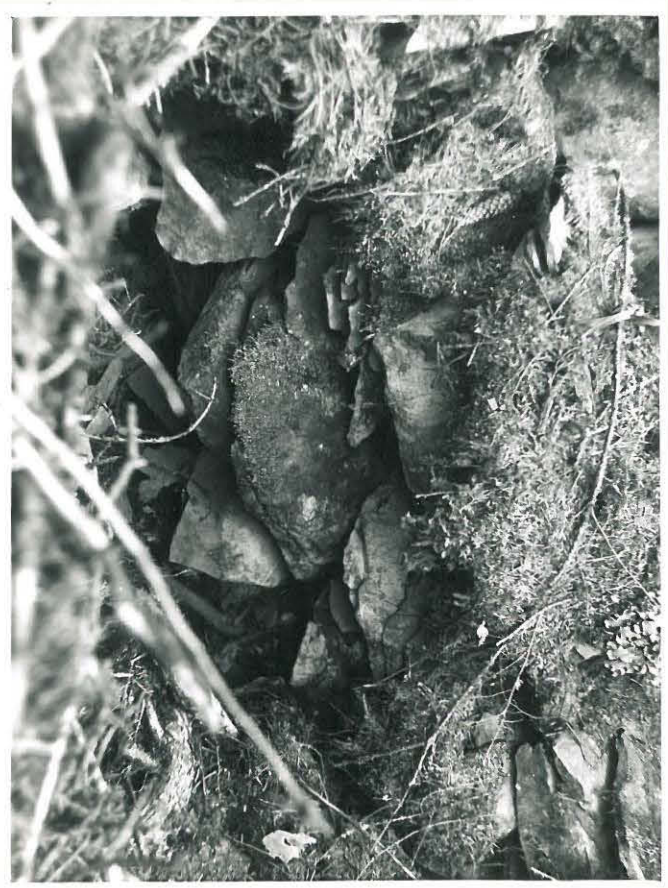
Röykkiö 18. Seppo Heuvinen