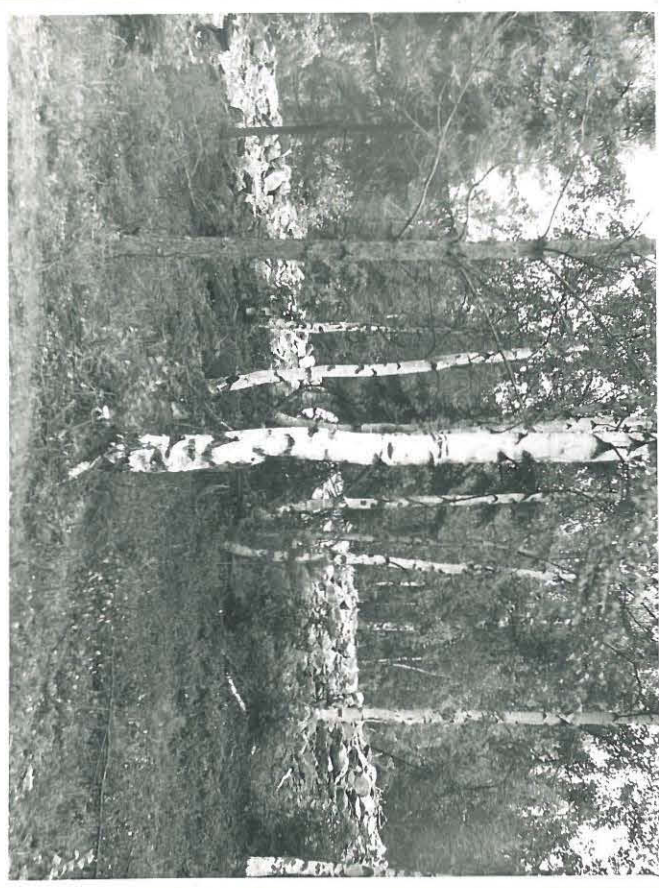
Harpavallan inv. kertomus 1960 Räyhkäs 3.