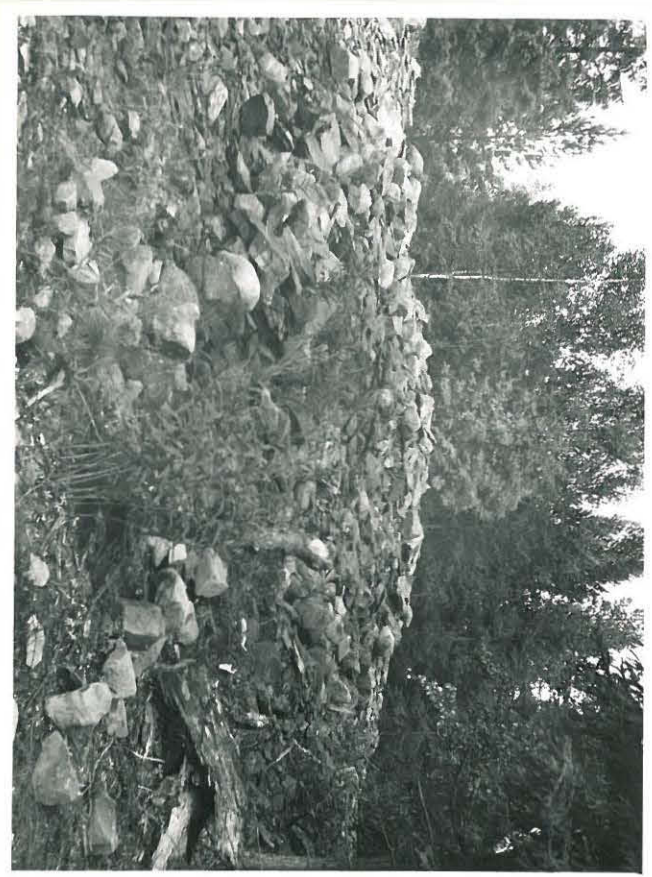
Saapo Huovinen Mäe