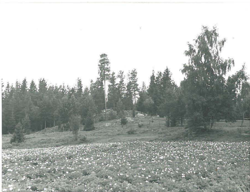
Röykkiö 32 b.