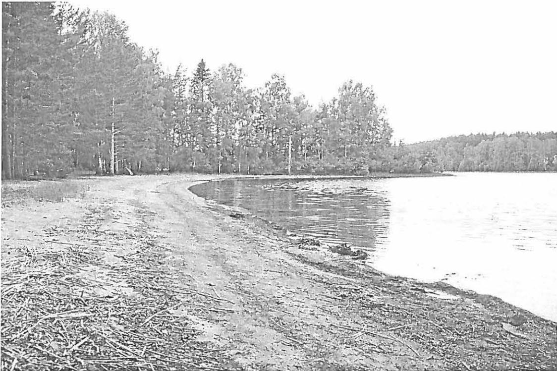
Kaava-alueeseen kuuluvaa rantaa.