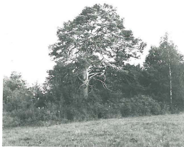
Uhrinpuuroa pidetty Karhumänty (rauhoitettu) poljoista nähtynä.