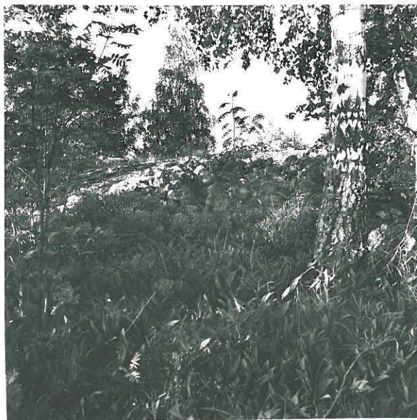
Valkoisten pesäke vuolta 1918 Kobbokallionla, kuvattu lännestä, näytteen siirränniöltä.