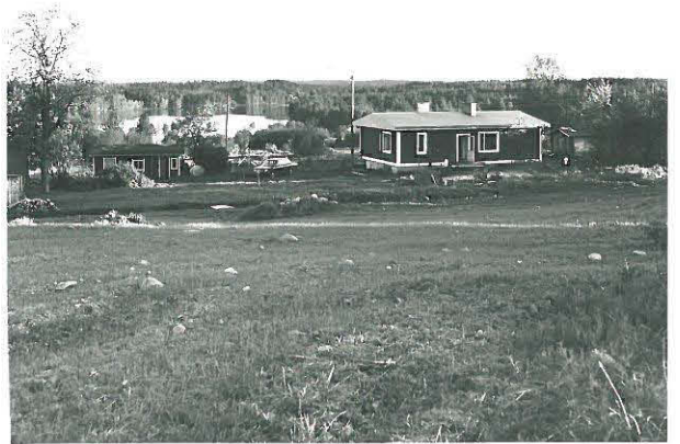
Kukkaromäen talo, kuvattu pohjoisesta. Urtikki 5 m vasemman puolella talon.