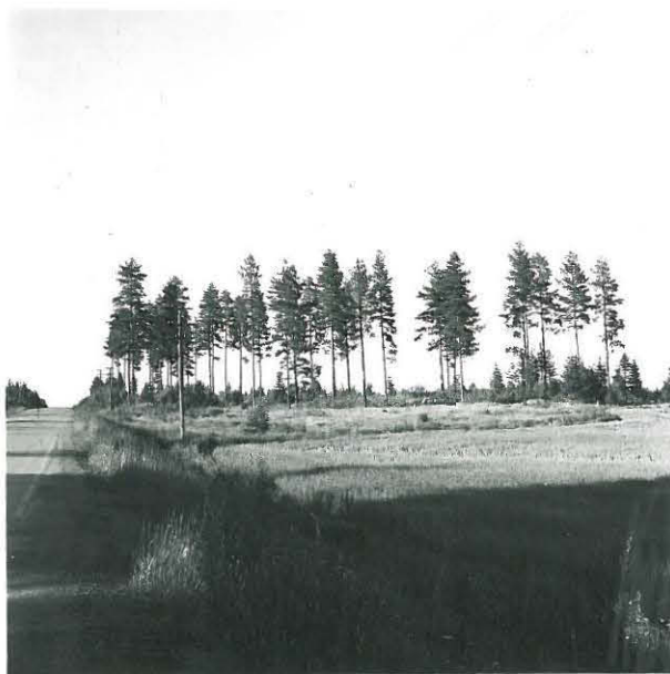
Heinon mäkin jäännökset maantien (vanhan) oikealla puolella, pihnuolenkärjen KM 10638 l.p. v. 30 m etään, kuvattu lounaasta.