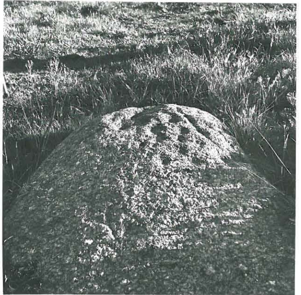
Sama ukritiir, kuvattu pohjoiskoillisesta!