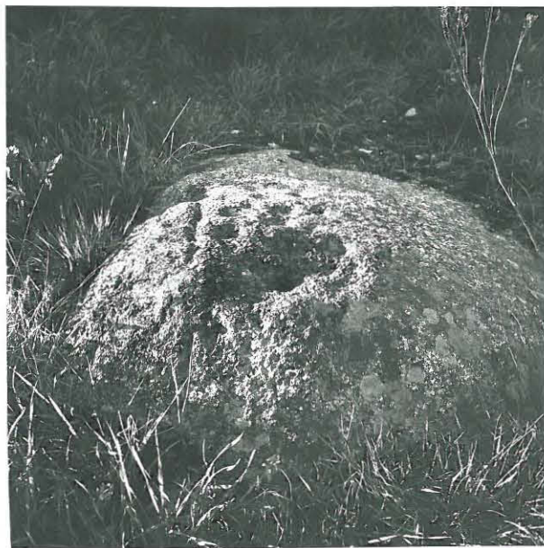
Kukkaromäen ukritiir, kuvattu etelästä. Etualalla poronreikä.