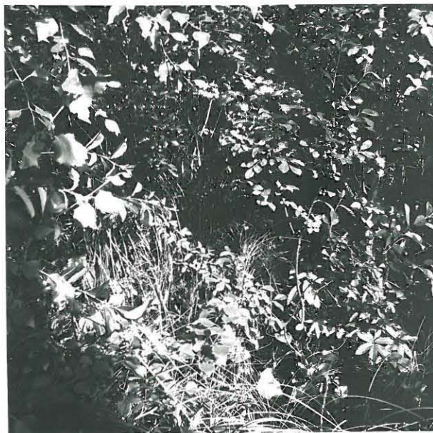
Lähiessä Roenjalaksen löytöpaikasta pensaikon sisällä, otettu lounaasta.