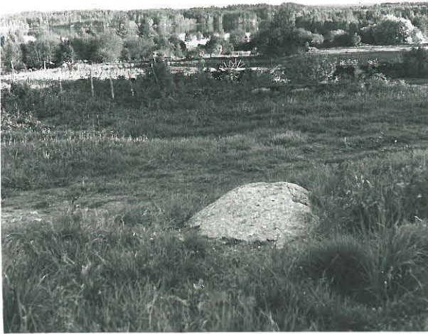
Kukkaromäen urtikki, kuvattu pohjoisesta.