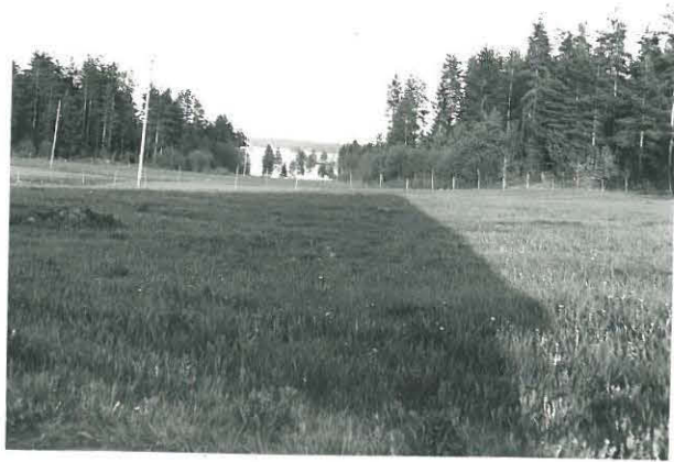
Kivisaivaitaan KM 3199:1-3 Toivonvä- hönnon työtoppihous pellossa, kuvattu lännestä. Takana Onalin lahti.