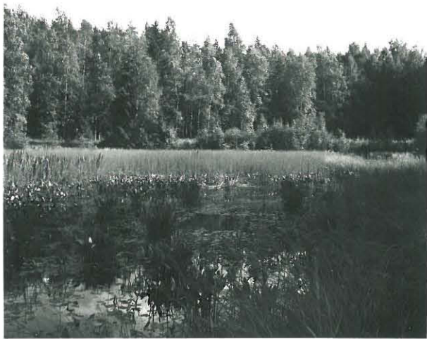
Roenjalaksen KM 12146 ja 12923:1-2 löytö- paikka matkauran tekemisen pausipaikalla, kuvattu pohjoisluoteesta Koukkijoen suusta