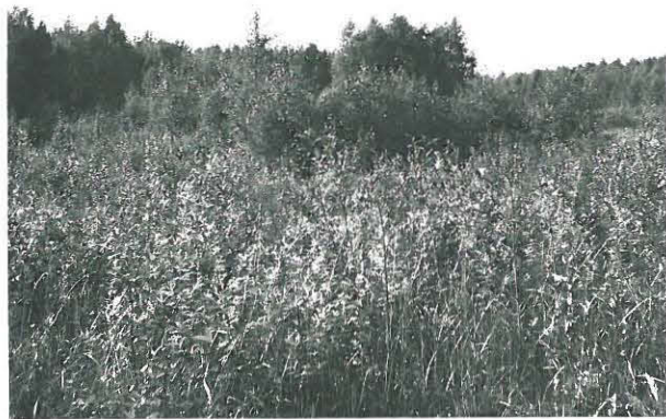
Roenjalaksen löytöpaikka kuvan kes- kellä tiheimmän pensaikon sisällä, kuvattu kaakosta. Oikealla Koukkijoki.