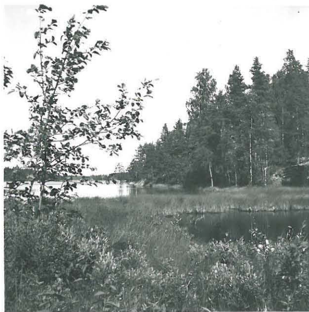
Rönjalahsen KM 9882 löytöniikka Alä-Rievon Harakkelahden, oikealla oleva mutahauta, kuvattu lännettä.