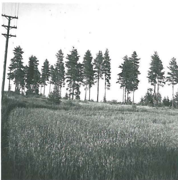
Heinon mäkin jäännökset vasemman puolella raivauksen, pihnuolenkärjen löytöpaikalla kuvattu lounaasta, kuvattu lounaasta.