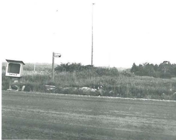
Väittä Karhumäntylle Taipaleen tien välissä.