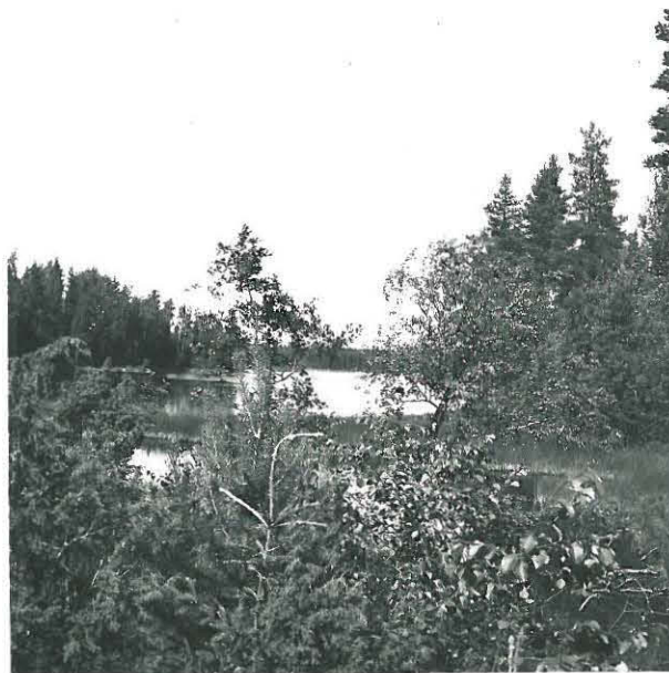
Rönjalahsen löytöniikka on itäisellä alalla mutahaudassa, kuvattu kuchosta.