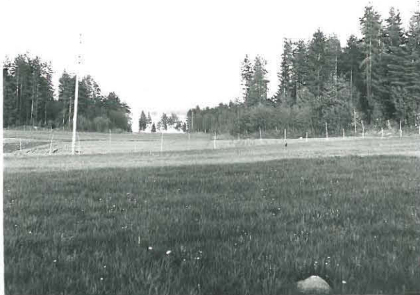
Samaa pelto, kuvattu myös lännestä.