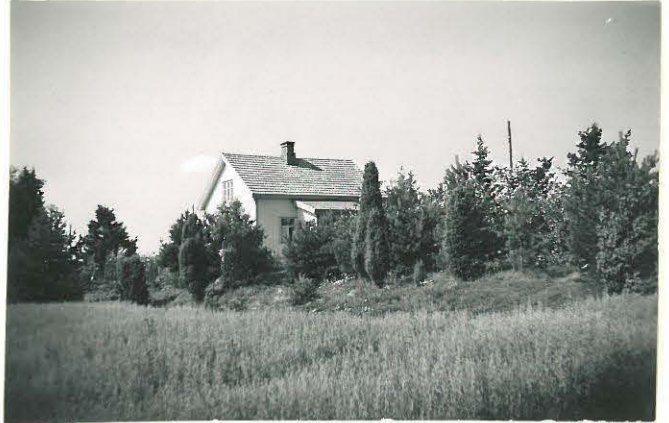
2. Kaharila, Vanhakoski Mj. 2