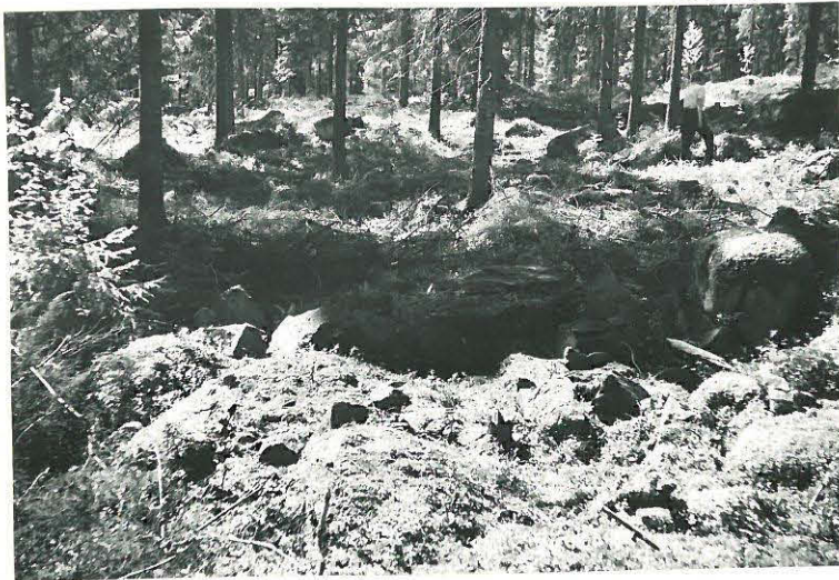
22. Nanhia, Vittassaari Mj. 15