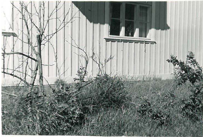
21. Nanhia, Ytti Mj. 14