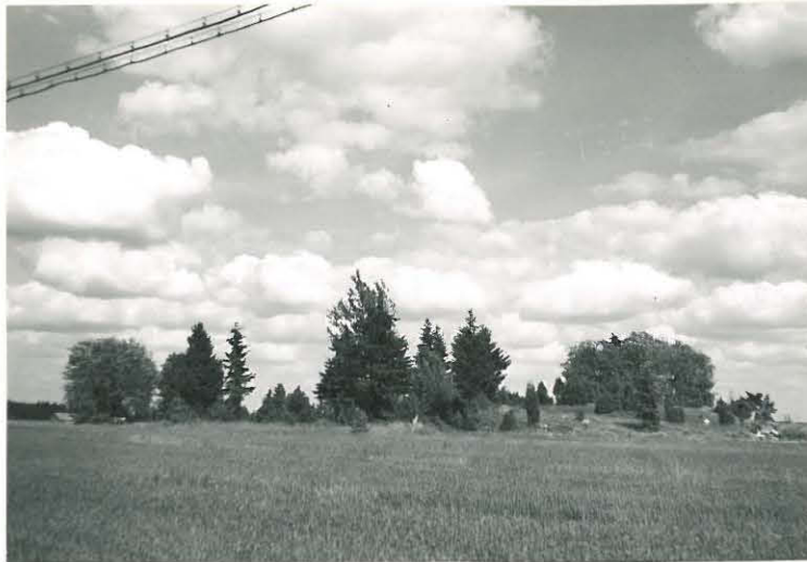
16. Sampu, Käräjämäki Mj. 11