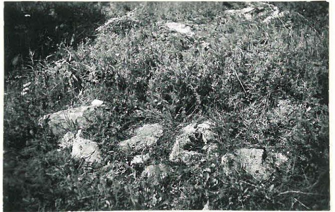
3. Kaharila, Vanhakoski Mj. 2