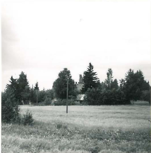
19. Sampu, Hiukkavainio Mj. 12