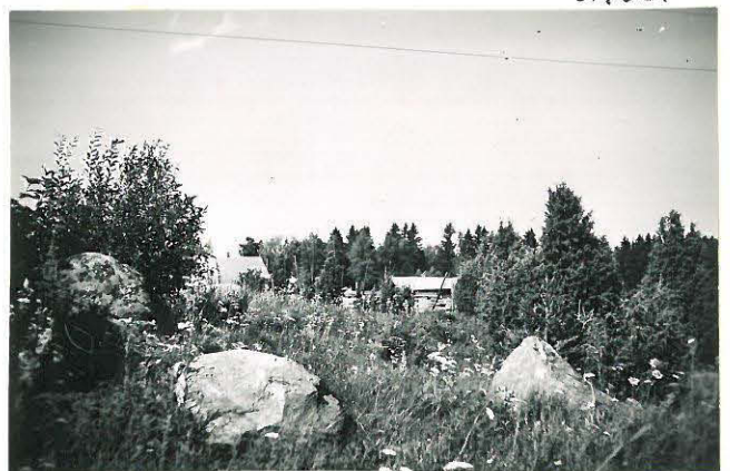
25. Loima, Hidentöykä Mj. 16