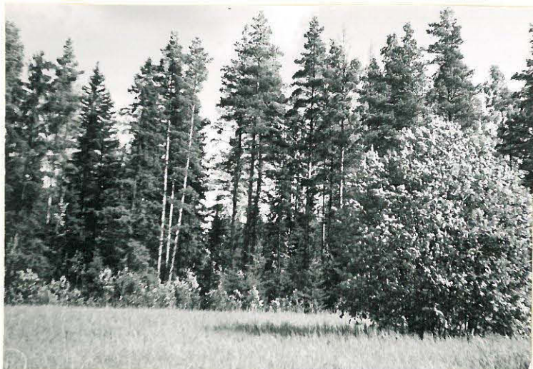
4. Huittistenkylä, Palojoki Mj. 3