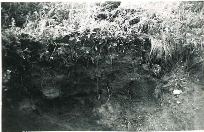
18. Sampu, Käräjämäki Mj. 11