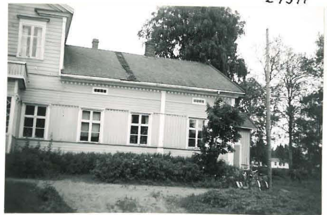
15. Sampu, Takkula Mj. 10