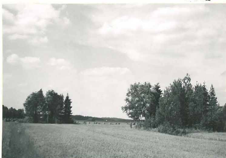
6. Sampu, Riposu Mj. 5