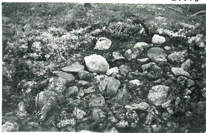
10. Huittistenkylä, Rantala Mj. 7