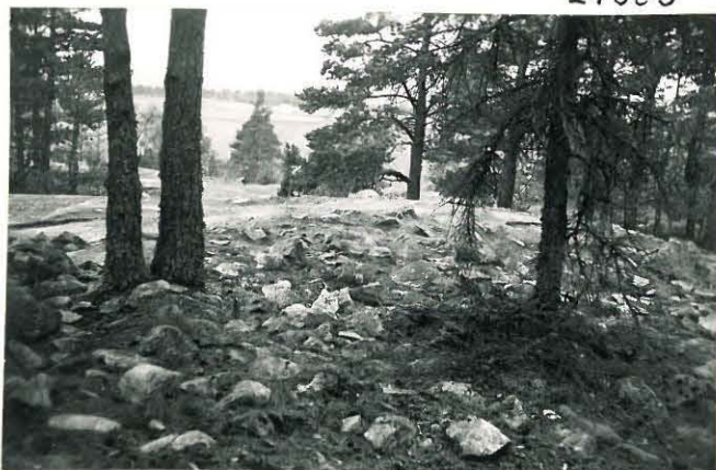
7. Sampu, Ripovuori Mj. 6