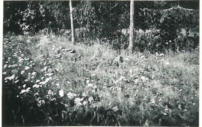
27. Loima, Huittisten kansanopisto Mj. 18