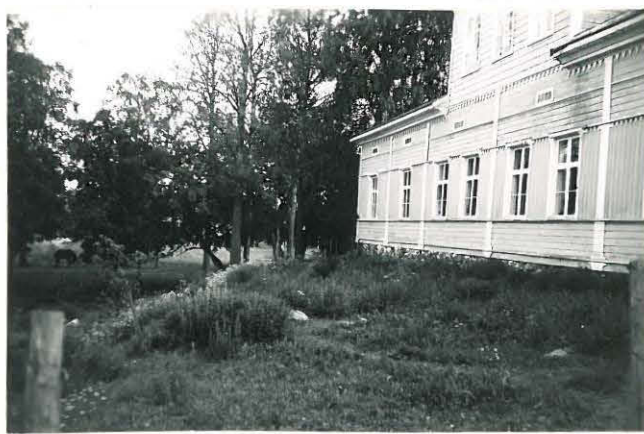
14. Sampu, Takkula Mj. 10