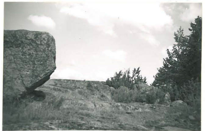
29. Karhiniemi, Kastari