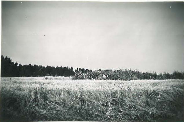
26. Loima, Pietilä Mj. 17