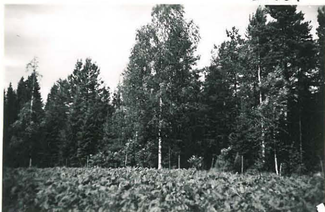
5. Kirkonkylä, Rantala Mj. 4