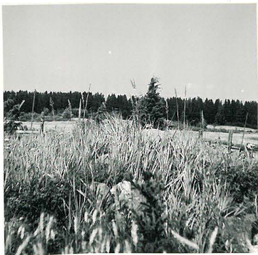
24. Loima, Hidentöykä Mj. 16