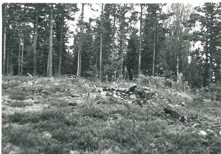
9. Huittistenkylä, Rantala Mj. 7