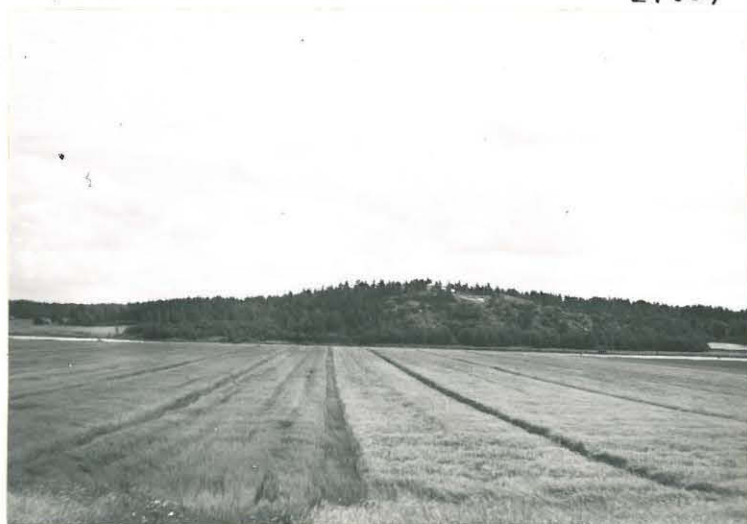
8. Sampu, Ripovuori Mj. 6