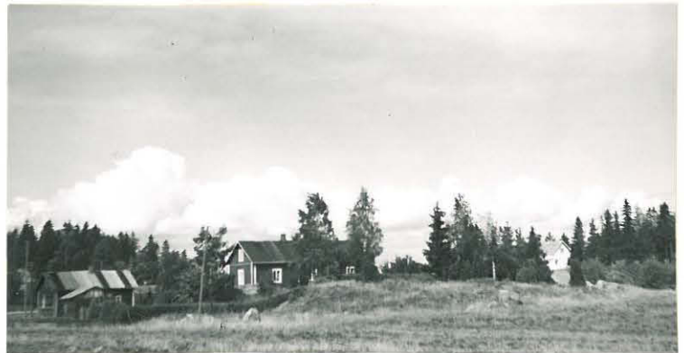
20. Sampu, Salminen Mj. 13