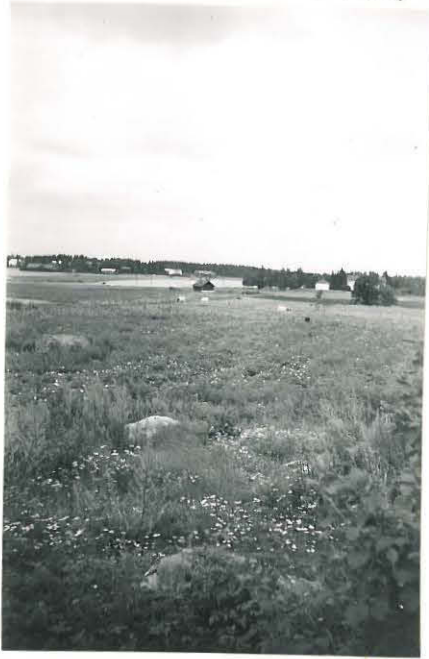
11. Sampu, Hiukkavainio Mj. 8