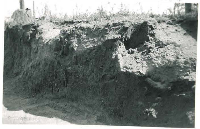
13. Karhiniemi, Tirri Mj. 9