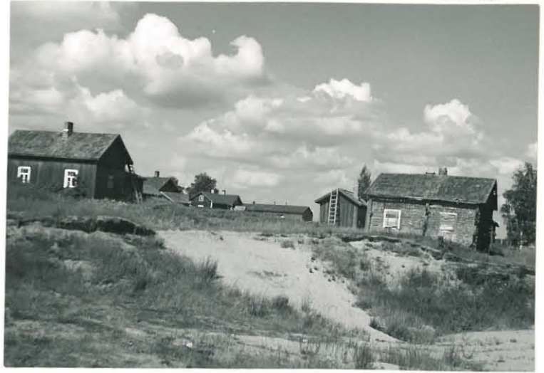
12. Karhiniemi, Tirri Mj. 9