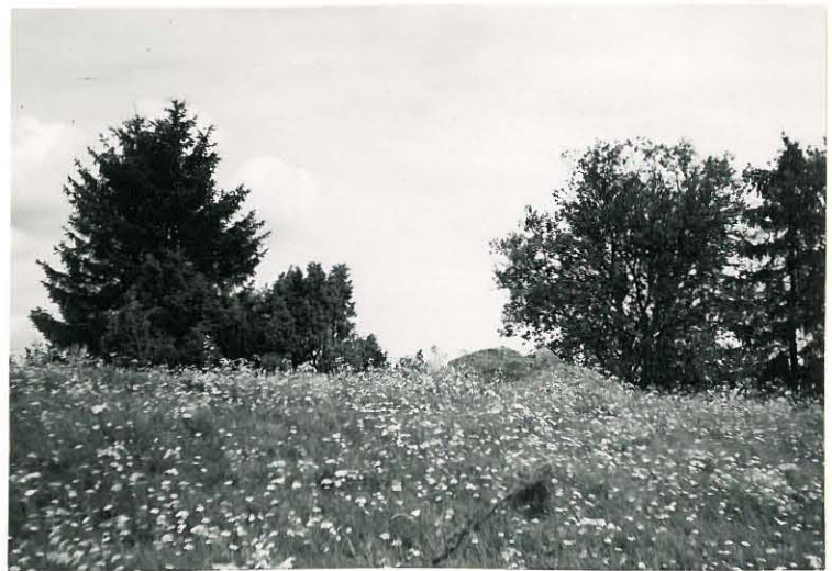
17. Sampu, Käräjämäki Mj. 11