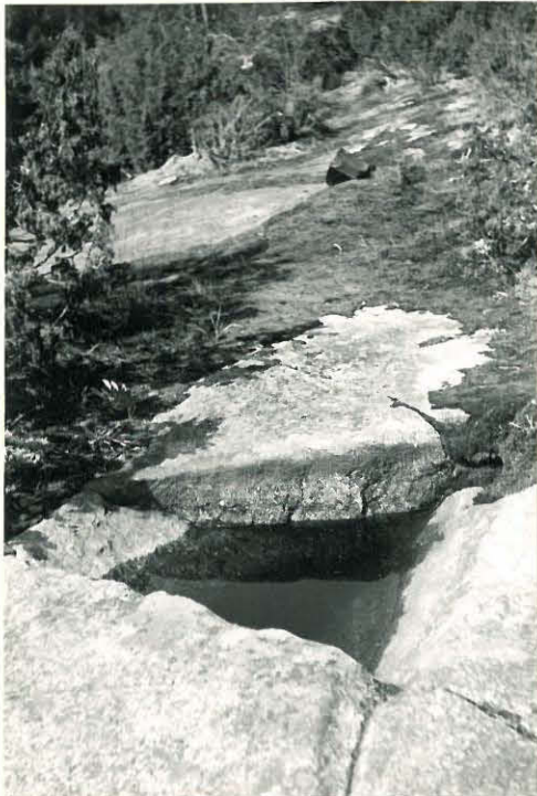
28. Karhiniemi, Hii denka llio Mj. 19