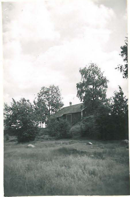
1. Raijala, Kankareenmäki Mj. 1