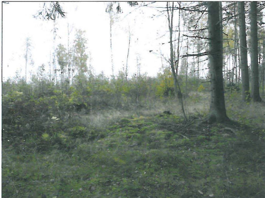
Kyröskoskenharjun alarinteiden kuusikko ja pusikoitunutta hakkuualuetta kaava-alueen keskivaiheilla.