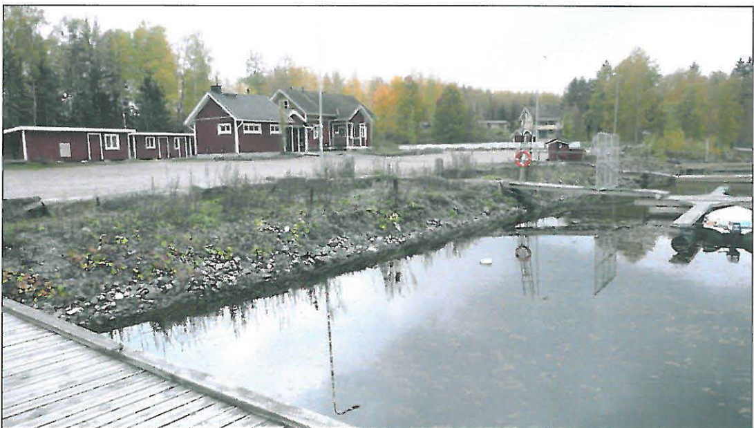
Venesatama kaava-alueen pohjoisosassa Kyrösjärven rannalla