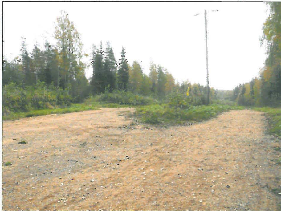
Kaava-alueen vielä rakentamattomilla alueilla risteilee ulkoilureitti