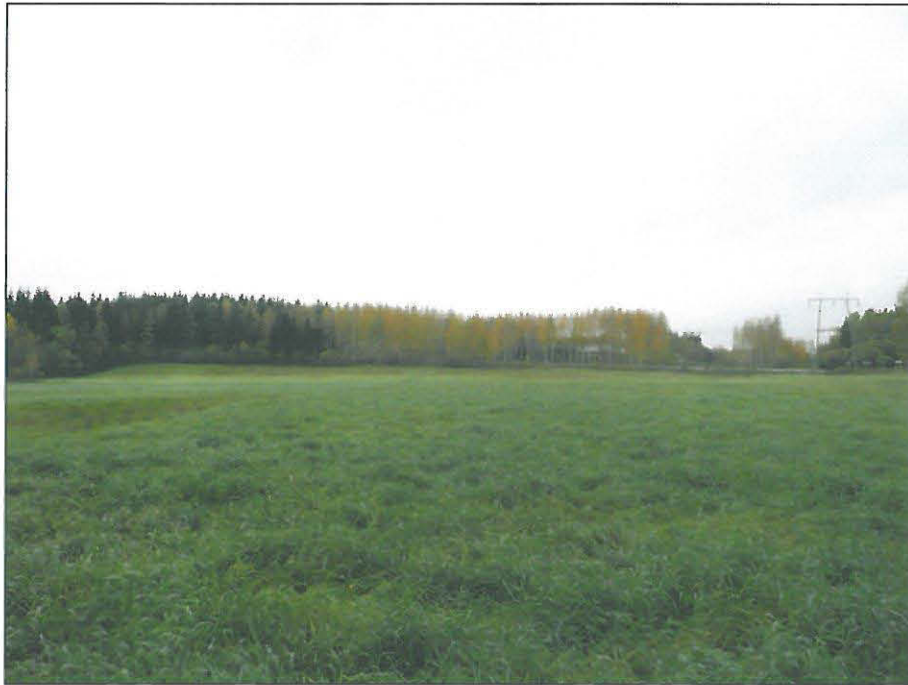
Kaava-alueen luoteisosassa oleva pelto on nurmella