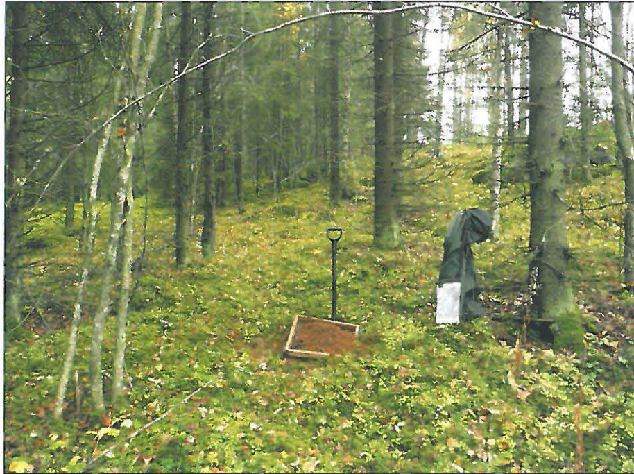
Kyröskosken harjun lakialue ja ylärinne on lajittunutta hiekkaa 3-tien vieressä kaava-alueen länsiosassa. Kuvassa koekuoppa josta otettu maa seulottiin.