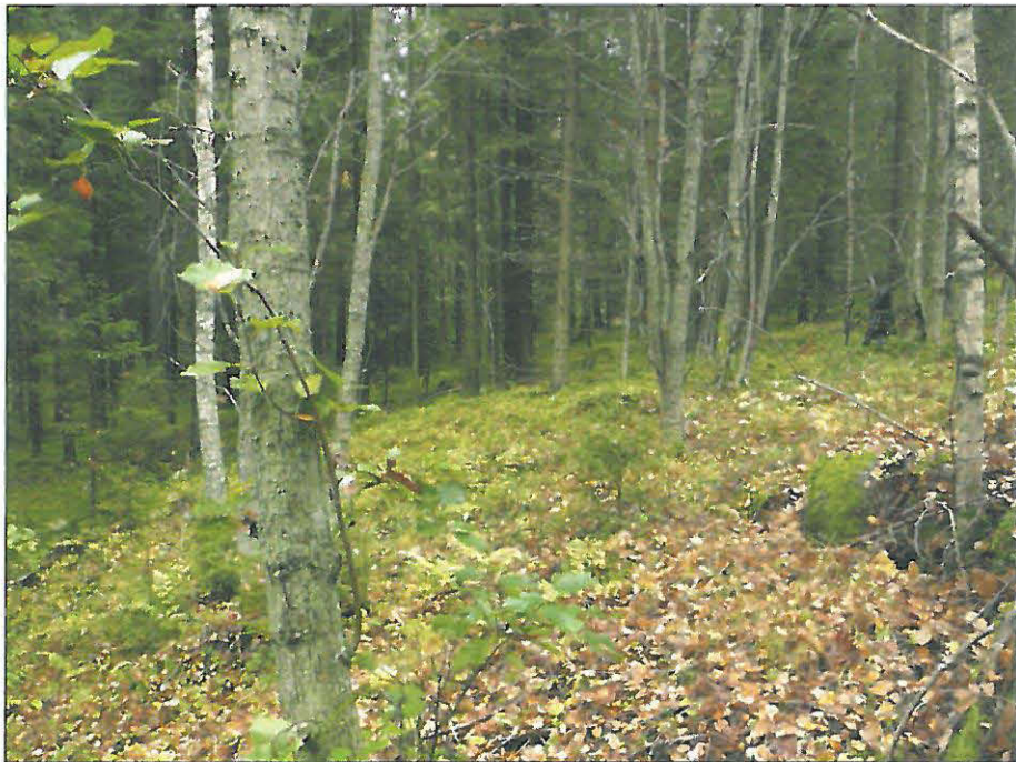
Kyröskoskenharjun muinainen Ancyclusjärven rantaterassi.