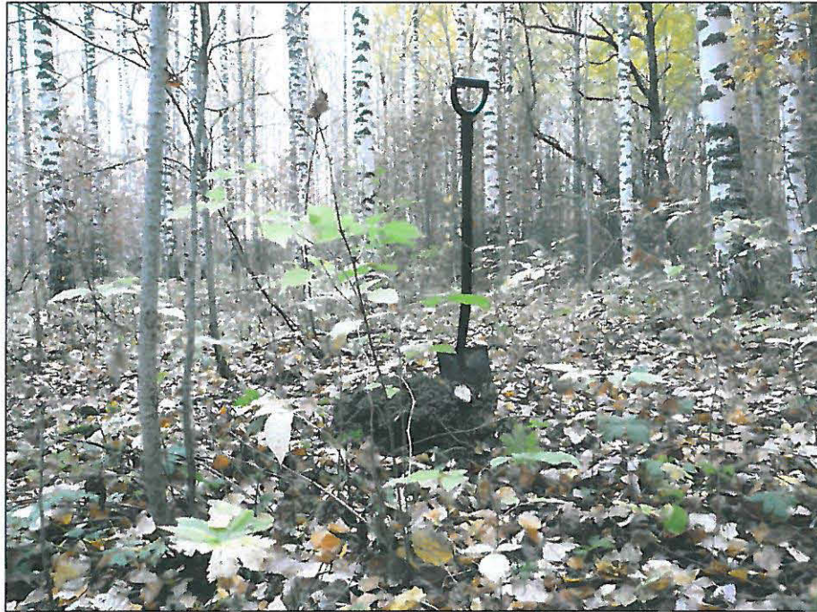
Metsittynyttä peltoa venesataman ja sahan välisellä alueella. Ennen Kyrösjärven laskua paikalla on ollut järvelle pistävä niemi. Maalaji alueella savimultaa.