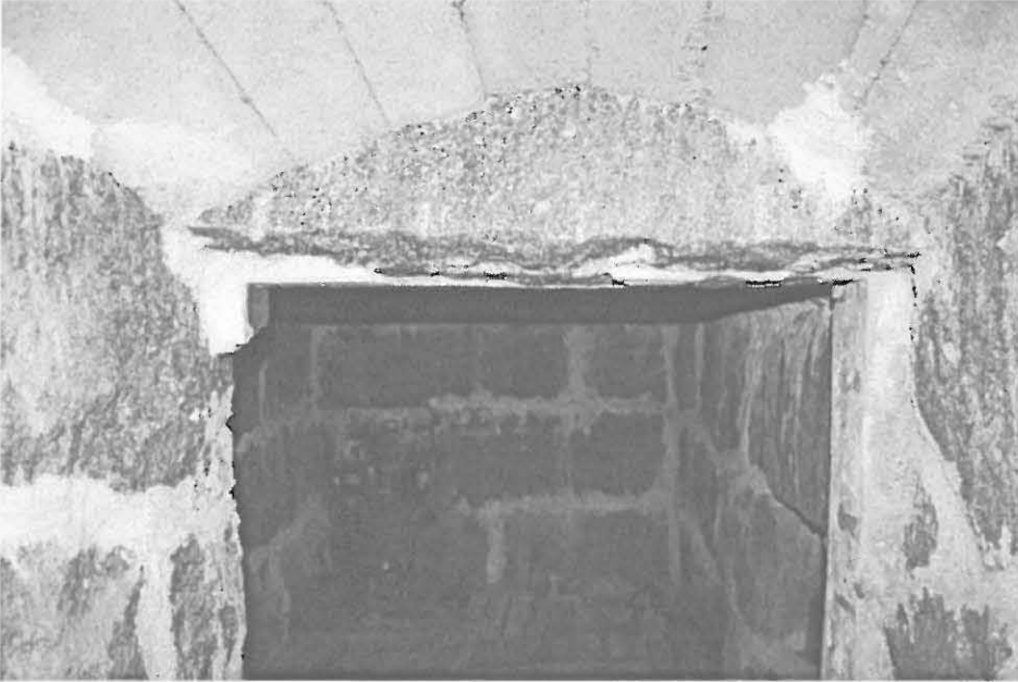
Kellarin sisäpuoli. Idästä.