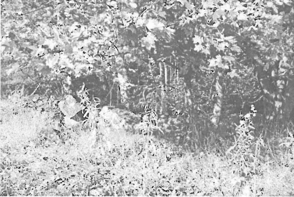
Talon rakenteita. Kaakosta.