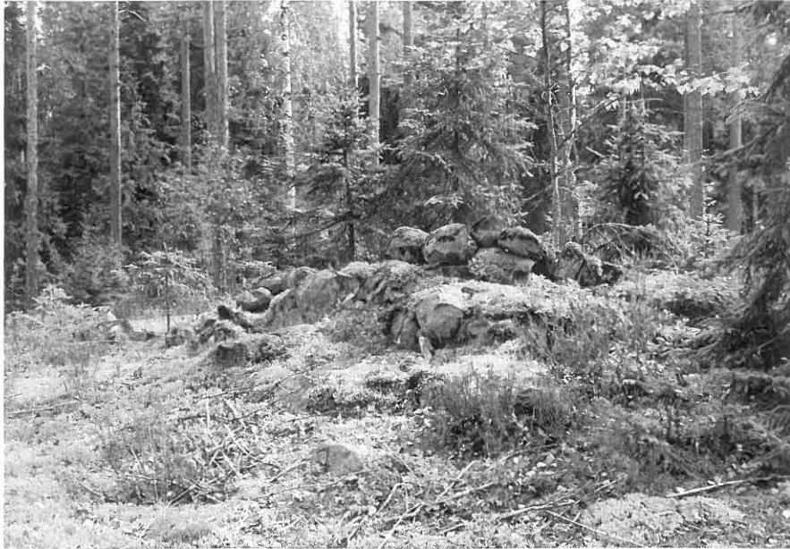
"HIIDENKIVÄS, HIISIÖINEN" (M. HUURRE: RAUNIO a) TAAVI TIKAMO 1973 (KIRJE 7.2.1974 n:o 20)