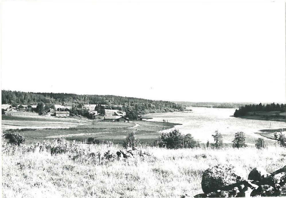
Kalliomaäeltä SE- Suuntaan, varkumella Isoröyhtiön kylän, etu- alalla mäen epämäärä- isen kivi rökkiön ki.