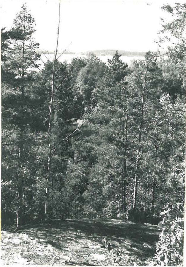
Näkymä limanvonnelta leuo- teeseen Kynöstaivelle