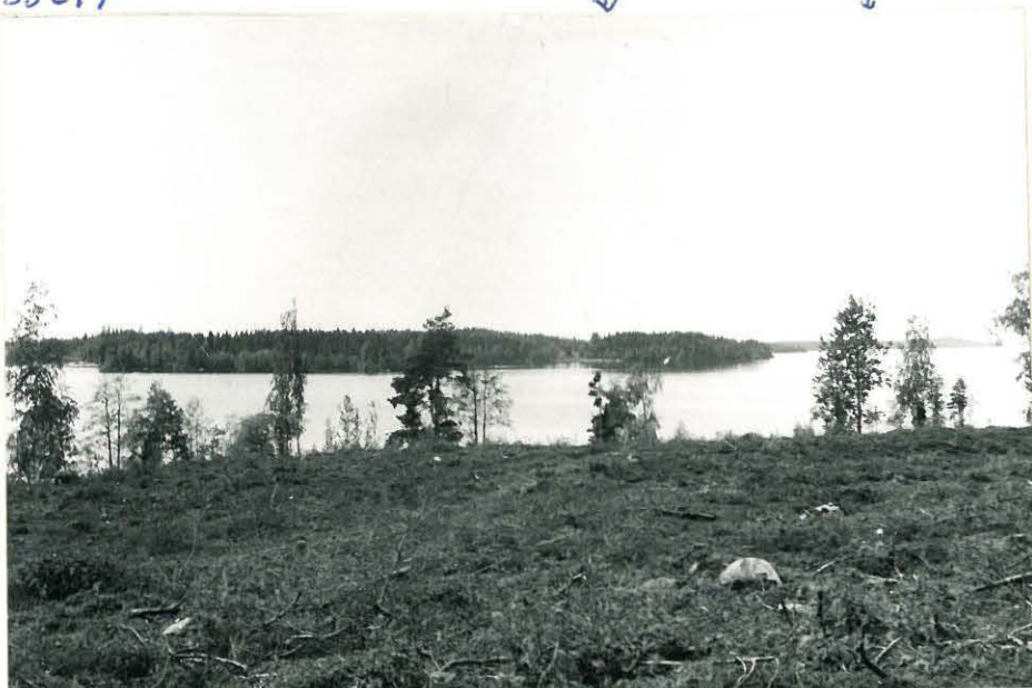
2122 12 / 4 Kalma, Markkasaari , kuva Markkasaarelta linnasta, vuoden 1. kädellä kalusaan läheltä, vuoden 2 kädellä alla kayppolan läheltä (huostalla)