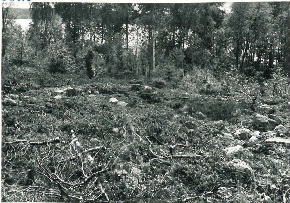
2122 12 / 4 Kalma, Markkasaari , pyörä- kivilatomus (kalea) saaren eteli- mäni, kuvattua pyöräkil- oesta.