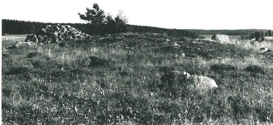
Muicissti peltolintok- knttu rökkiö Yliöjan kalliomaäellä, tans- talla Salovälin lahtea