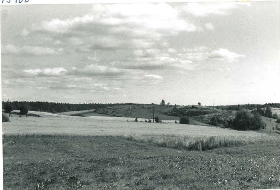
Isoröyhtiö, kalliomaä- ki Yliöjan SW-puolella Kuvaltua NW:sti