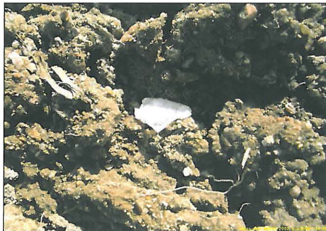
Kvartsi-iskos "in situ" Rajalan pellossa

Huomiot: Rajalan talon eteläpuoliselta peltorinteeltä löytyi harvakseltaan kvartseja. Maaperä paikalla on moreeni, ylempänä hiekkainen alempana peltorinteessä hiesuisempi. Kvartsien keskittymä vaikutti painottuvan n. 30 m pellon reunasta etelä-kaakkoon. Peltorinteen laelta löytyi vain yksi kvartsi. Löydettyjen kvartsien joukossa on yksi kvartsiesine ja yksi esineen katkelma. Talon itäpuoliselta pellolta, kymmenisen metriä pellon reunasta itään, alarinteeseen löytyi muutama kvartsi. Peltorinteen yläpuolella ja Rajalan pohjoispuolella olevalla tasaisella lakipellolla ei havaittu merkkejä esihistoriasta. On ilmeistä, että asuinpaikka ulottuu Rajalan eteläpuolelta sen itäpuoliselle peltorinteelle. Asuinpaikka on siis sijainnut muinaisessa niemekkeessä. Asuinpaikan kartalle merkitty rajausarvio sisältää suoja-alueen ja se perustuu löytöjen levintään, sekä paikan topografiaan. Havainto-olosuhteet kuivassa, avoimessa pellossa olivat tyydyttävät.