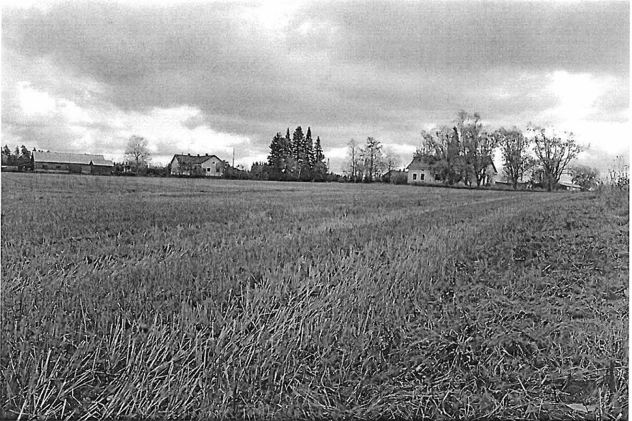
Janakkala Rastila. Keskiaikaista kylää voi olla vielä jäljellä pellolla talojen läheisyydessä ja talojen pihoiden. Luoteesta.