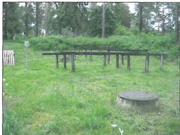
Alempi terassi jossa matonpesupaikka, oik, taustalla ylempi törmä ja sen asuinpaikka