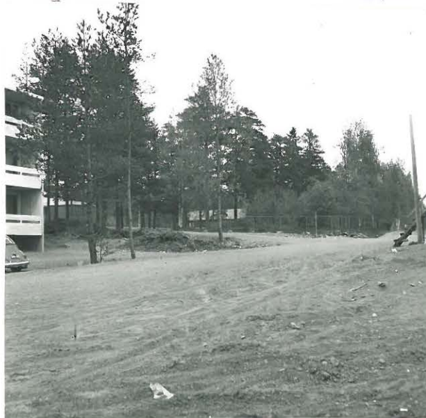
SAMA PAIKKA 1973. TEMPELIKATU KUVAN POIKKI. VASEMMALLA SCHAUMANIN KAIVAUK- SEN 1970 JÄLKEEN RAKENNETTU TALO.