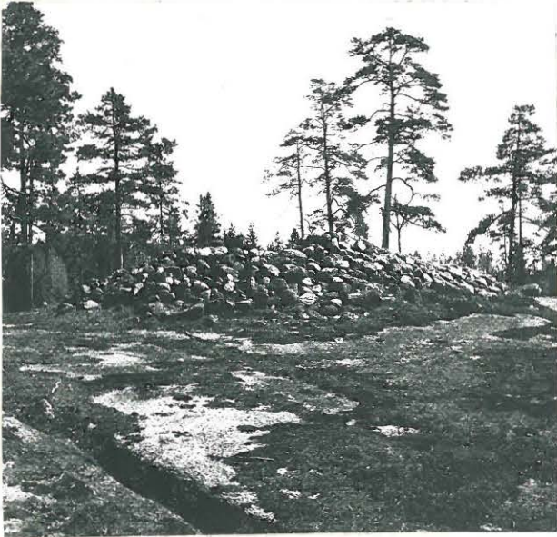
1. KIVAS C LUGTEESTA