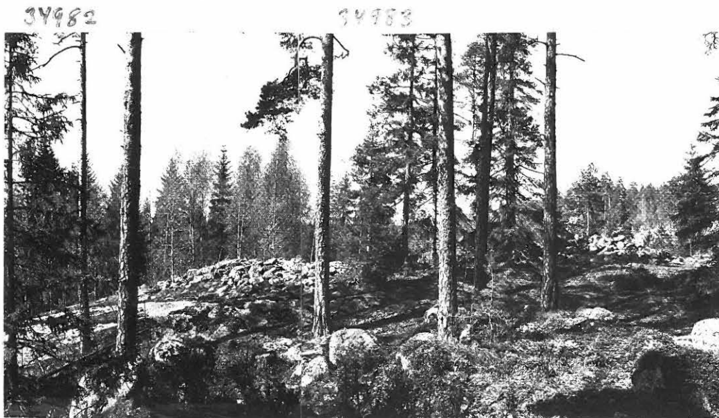
PANORAAMA HIIDENKINKAISTA, KUVATTU ISON KIVEN PÄÄLTÄ KIUKAAN 6 KAAKKOISPUOLELTA. VAS. KIVAS 6, OIK. KIVAS 6)