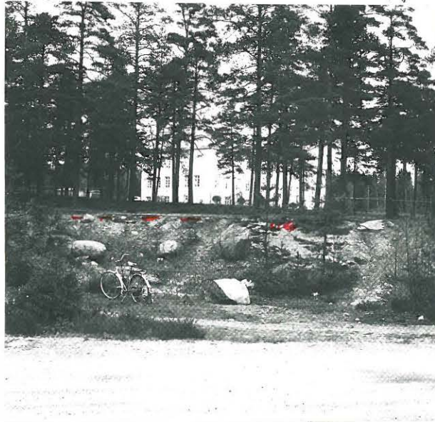
ETUALALLA TEMPELIKATU. LÖYTÖJÄ KUOPAN REUNOILTA. TAUSTALLA KOULU. KUVA KOILLISEEN.