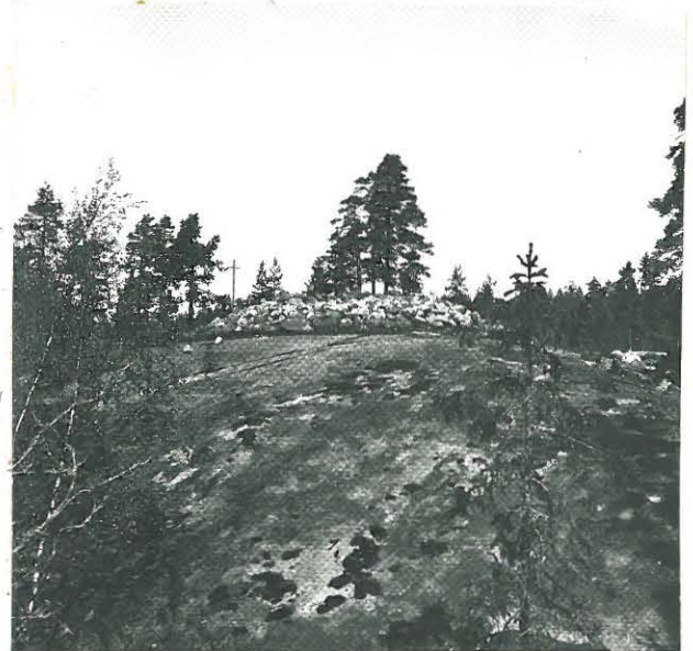
3. KUTEN ED.