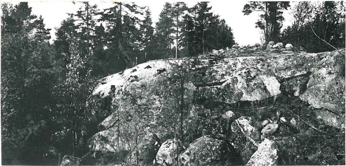
PANDRAAMA ,KUVATTU ETELÄKAAKOSTA .