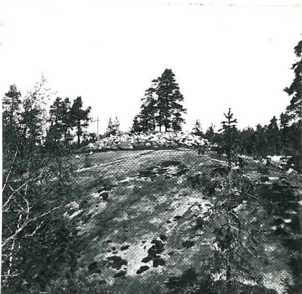
2. KIVAS C ETELÄSTÄ ISONKIVEN PÄÄLTÄ