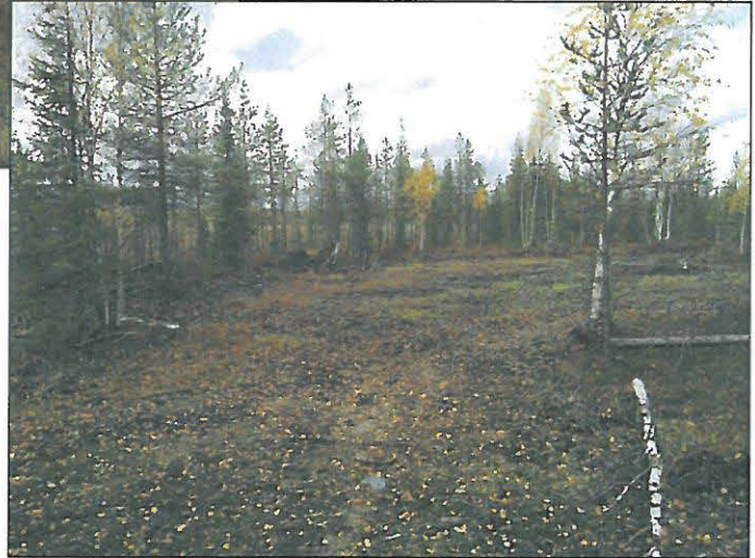
Oik: Kielimaa, linja kulkee kuvan kohdalla mäen reunaa suon rajalla.