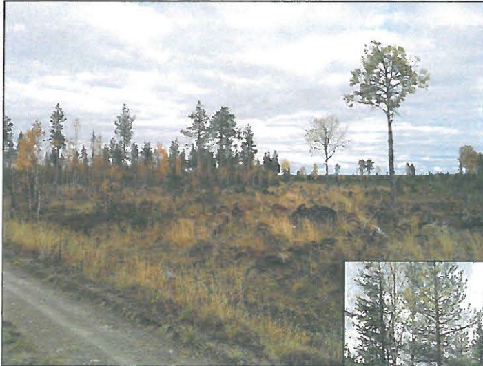
Yllä: linjan kaakkoispään maastoa