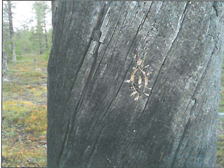
Pilkkapuu linjan luoteisosassa Kortteselän koillisreunalla.