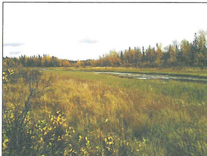
Vuostimonjoki kohdalla mistä linja sen ylittää.