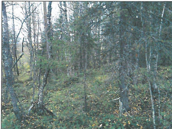
Vuostinmonjoen pohjoisranta linjan tuntumassa.