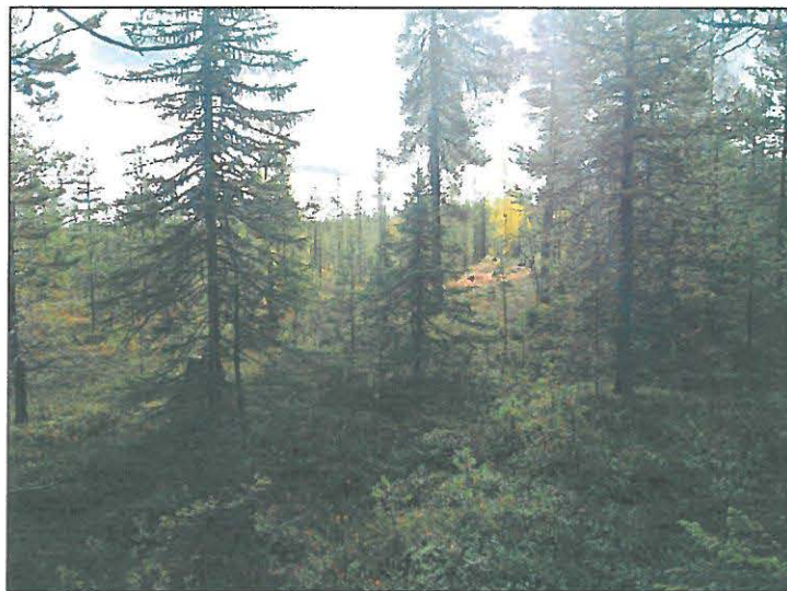
Linjan luoteispään maastoa Korteselän koillispuolella.