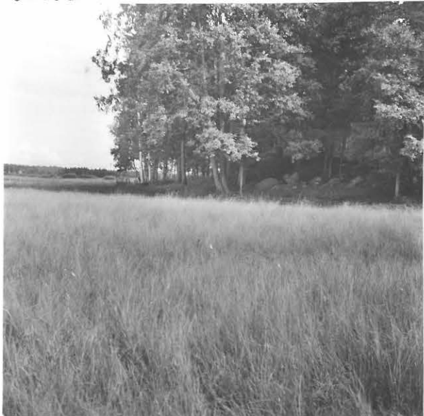
LEHTINIEMEN POHJOISRANTAA KUVATTUNA LÄNNESTÄ, KURAJÄRVEN VESUÄTÖLTÄ