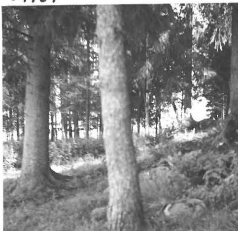
KURAJÄRVEN VANHAA RANTATÖRMÄÄ, KIRVEEN JÄÄNNÖS KM 16795:1 OIKEALTA SAUNAN PÄÄDYN LUOTA.