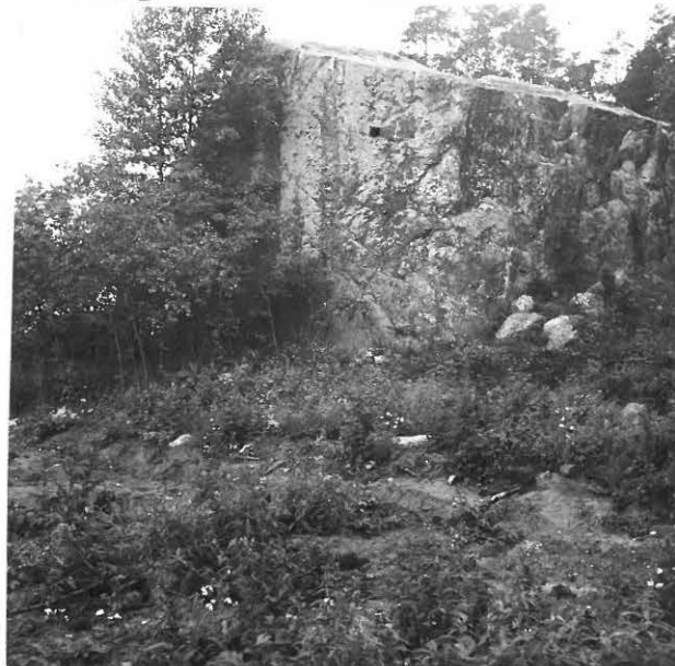
HERMOLANVAHAN ETELÄPUOLTA. OJAN PENKASTA LÖYDÖT KM 16751