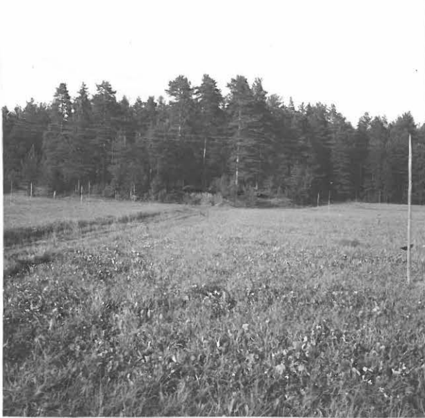
HIEKKAKUOPPA METSIKÖSSÄ ETELÄSTÄ PÄIN.