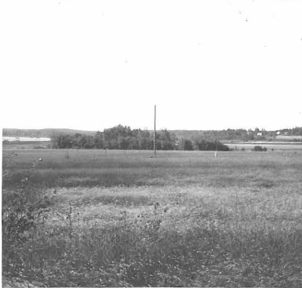
KUVATTU IDÄSTÄ. HIEKKAKUOPPA METSIKKÖNMEMESSÄ. OMENAJÄRVI VASEMMALLA