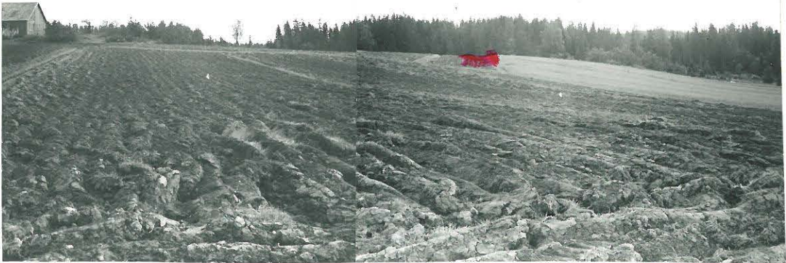
KUVA LOUNAASTA. KVARTSIA PUNATULTA PAIKALTA.