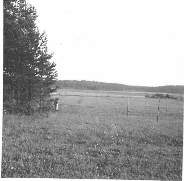
MAISEMA OMENAJÄRVELLE. HIEKKAKUOPPA METSIKÖSSÄ VASEMMALLA