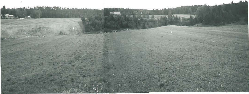
KUVA OTETTU HITOLANJOEN LOUNAISPUOLELTA. LUOMAN TALO VASEMMALLA, PELTO MISTÄ LÖYDÖT OVAT, ON KESKELLÄ NÄKYVÄSTÄ LAADOSTA OIKEALLE. KIRVES KM 17013 ILMEISESTI ETUALALLA OLEVASTA PELLOSTA. (KESÄLÄ 3)