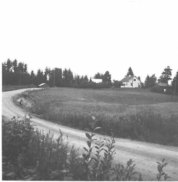
SALMENRANTA ETELÄLÖUNASTA KVARTSIT MAANTIEEN VARESTA