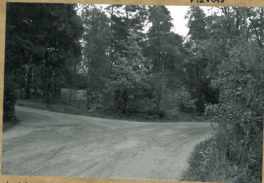
Lekitoalo löysi: pulton jälkiä Ljungeheden läheltä, SW-NE