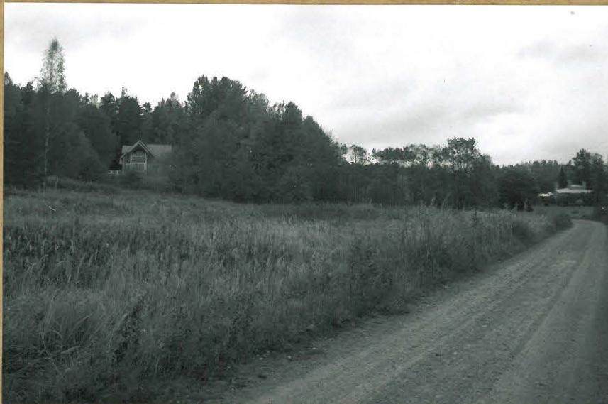
Kourutalon mahdollinen löytöpaikka. kohdalle on rakennettu talo. S-2