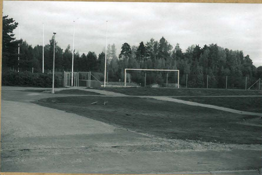
Yleiskuva Pappilan asuinpaikan itäosasta. Lehtosalon itäisimmät löydöt hiekkakuopan reunalta. SSW-006