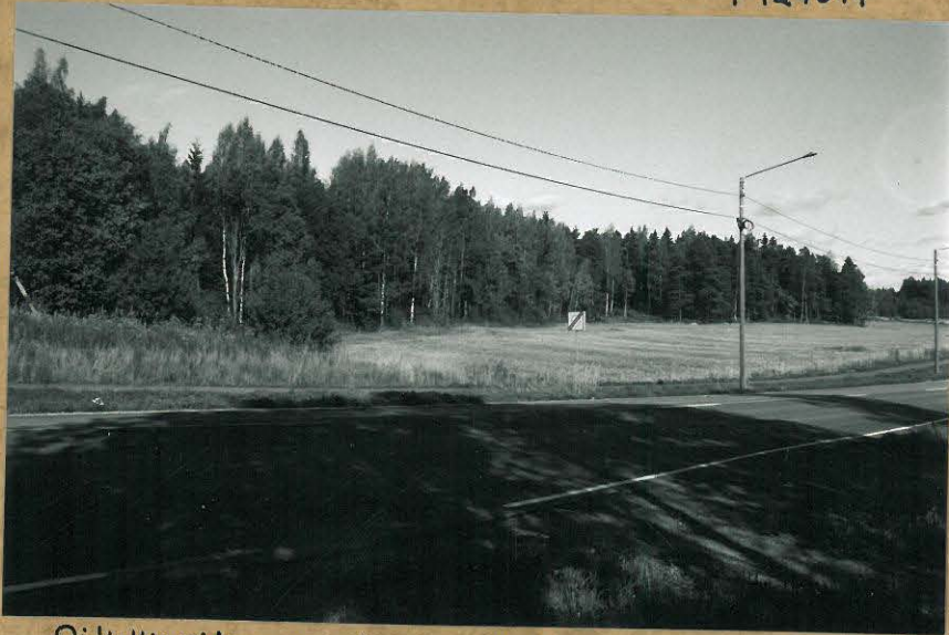
Oikokirveiden mahdollinen löytöpaikka pellolla metsän läheltä. SW-NE