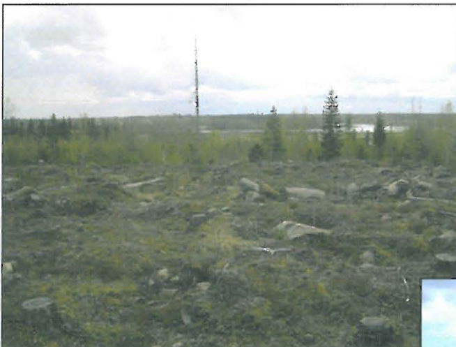
Näkymä Rantakylän itäpuoliselta mäeltä Kiuruveden kirkon suuntaan.

Rantakylän itäpuoleista peltoa valtatie pohjoispuolella.