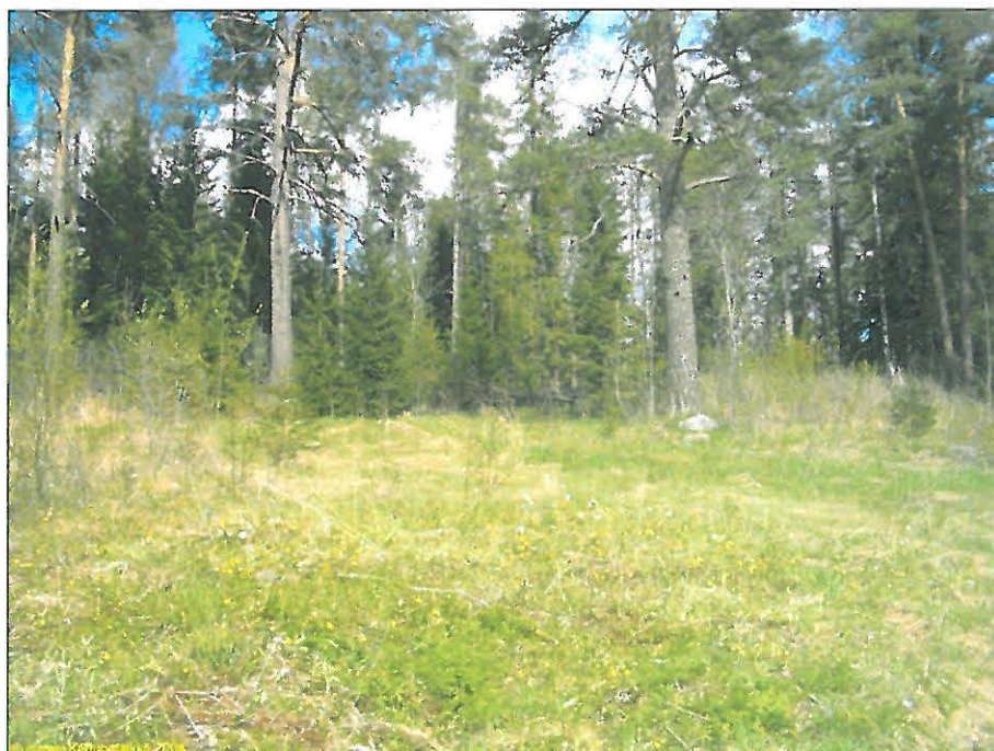
Asuinpaikka ruohorinteen yläosassa ja sen takana metsässä. Talon perustukset oikealla ison männyn oik. puolella