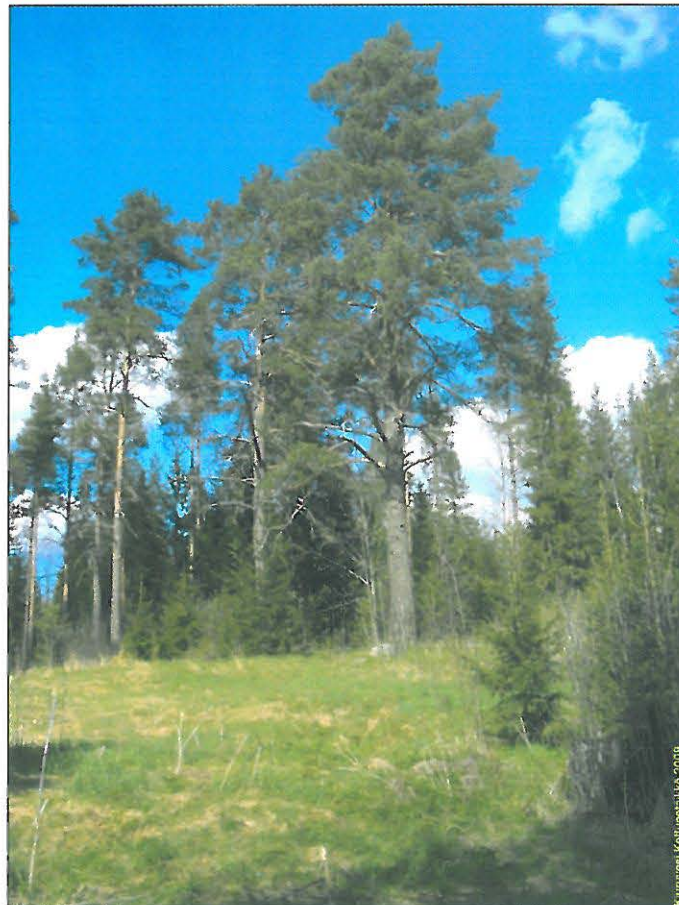
Kiuruvesi Kallupetäinko 2008