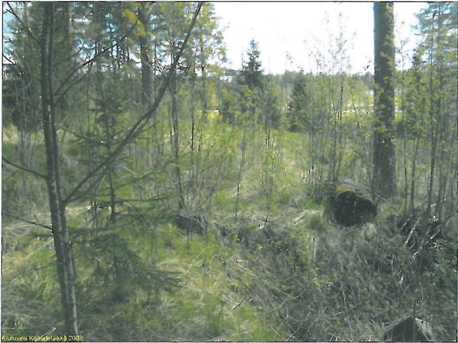
Kiuruvesi, Kallioleikkö 2008