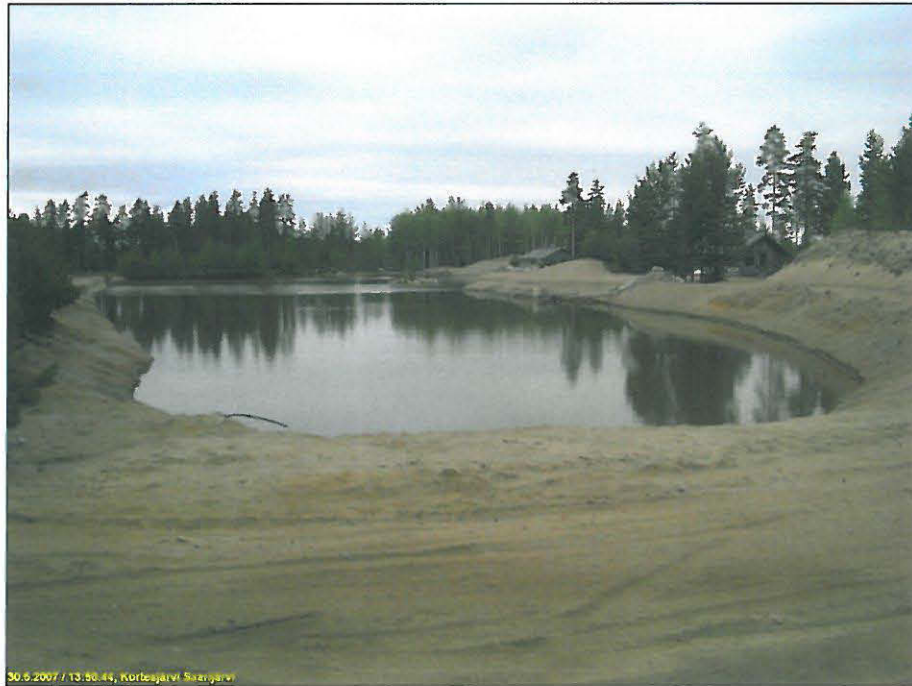
Länsirannan maisemoitua vanhaa hiekkakuoppaa. Kuvattu pohjoiseen.