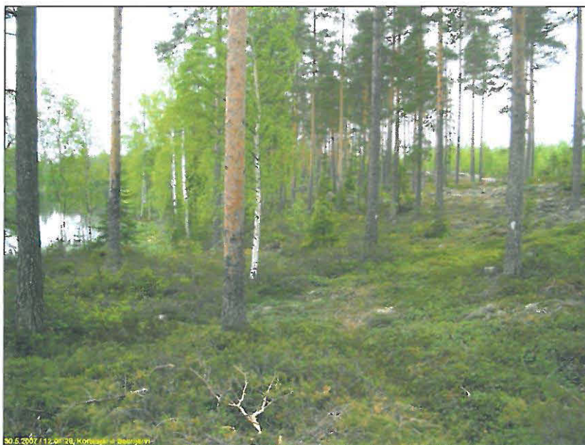
Saarijärven itärantaa kuvattuna pohjoiseen.