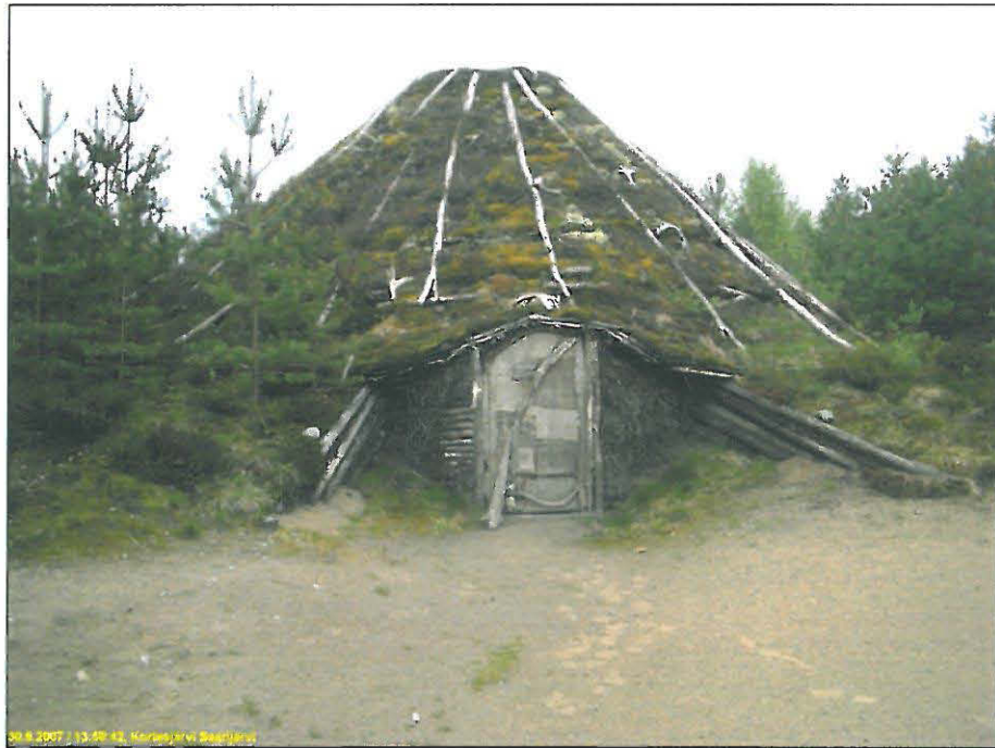
Kivikautisen asumuksen rekonstruktio Saarijärven länsirannan tuntumassa.