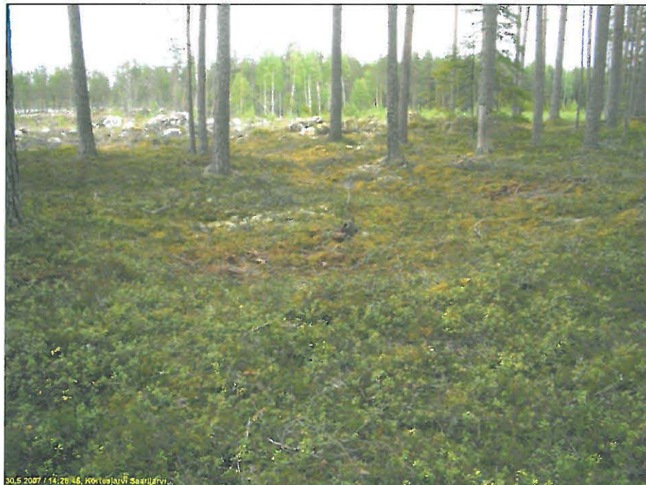
Alla asumuspainanne polun varressa, kuvattu länteen.