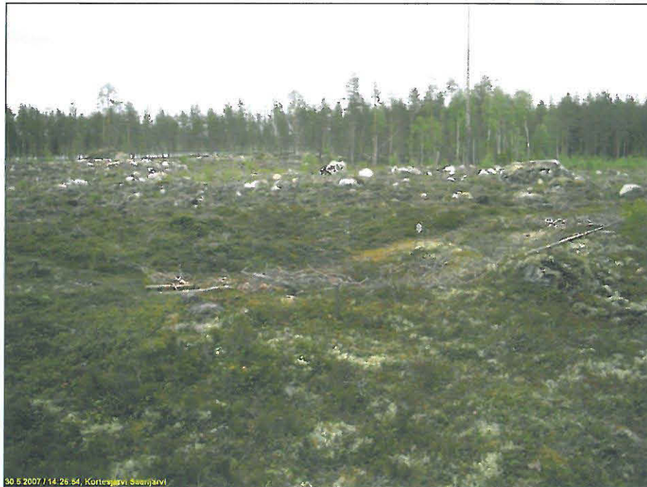
Asumuspainanne hakkuuaukean reunalla. Kuvattu koilliseen.