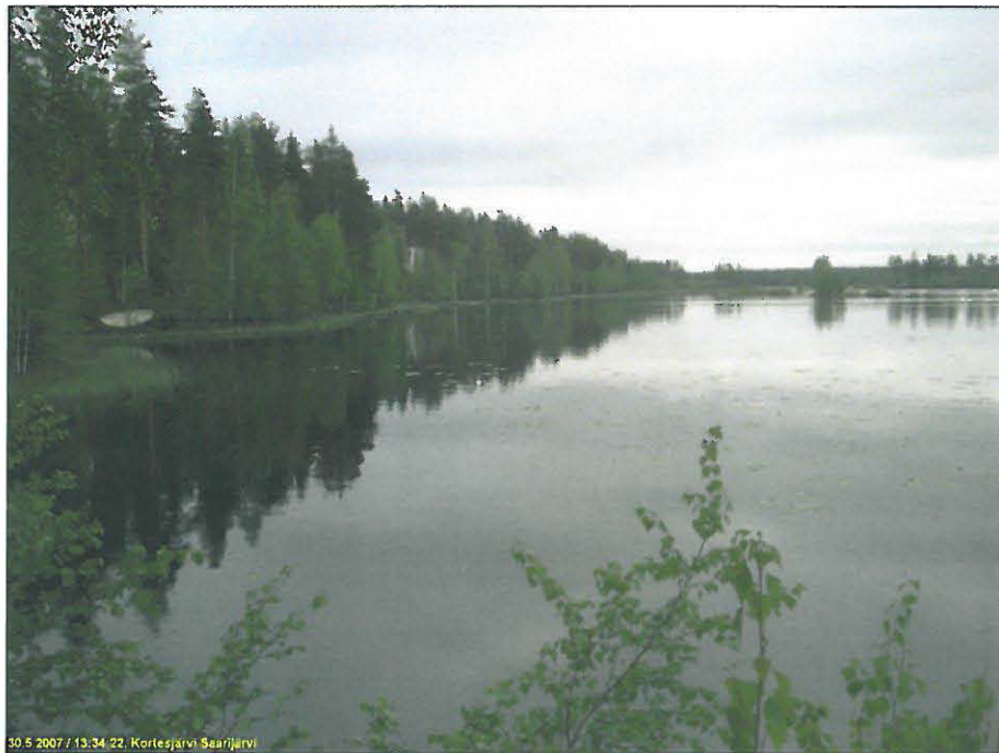
Itärantaa kuvattuna tutkimusalueen pohjoispäästä etelään.