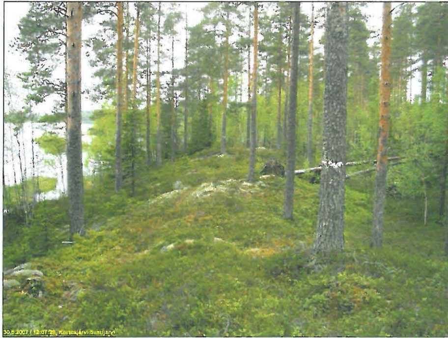
Itärannan keskiosan rannan "punkaa" – kapeaa moreeniharjannetta.