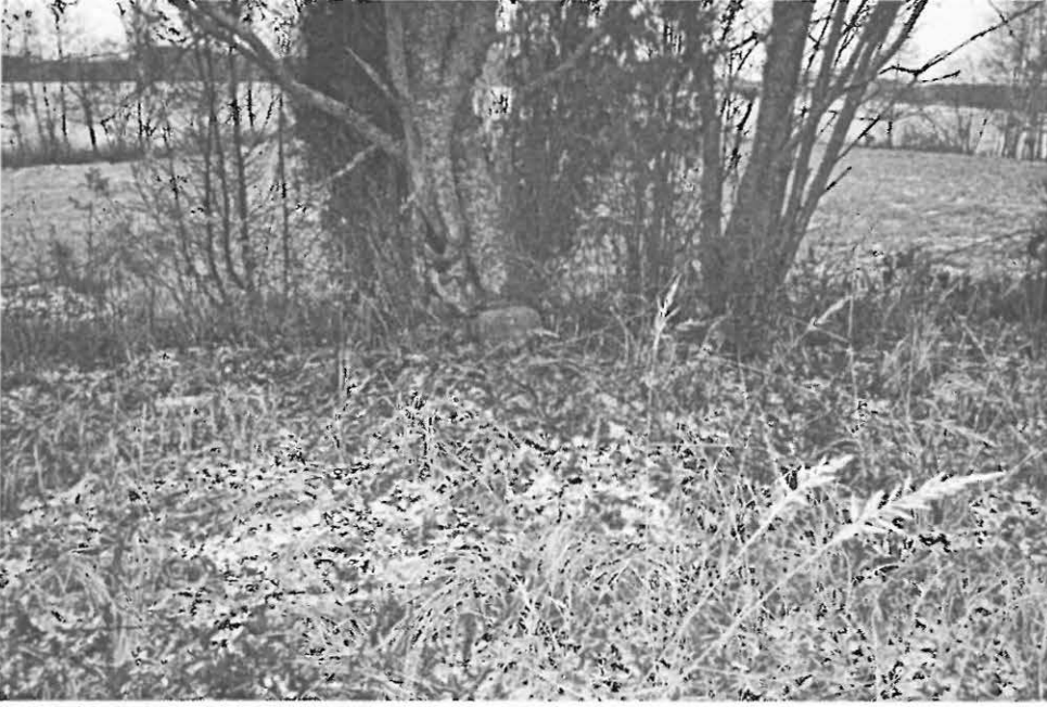
DG860:3. Røykkiö B. Ajoittamaton. Pohjoisesta.