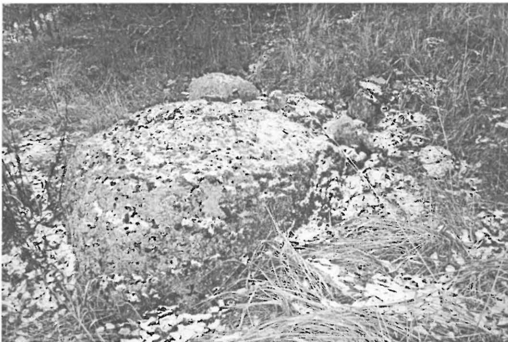
DG860:2. Röykkiö A. Maakiven viereen on kasattu kiviä. Ajoittamaton. Idästä.