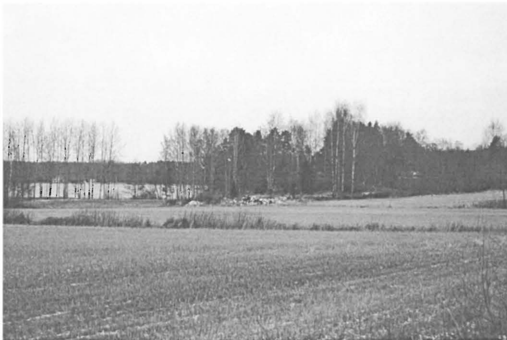
DG860:1 Metsäsaareke, jossa röykkiöt sijaitsevat. Pohjoiskoillisesta