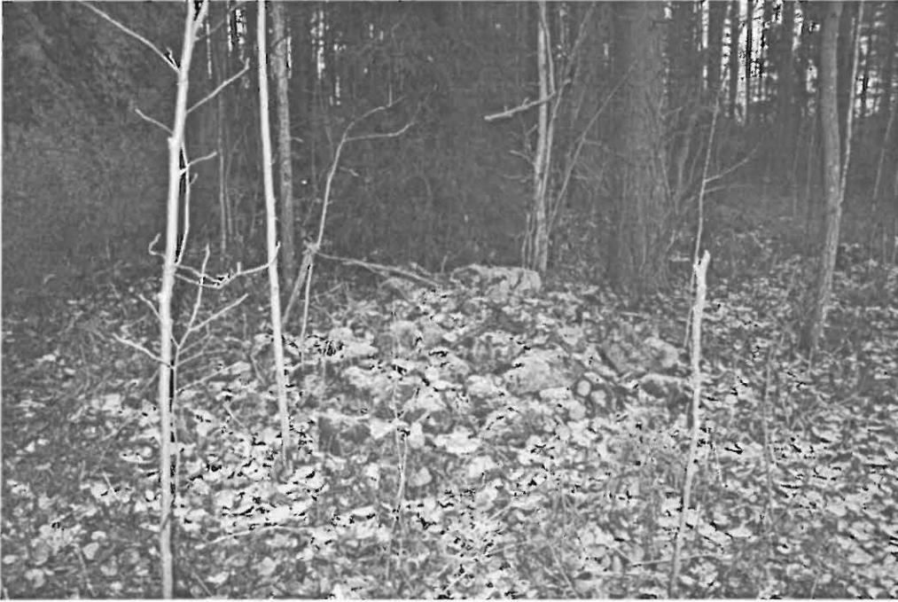
DG859:2. Rökkiö B. Ajoittamaton. Länestä.