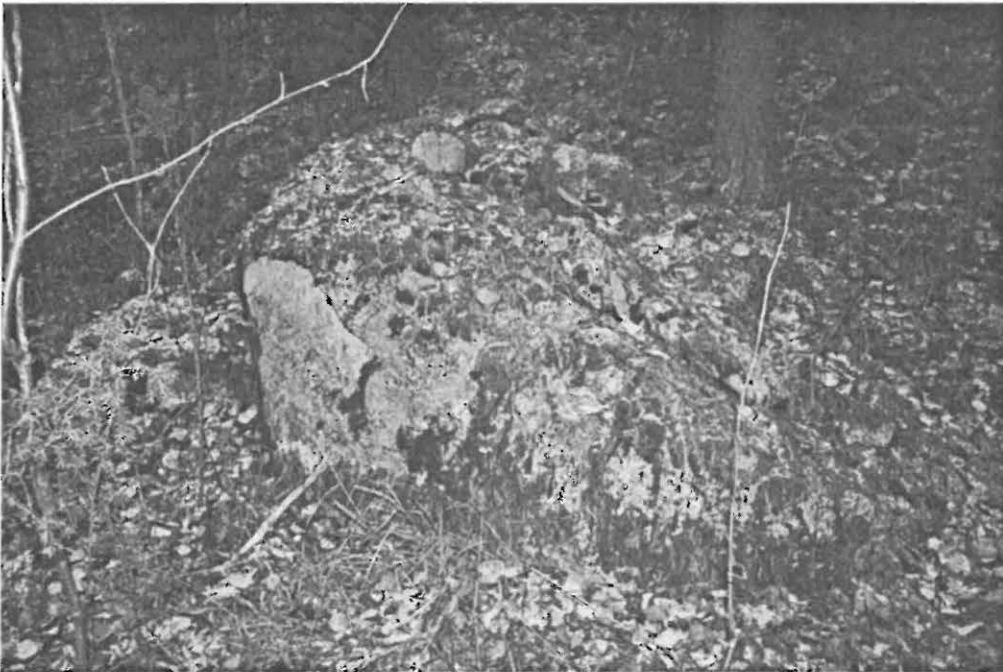
DG859:3. Rökkiö C. Ajoittamaton. Etelästä.