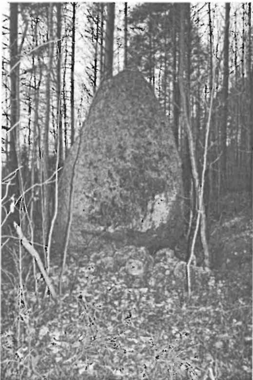
DG859:1. Röykkiö A. Ajoittamaton. Idästä.