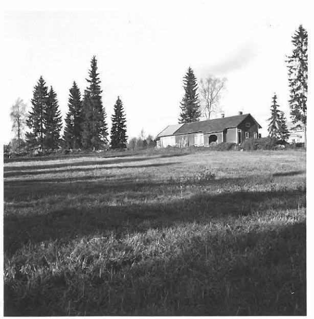
ASUINPAIKKA KUVATTU ETELÄSTÄ. LÖYTÖJÄ PÄÄASIASSA ULKORAKENNUKSEN VASEMMALLA PUOLELLA JAEDESSÄ OLEVALTA PELTOALUELTA. OIK. ASUIN- RAKENNUS. M. HUURRE 1963