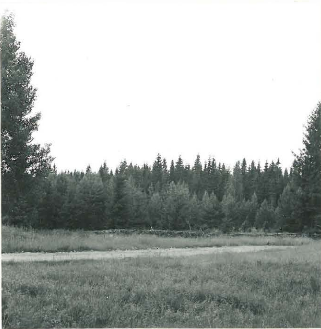
f. 33105 Stortorsin Kivikautinen asuinpaikka pohjoisesta