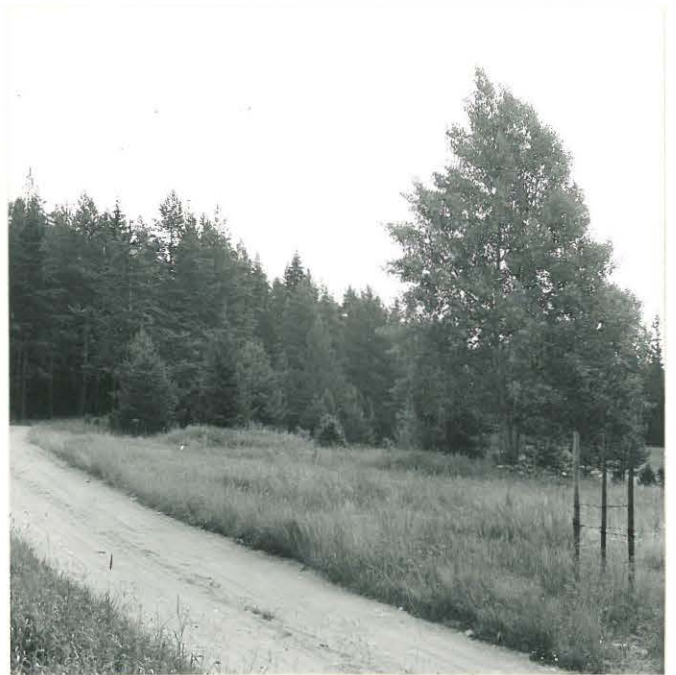
f. 33106 Asuinpaikka lännestä