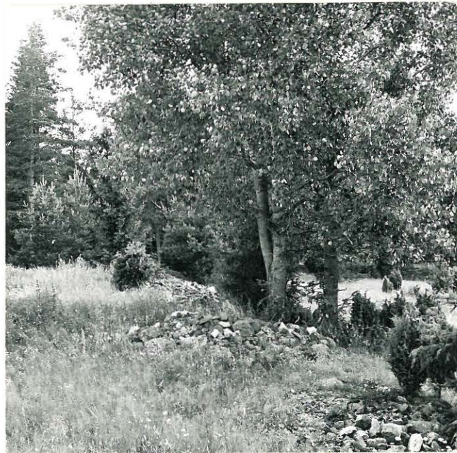
f. 33107 Näkymä Stortorsin aukiolta