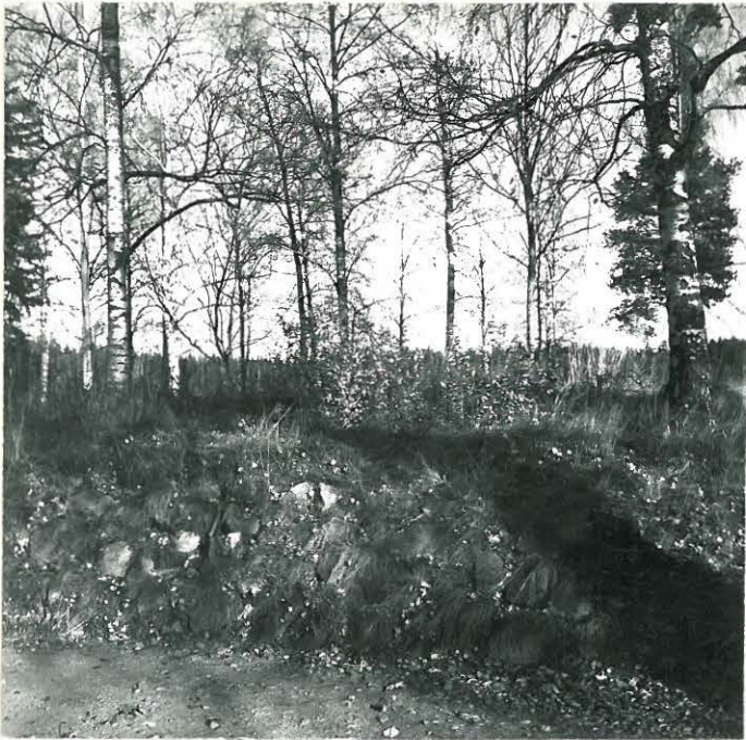
KUVA 8. F. 39438 KAURIALAN RÖYKKIÖTÄ POHJOISESTA NÄHTYNÄ.