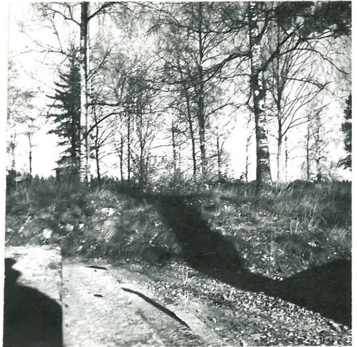
KUVA 9. F. 39439 RÖYKKIÖ KAURIALAN PIHAAN JOHTAVAN TIEN ITÄPUOLELLA. KUVA LUOTEESTA.