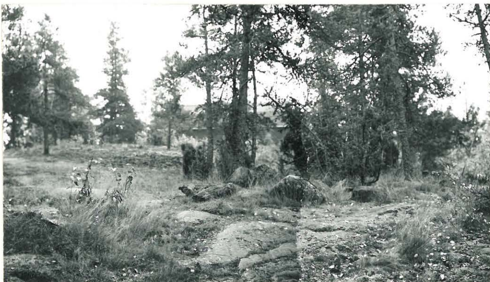
KUVA 2. F. 39431

KIVIEN JA MAAN SEKAINEN RÖYKKIÖ PIENEN KALLION KUPEESSA. KYSEESSÄ ON MAHDOLLISESTI VANHAN RIIHEN KIVAS. KUVA IDÄSTÄ.