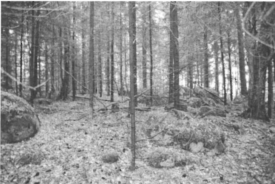
f. 138 079

Inventoinnin jälkeen käytiin lähitiloilla, Nokassa ja Ravossa, mutta maanomistajat eivät olleet kotona. Molempiin taloihin jätettiin kirjalliset ilmoitukset inventoinnista ja tehdyistä ha-