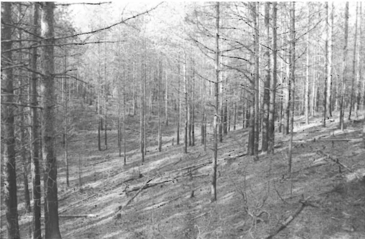
f. 138 074

Osayleiskaavan suunnittelualue sijaitsee pääosin luonnonmaisemaltaan Salpausselän etumaastossa. Salpausselän korkeus on n. 100 – 105 m mpy. Sen etelärinteen korkeimmat muinaisrannat ajoittuvat varhaismesoliittiselle ajalle, Baltian jääjärven rannoille, yli 11 000 cal BP korkeustasolla n. 100 m mpy. Yoldiameren syntymisen yhteydessä, n. 11 200 vuotta sitten Itämeren altaan vesi laski nopeasti ja Salpausselän etelärinteillä muinaisrannat löytyvät korkeustasoilta 92 – 96 m mpy. Tässä vaiheessa Salpausselän eteläpuoliset alueet olivat lähes avomerta, nykyään laajaa savitasannetta. Tasanteen läpi virtaa muutamia pieniä Vuoksen sivupuroja ja savipeltojen keskeltä nousee muutamia korkeita moreeniselänteitä, Yoldiameren rannan läheisyydessä sijainneita pieniä saaria ja luotoja. Tämän jälkeen vesi laski nopeasti Salpausselältä kilometrien päähän. (Jussila 1998:6–8, Pesonen 1998:4-5 ja Eronen 1984: 34.)