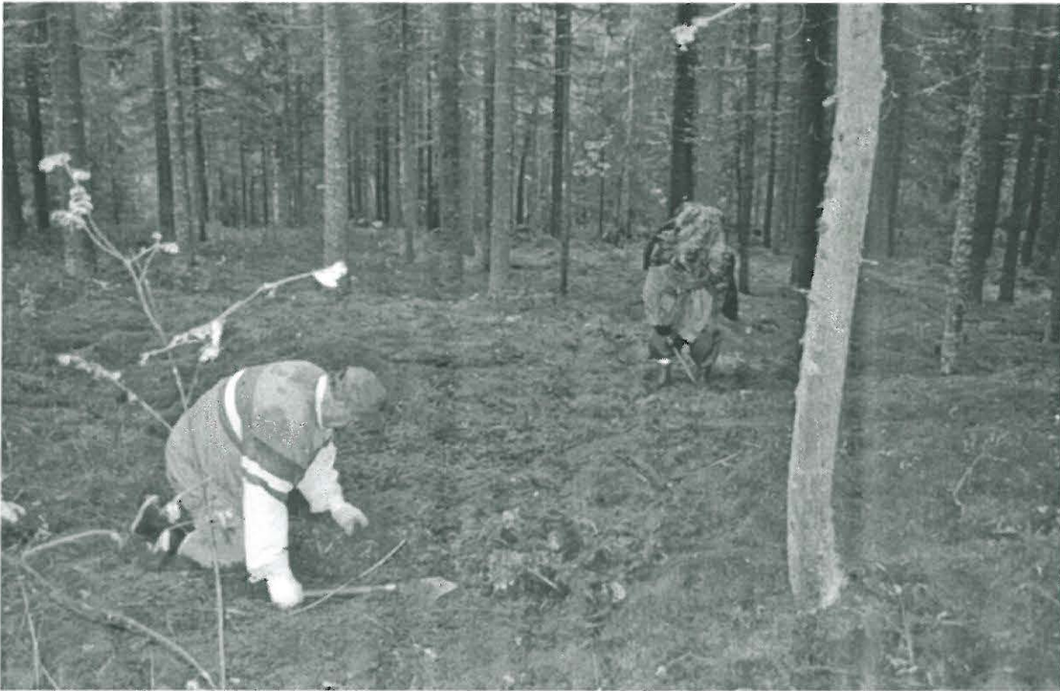
f. 138 078

1a. Paikalla sijaitsee sammaleinen tasanne, jolla kasvaa vanhaa havuvaltaista metsää. Tasanteen kaakkoispuolella maasto laskee soistuvalla alueella 90 m korkeuskäyrän alapuolelle.