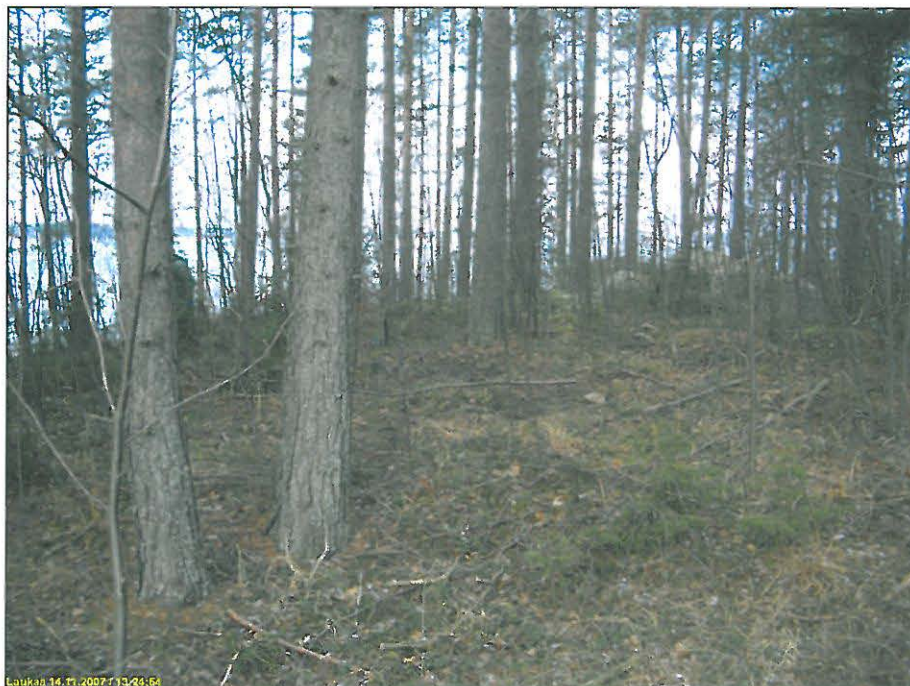
Asuinpaikan lounaisosaa, mistä löydöt, kuvattu pohjoisluoteeseen.