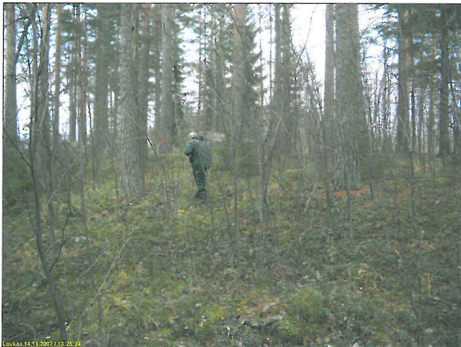
Asuinpaikkaa kuvan alalla lakitasanteen länsireunalla. Kuvattu Pohjoiseen. Ks. myös kansikuva.