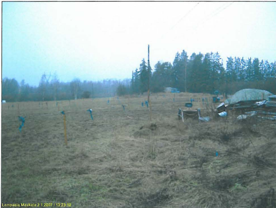
Lempäälä Maakala 2:1.2007 / 13.25.12