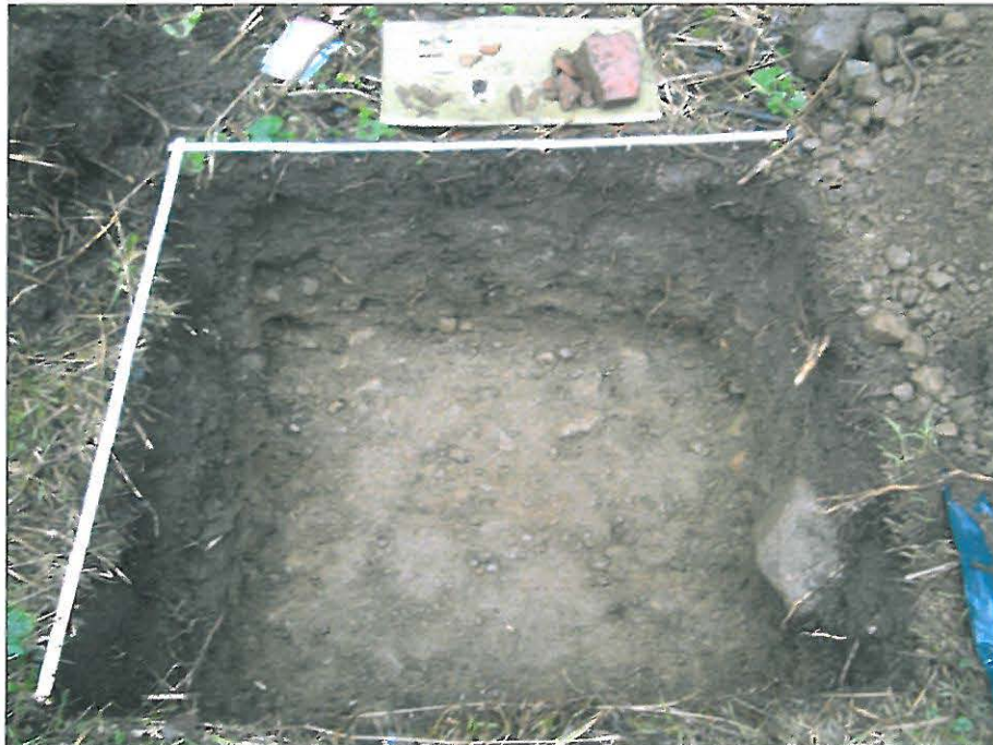
Koekuoppa, puhdas ja koskematon pohjamaa on kaivettu esille.