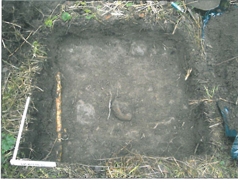
Koekuoppa, jossa on kaivettu pois pinnassa ollut löytökerros, sen alla vanhemman ajan sekoituneen kerroksen pinta