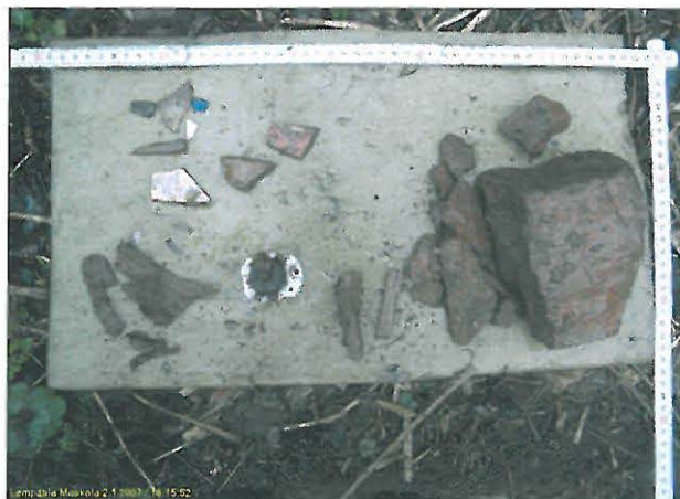
Kuopan pintaosan antia.