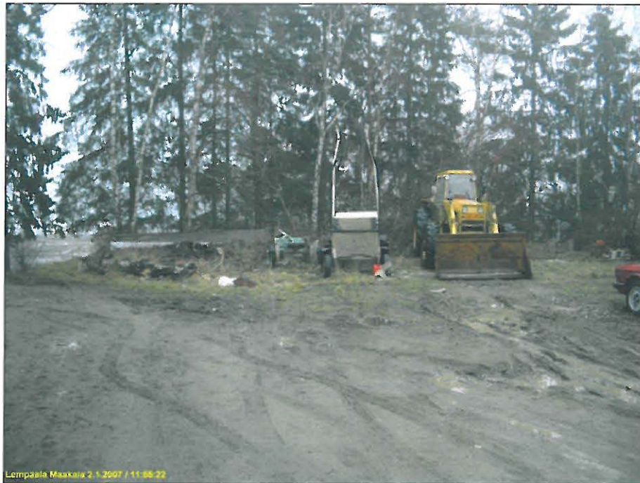
Koekuoppa asuinrakennusten välisellä alueella, kuvassa keskellä olevien rattaiden takana