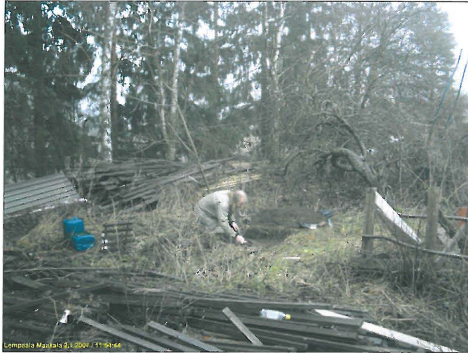
Koekuoppa kaivetaan pihamaalla, päärakennuksen kaakkoispuolella. taustan puut ovat vanhalla rantatörmällä. Kuopan sijainti: y 2487 466 x 6799 686.