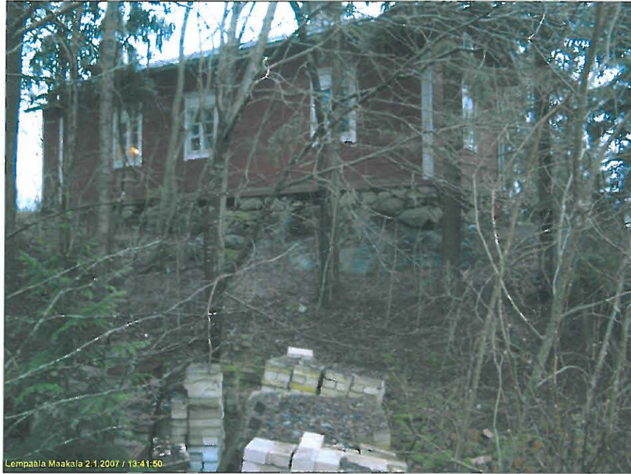
Kumpulan talon länsipuoli ja kallionurkka. Alla Kumpulan talon itäpuoli, pengerretty laki.