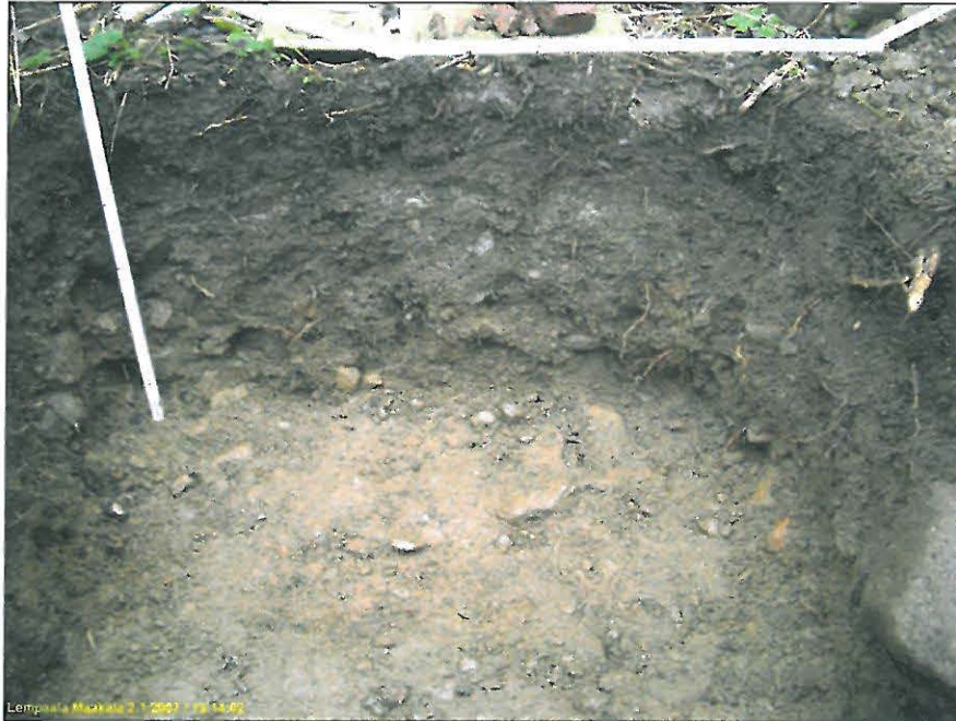
Koekuopan itäseinämä. Ei merkkejä vanhemmasta kulttuurikerroksesta. Alla eteläseinämä.