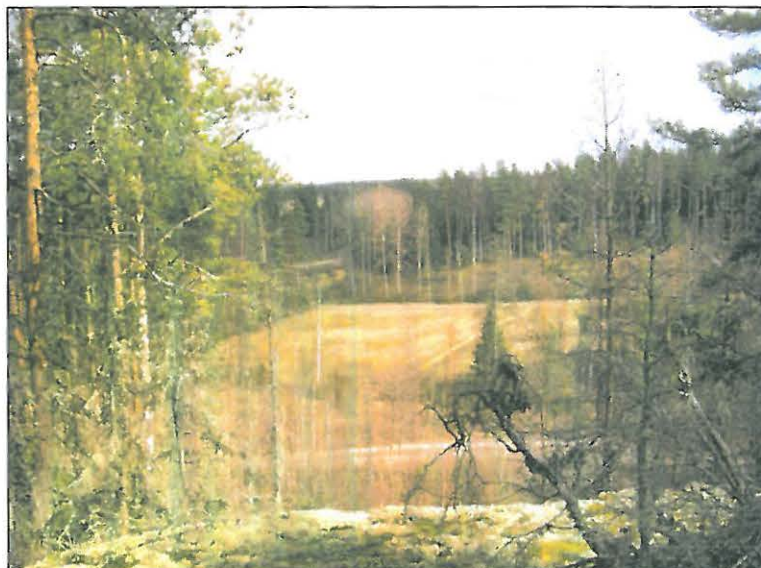
Näkymä alueen eteläreunan keskiosasta itään.