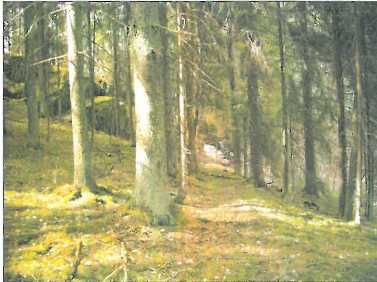
Tasannetta alueen kaakkoiskulmassa, purouoman länsipuolella.