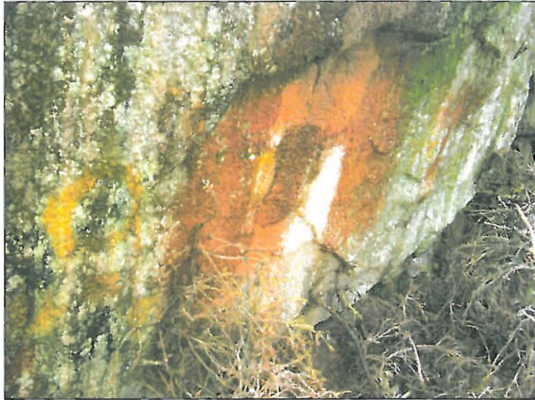
Edellisen "maalauksen" länsipuolella on suttaantunut maalaus. Kyseessä nykyajan maalaukset.