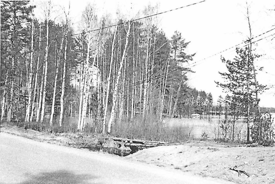
f. 145312. Inventoitavaa aluetta. Kuvattu etelästä.

Kaava-alueelta tarkastettiin tieleikkaukset ja paikat, joiden maaperä oli kulunut kuten kesäteatterin piha. Lisäksi lupaavimpiin kohtiin kaivettiin koekuoppia.