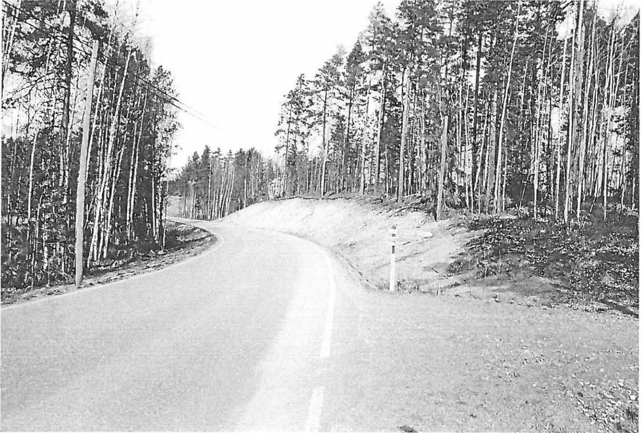
f. 145311. Loppi Parkuva. Tieleikkauksen profiilista löytyi kvartsi-iskos. Kuvattu etelästä.