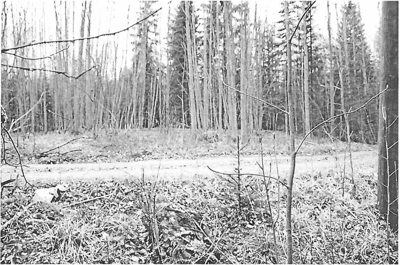
f. 145309. Kivikautinen asuinpaikka. Loppi Jokila 2. Kuvattu kaakosta.