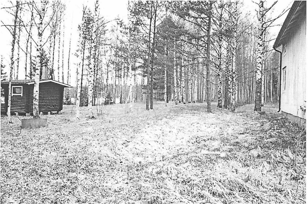
f. 145310. Loppi Jokila. Yleiskuva. Kuvattu idästä.