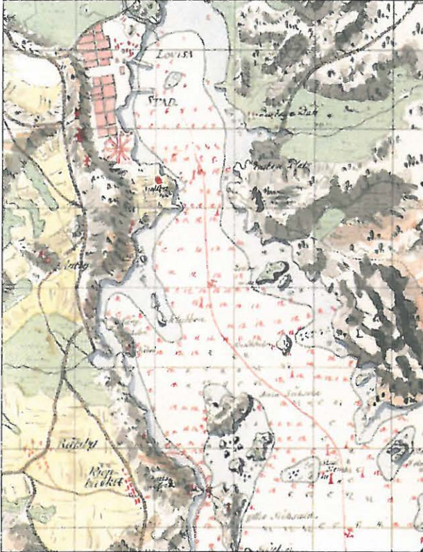
Kuva 2. Suunnittelualue hydrologisessa kuninkaankartastossa 1776 – 1805.

historiallisen ajan kiinteitä muinaisjäänöksiä laskettavia kohteita joita ei ollut enää merkittyinä nykyisiin karttoihin mutta jotka kuitenkin edustavat historiallisella ajalla tapahtunutta ihmistoimintaa. Jos edellä mainittuja toimintapaikkoja saatiin karttoja vertailemalla kohtuullisesti paikallistettua, merkittiin tarkistettavat alueet peruskarttaotteisiin kientätyövaihetta varten.