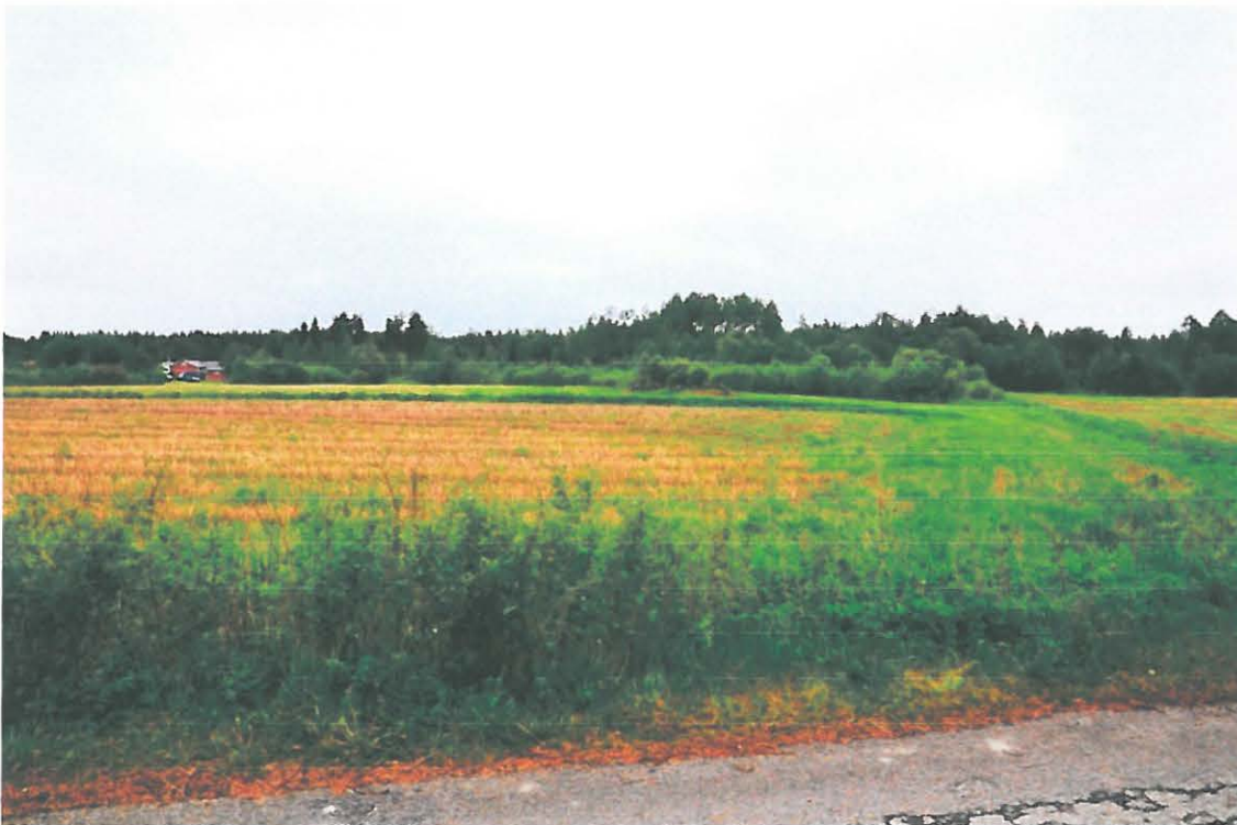
Kuva 2. Mikkelin Vuolinko. Peltoaluetta kuvattuna tieltä etelään. Keskellä kuvaa näkyy peltoraunio, joka sijaitsee kallioisen alueen kohdalla. (DG905_2)