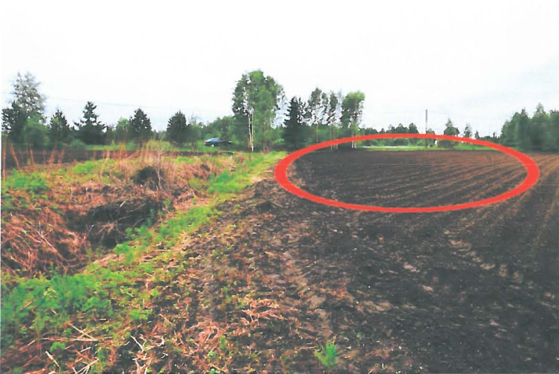
Kuva 1. Mikkelin Vuolinko. Helmi ja raha löytyivät kuvassa rajatulta alueelta, jonka eteläpuolitse kulkee pellon halkaiseva tie. Kuvattu koillisesta. (DG905_1)