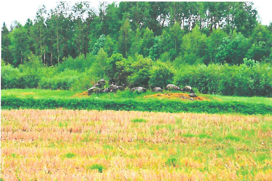
Kuva 3. Mikkeli Vuolinko. Peltoalueen keskellä sijaitseva peltoraunio kuvattuna pohjoisesta. (DG905_3)