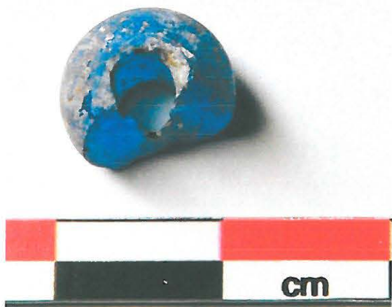
Kuva 4. Mikkeli Vuolinko. Inventoinnissa löytynyt rautakautisen lasihelmen katkelma, KM 38070:1. (DG905_5)