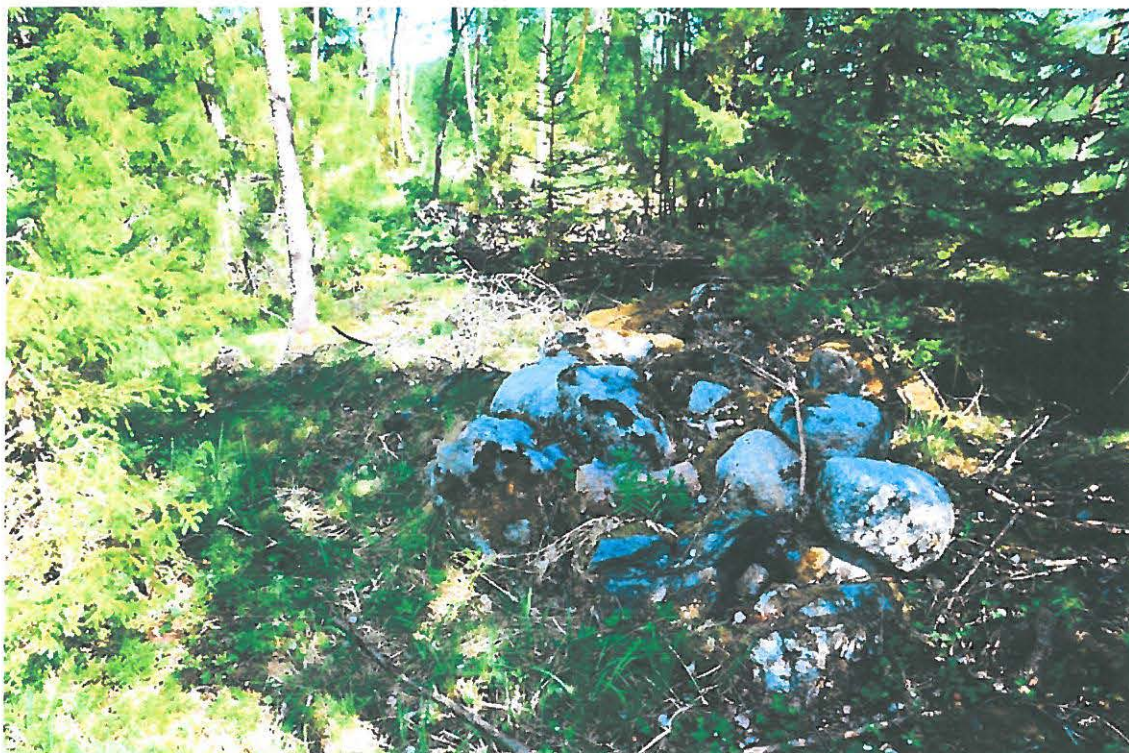
Kuva 4. Mikkeli Vuolinko. Peltoraunio nro 4 kuvattuna etelästä. Raunio sijaitsee kallion päällä hieman metsän puolella. (DG905_4)