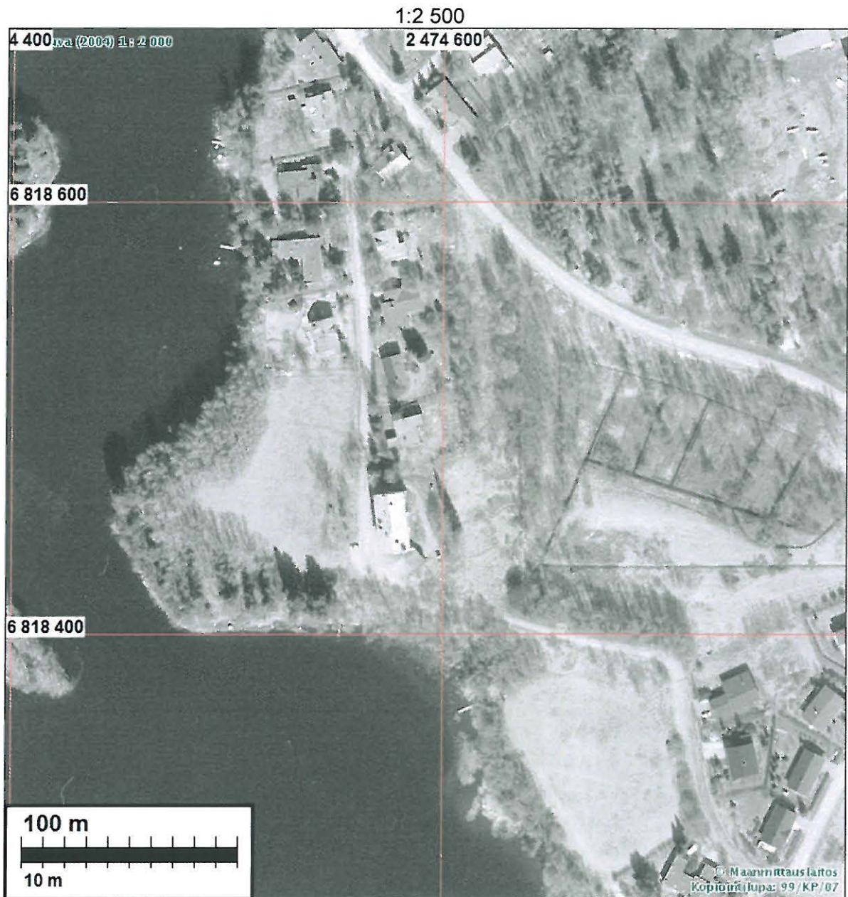
Ilmakuva alueesta – niemi kuvan keskellä oik.