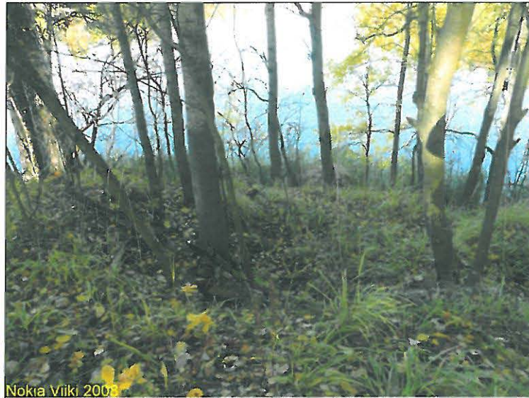
Rantatörmää alueen länsiosassa