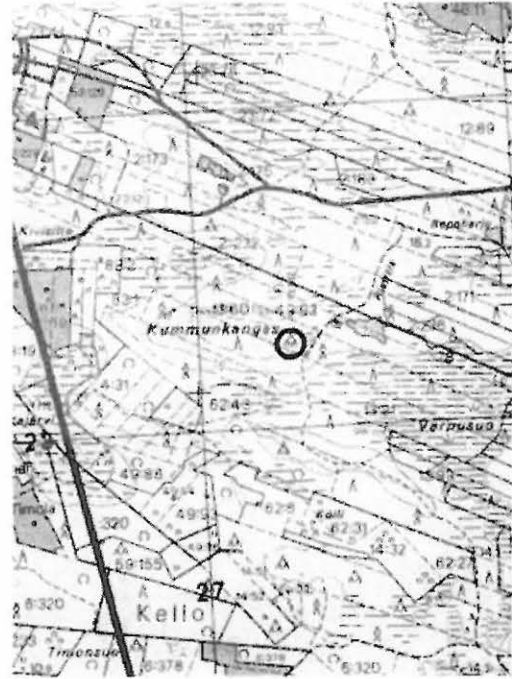
Kuva 1. Kohdetta koskevat tiedot teoksessa Pohjois-Pohjanmaan kiinteät muinaisjäänökset, osa I (Sarkkinen & Torvinen 1995, s. 81).