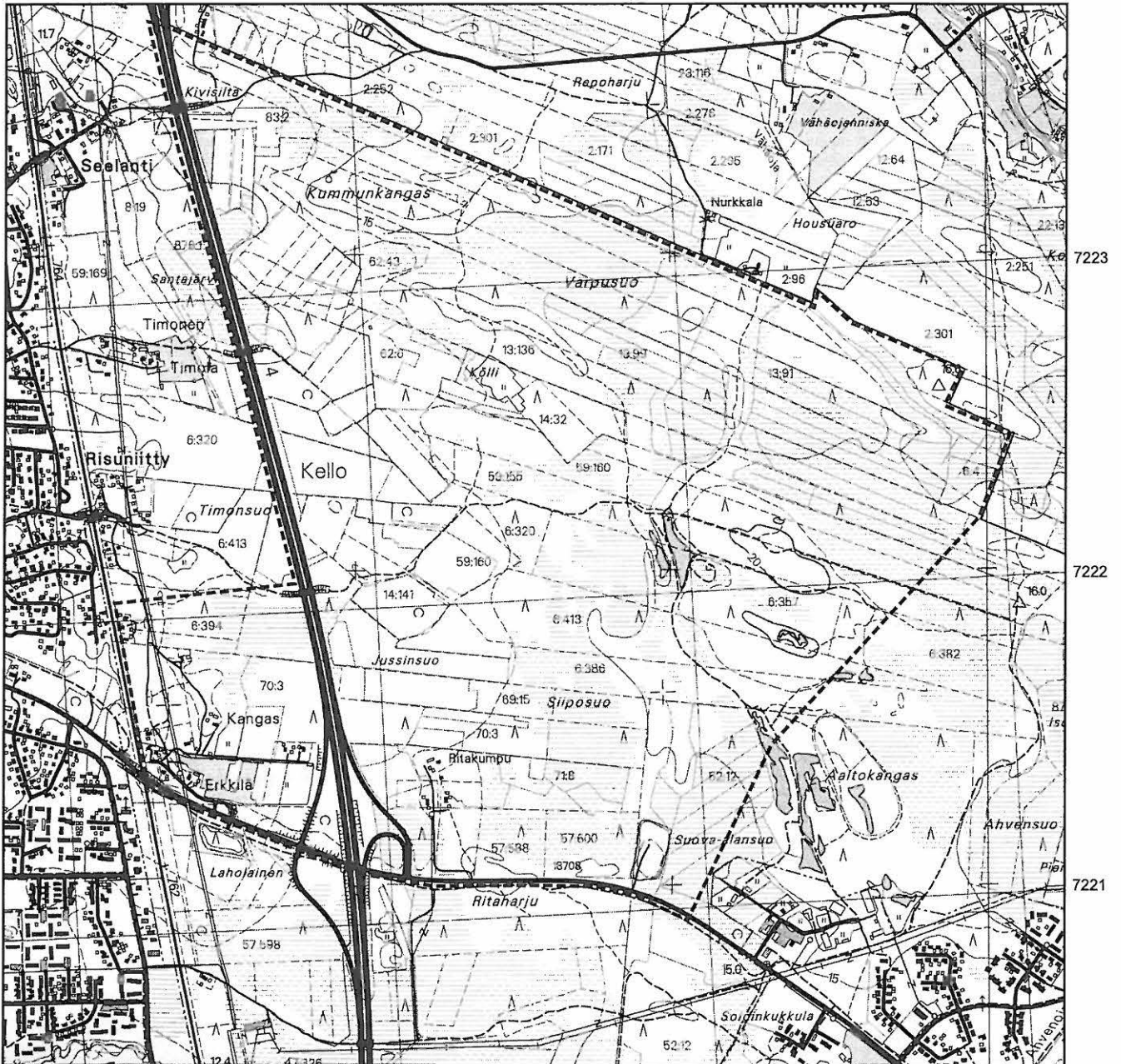
Kartta 1. Kaavaluonnosalueen rajaus peruskartalla (2533 07 KELLO, 1:20 000, Porvoo 2002).