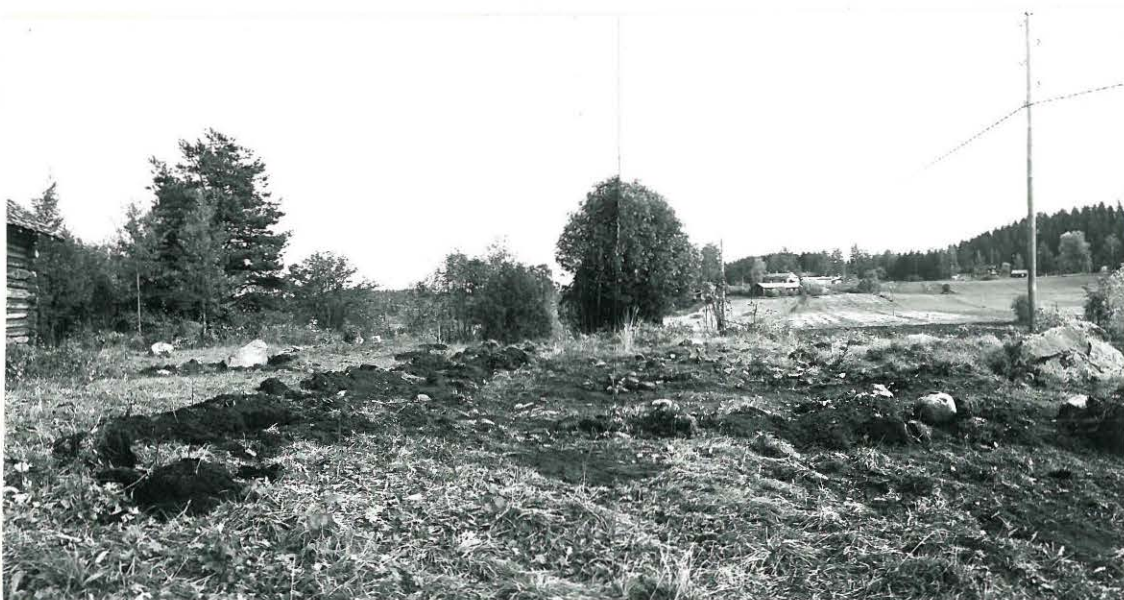
4. PANORAAMA, JAAKKOLANMÄEN LAKEA LÄNNESTÄ