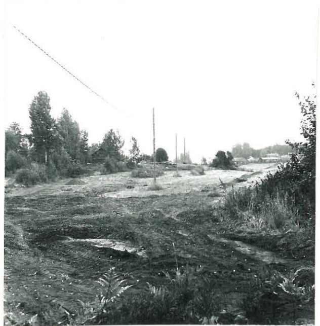
2. JAAKKOLANMÄKI ETELÄSTÄ LÄHELTA KAPAKAN RIIHTÄ