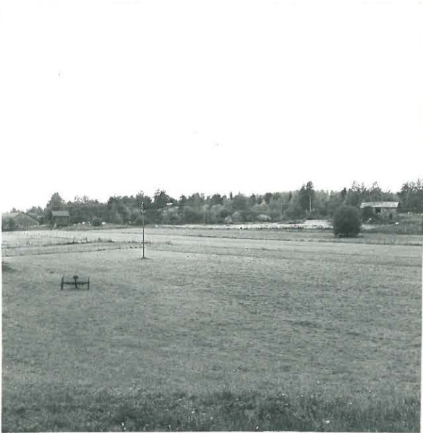
1. JAAKKOLANMÄKI OIKEALLA, KAPAKAN RIIHI VASEMMALLA KUVA KAAKOSTA