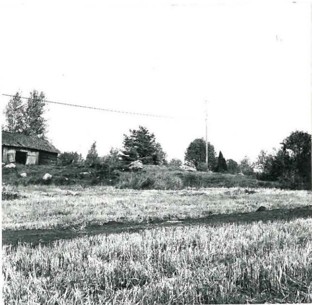
3. JAAKKOLANMÄKI KAAKOSTA