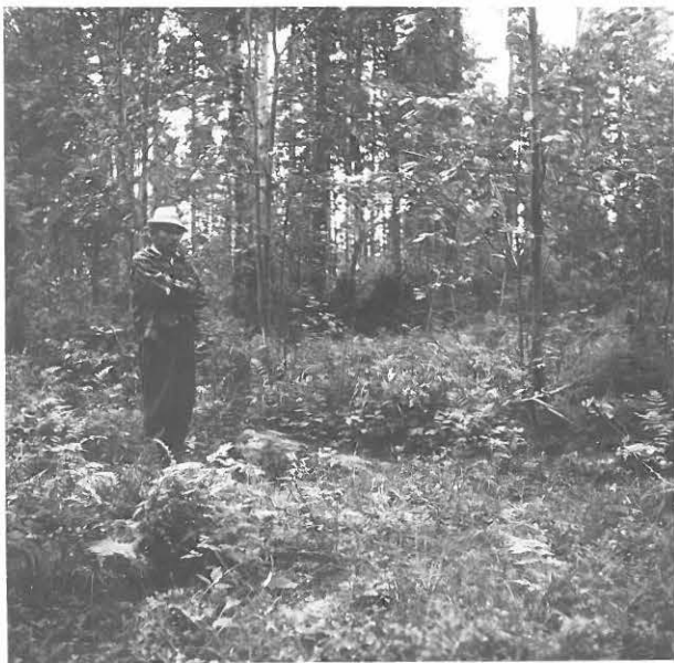
13. Sola, Paljakkevaara

"Uhrinkeinen" sijainti metsässä. Kuva otettu kaakosta.