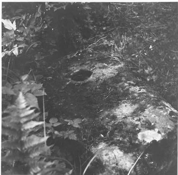
13. Sola, Paljakkevaara