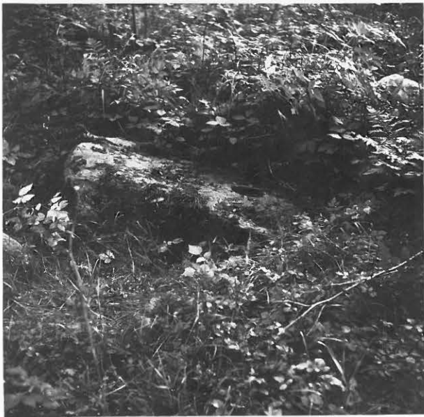
13. Sola, Paljakkevaara