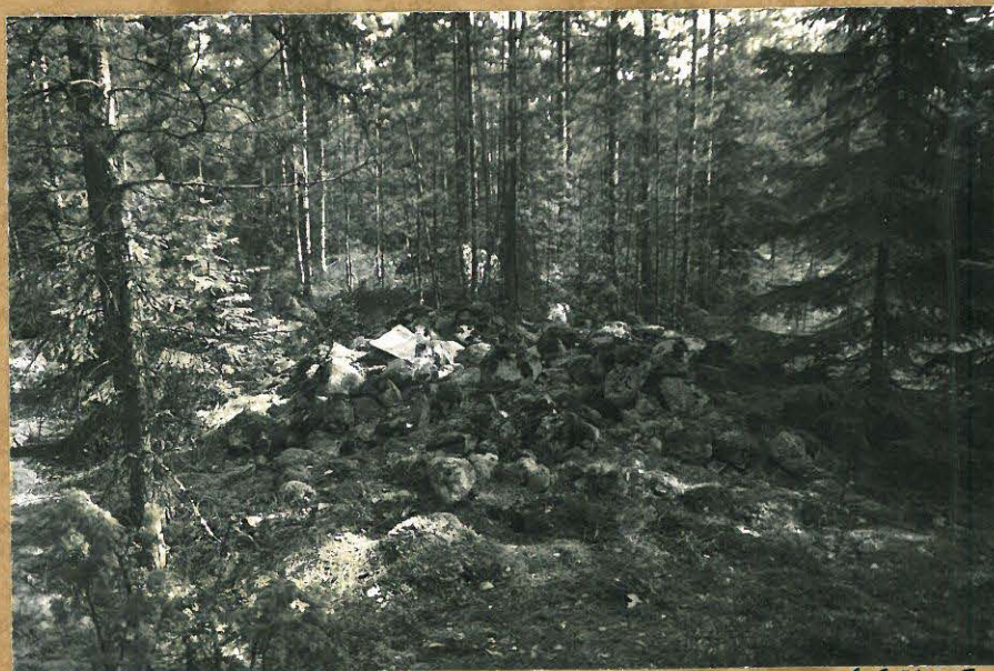
Kuva 4. Janna rõylyt, luv. lehtti f 85015 itaa