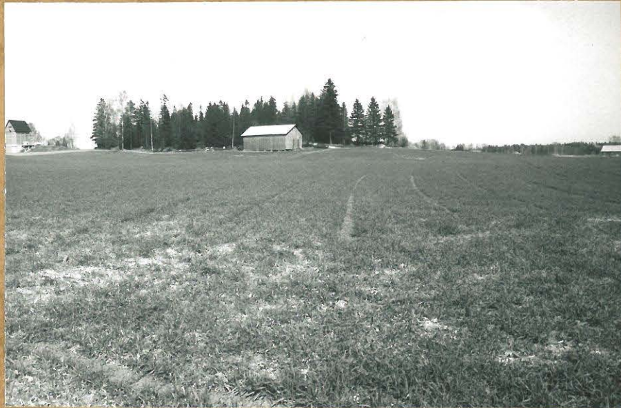
Kuva 1. Kivien km 254PI:1 Lytö + 85010 paikka etualalla pellolla varemalla Yrjösin talon ulkorakennus ja asuinpaik- kalyttö kuvan ulkopuol- lella, metsäsaarekkeen ta- hana Viioina lp. kuv. ⇒ ENE