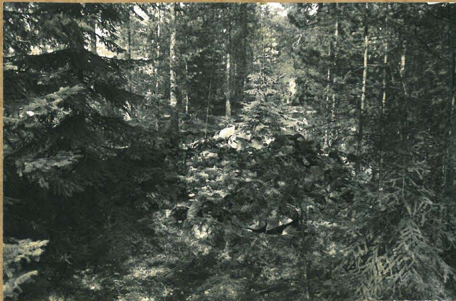
Kuva 3. Rõylyt naāeharppalla, luv. f 85014 lehtti paljoasta