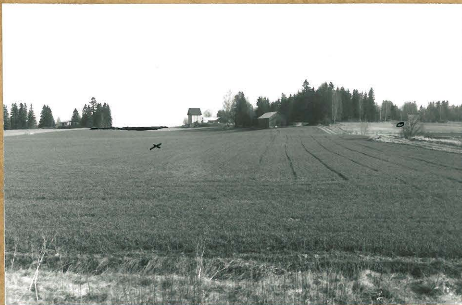
Kuva 2. Kivikautinen asuinpaikka + 85011 pellolla Lytöalue talvella metsäsaarekkeen viitoilla — kymälisellä, kivien lp. kinnalla x, oik. reunalla taustalla Viioina lp 0 kuv. Suhtedella tausta ⇒ N