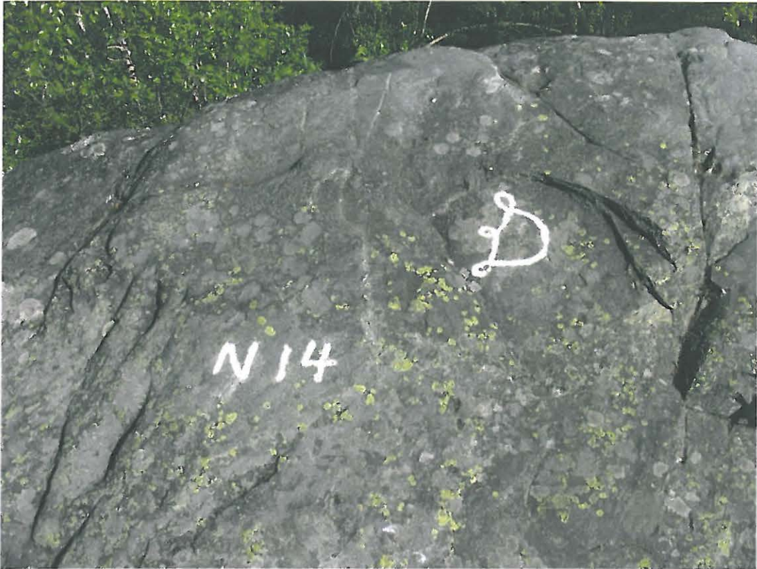
DG713:1. Kiven päälle tehtyjä kaiverruksia. Osa kaiverruksista on maalattu valkoisella ja keltaisella maalilla. Kiven keskellä näkyy myös reunasta lähtevä maalaamaton suora viiva, jonka ympärille on kaiverrettu heikosti näkyvä vuosiluku 1770. Lännestä.