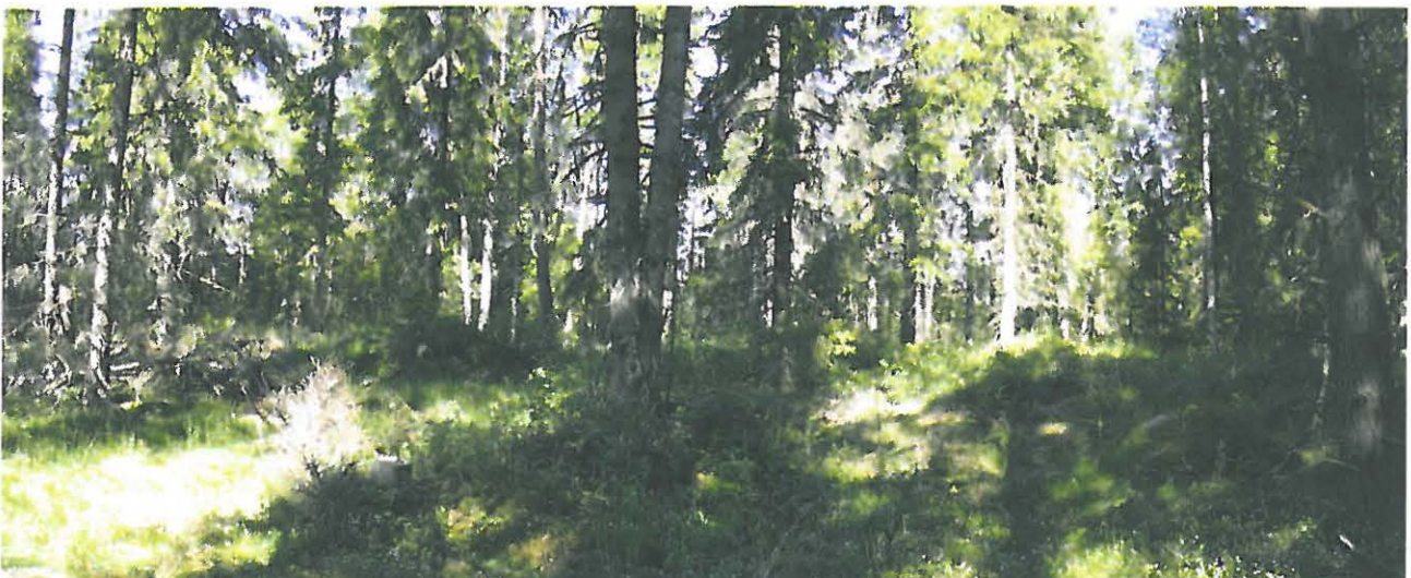
DG714:2. Parhalahti Vanhakartano. Kylätontti, panoraama. Idästä.