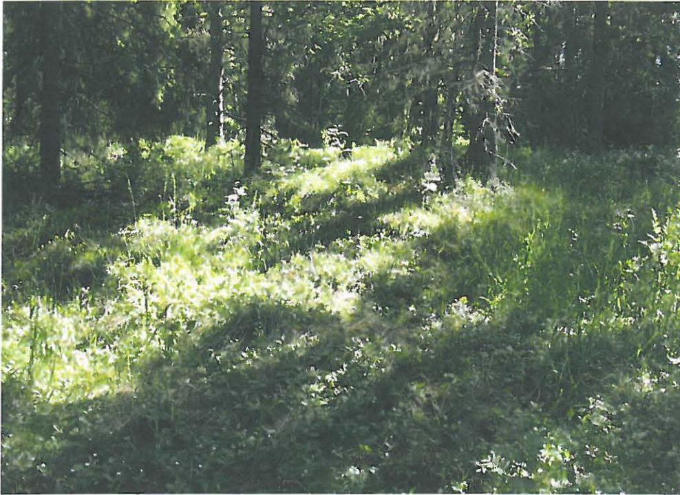
DG714:1. Parhalahti Vanhakartano. Noin 5 x 6 (-9)m kokoisen kivijalan perustusta. Kuvan keskellä on kivetyn uunin paikka. Lännestä.