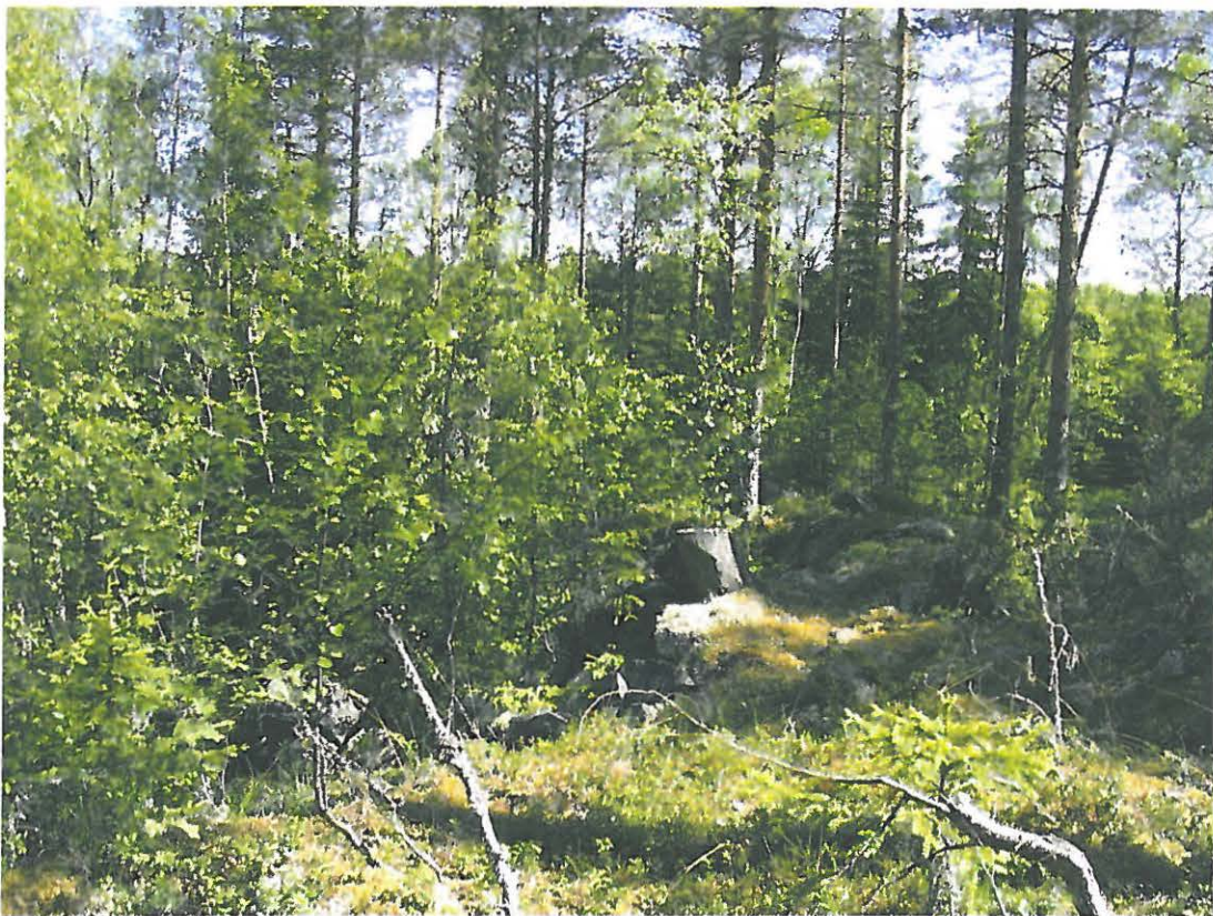
DG715:2. Kivilouhos Heinikarinlammen lähetyvillä. Lounaasta.