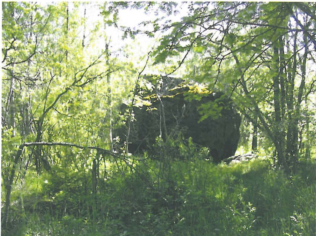
DG713:3. Hanhikivi. Yleiskuva rajakivistä. Lounaasta.