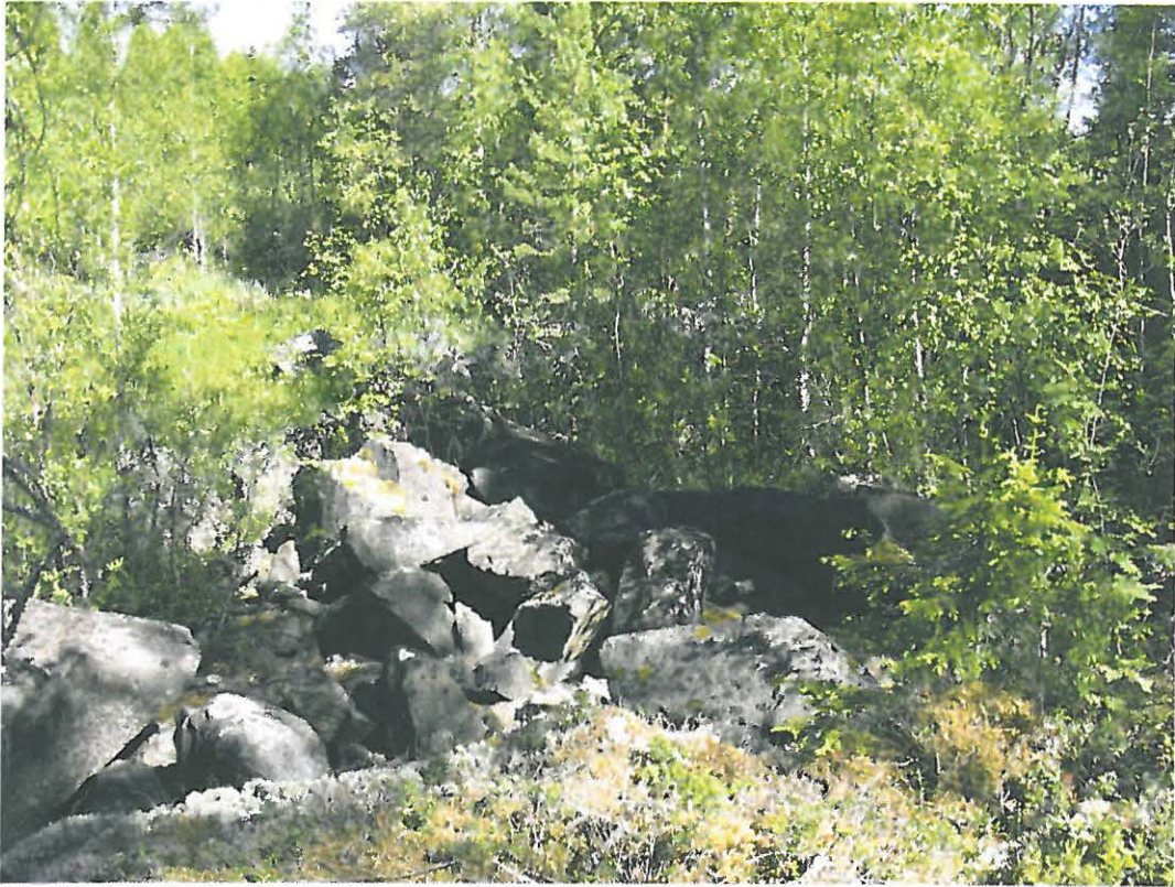
DG715:1. Kivilouhos Heinikarinlammen lähetyvillä. Etelästä. Kuva Katja Vuoristo.