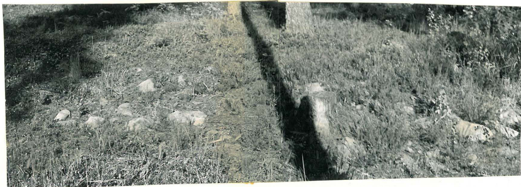
2. Kodanpohja Savilahden Rinkunmäellä. H. 32832, 32821