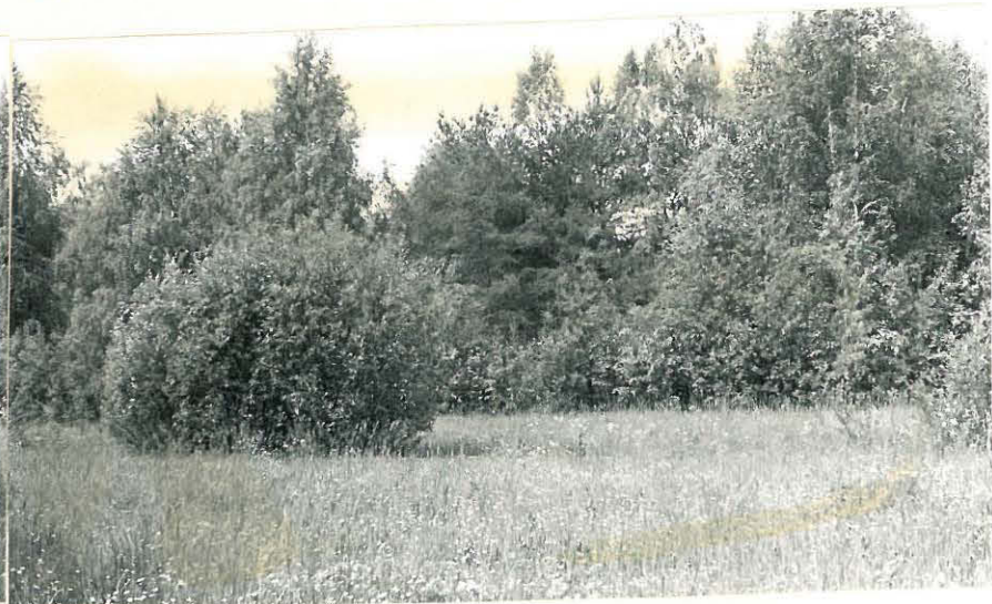
10. Mj. 12 on löytynyt tältä pelloilta. f. 32827, 32829