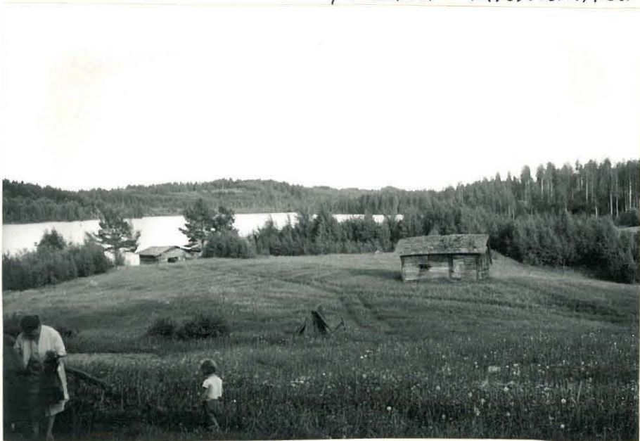
8. Kuusjärven autiotalon pihaa ja peltoja. f. 32843