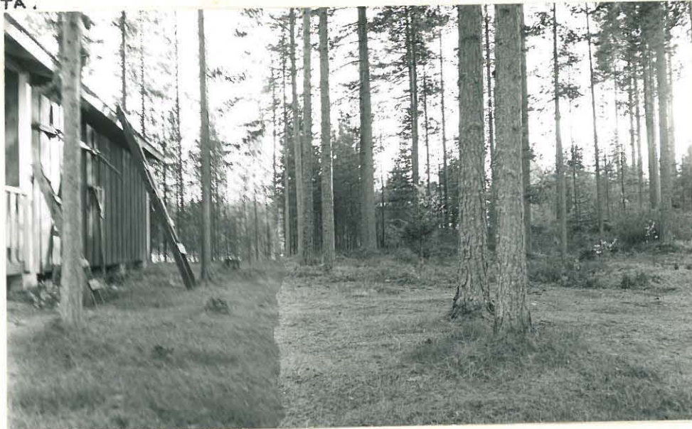
KUVA 1. RAUANJÄRVEN LÄNSIRANNALLA OLEVASSA KASKINIEMESSÄ MÖKIN YMPÄRISTÖSSÄ ON KIVIKAUTINEN ASUINPAIKKA. KUVA LÄNNESTÄ.