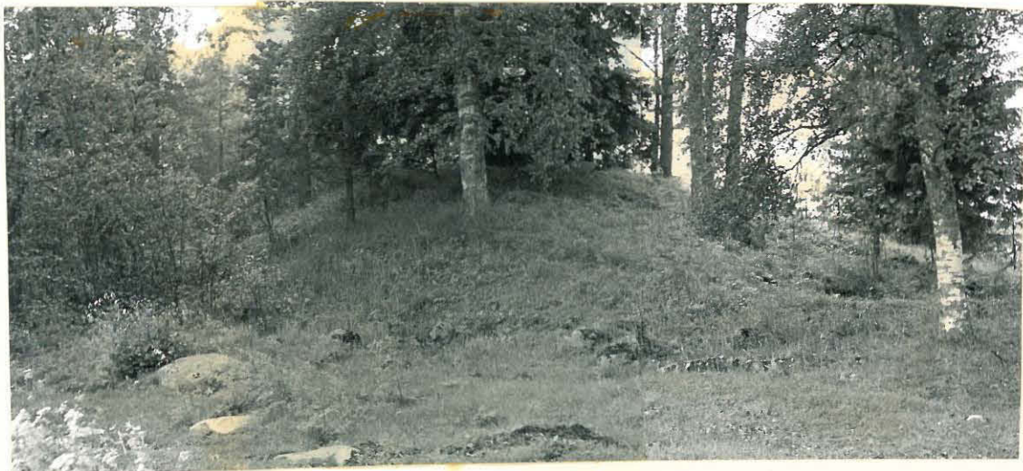
18. My. 17 epämaärdinen kivikumpu. f. 32846-32847