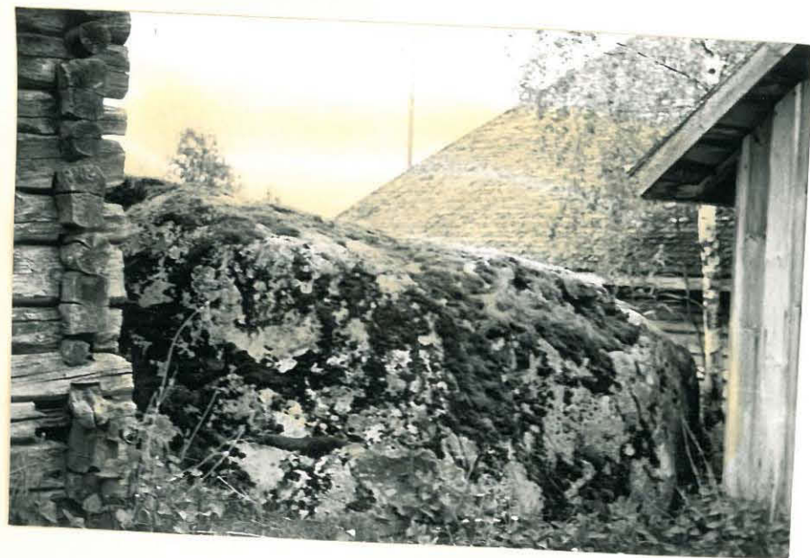
21. Aikakivi lännestä nähtynä. f. 32859 Pirjo Lahtiperä.