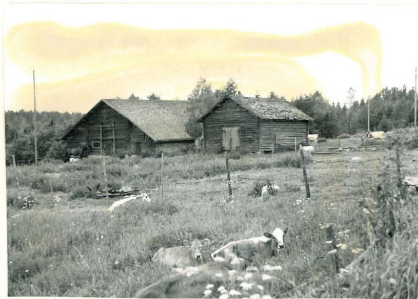
19. Aikakivi ladon jorun välissä f. 32867