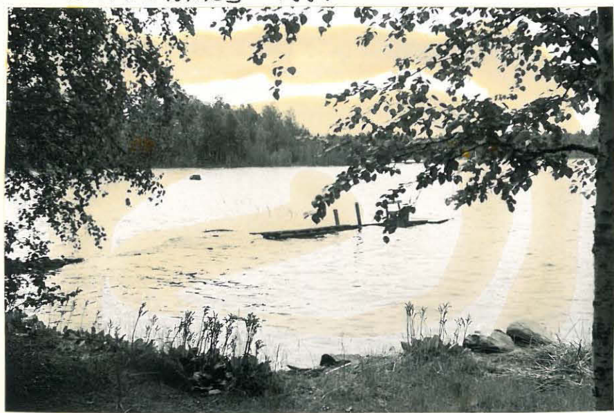
11. Mj. II löytynyt sillan edestä järven pohjasta. #.32838