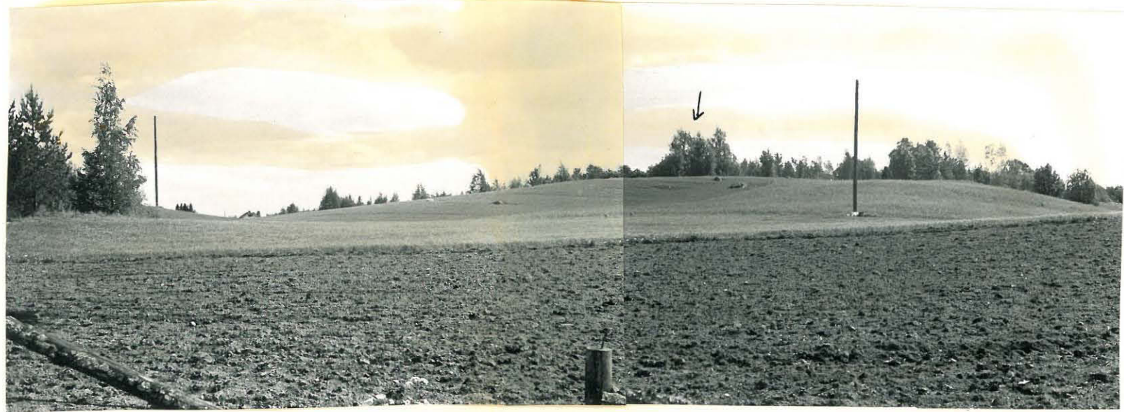
12. Ortodoksinen kalmisto on ollut täällä pellolla. Tasouuna on ollut nuolen osoittamalla paikalla. #.32834-32835