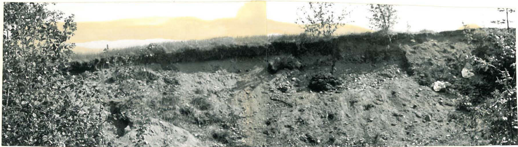
13. Ortodoksinen kalmisto tuliesiin tässä nickakuopassa 30v. sitten ff. 32839-32846