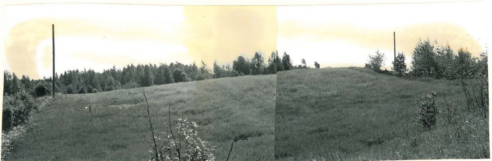
14. Sama kalmisto pohjoisesta nähtynä. ff. 32841, 32833