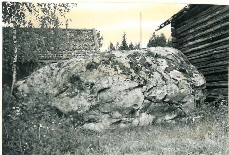
20. Aikakivi idästä nähtynä f. 32860