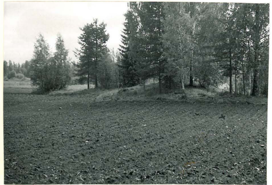
7. Mj. 4 löytynyt nistin osoittamasta kohdasta, Taustalla kivikumpu Mj. 16 ff. 32853