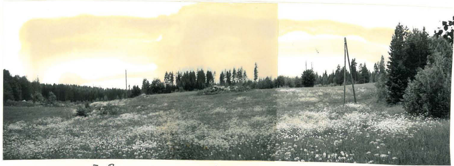
5. Porolanden asuinpaikka etelästä nähtynä. ff 32781-32782