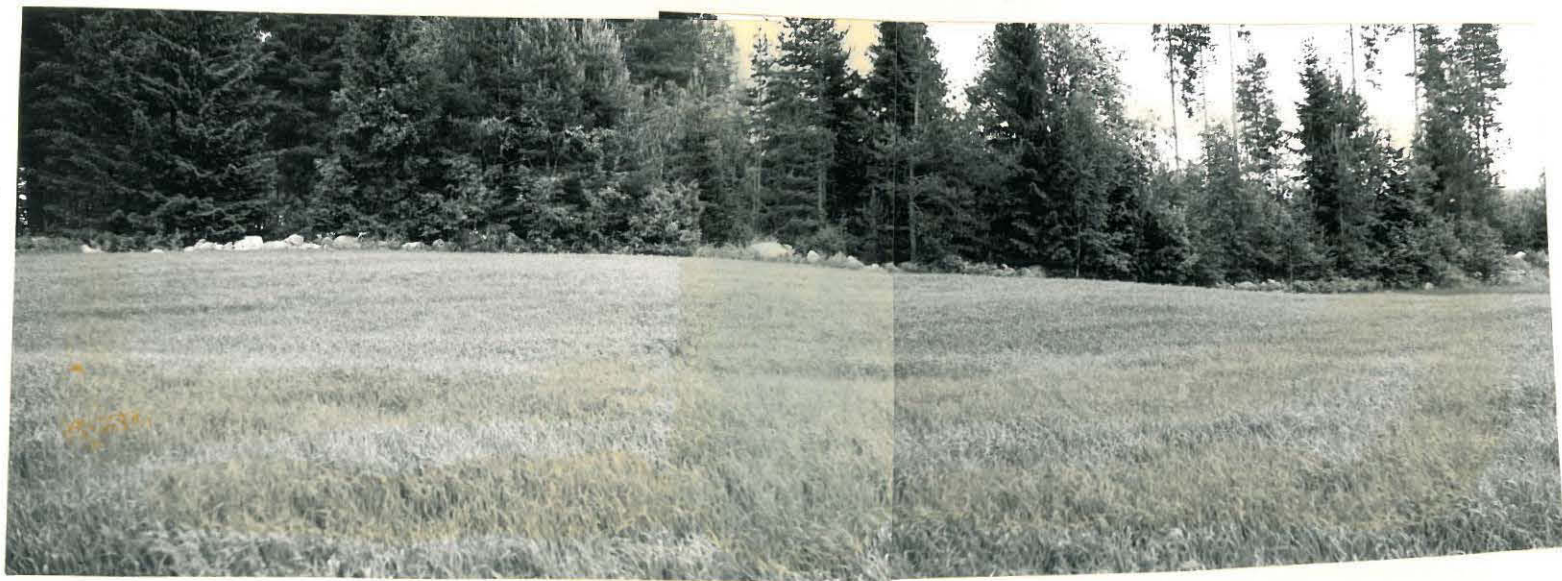
H. Porolahden kivikautinen asuinpaikka on ollut etualalla olevalla pellolla. H. 32779-32880