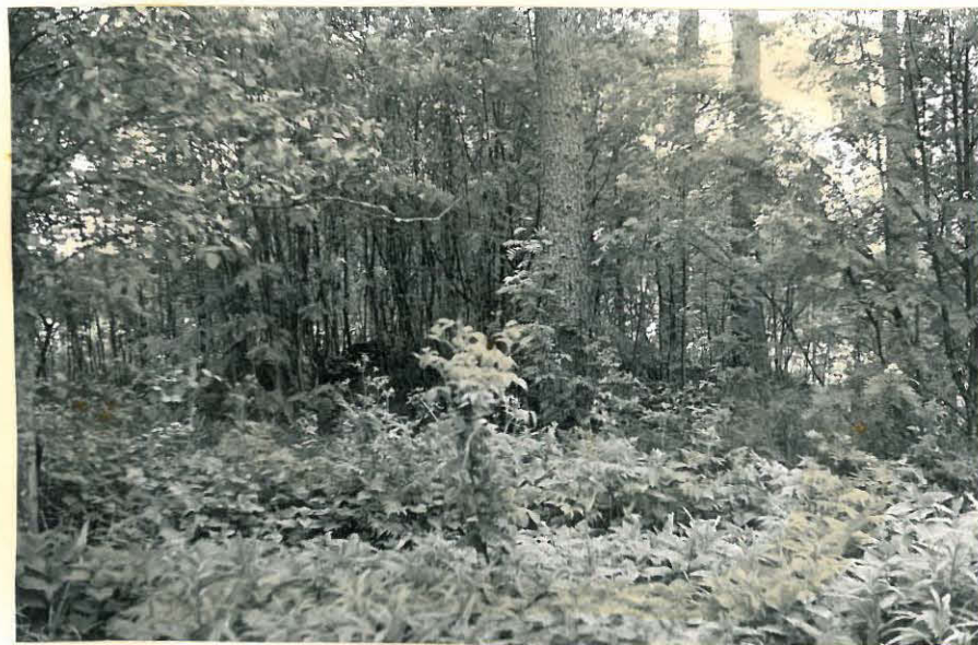
17. Mj. 15 takana keskellä täynnä pinlaajia. f. 32852