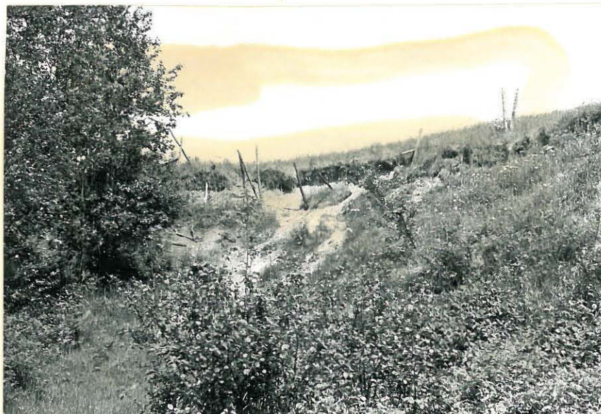
16. Mj. 14. kalmisto löytyi rou-sitten töstä hiekka kuopasta. f. 32836