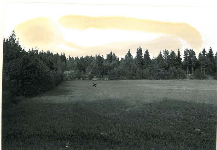
9. Mj. 16 on löytynyt ristin asoittamasta kolkasta f. 32850