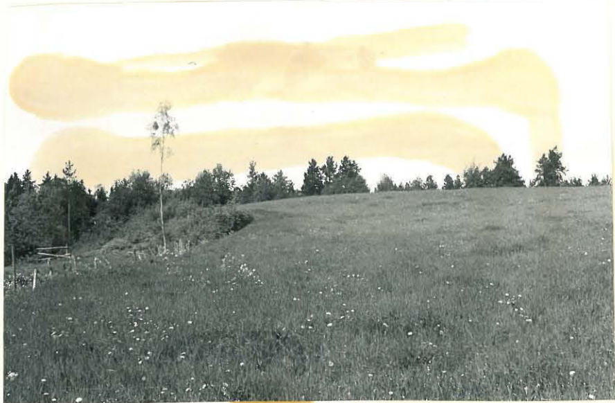
15. Mj. 14 ortodoksinen kalmisto ollut täällä pellolla. f. 32837