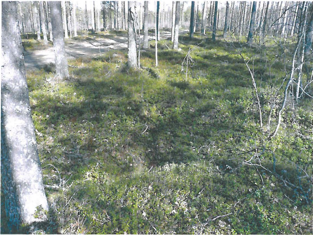
Kuva 1. Ispinäkaaran kuoppa kuvattuna lounaasta.