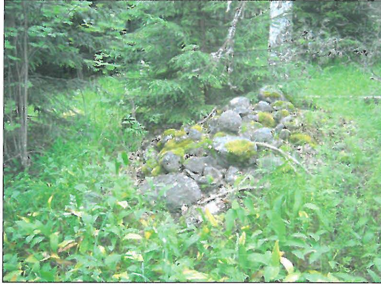
Peltoraunioita ja raivauskasoja. Yllä Ahvenniemessä, alla Linnaniemen pohjoispuolella